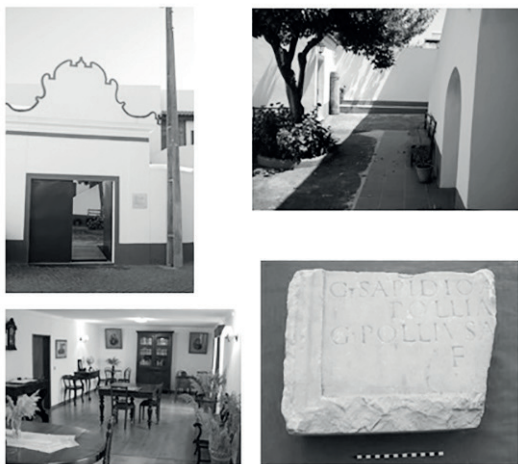
Figura 1. Imágenes de la sede de la fundación en Ervedal. Departamento de comunicación de la fundación.