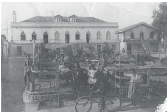
Figura 2. Fotografía de la casa de campo de Pêro Viegas, principios de siglo XX.

Los nietos de Mário Saa se quedaron con la dehesa más emblemática de la familia: Pêro Viegas (Fig. 2). 18 La dehesa