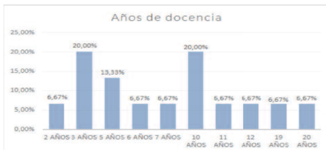
Gráfico 2: Frecuencia de la variable años de docencia

En cuanto a la a los años de docencia, se puede apreciar en el gráfico 2, que la parte de la muestra más destacada eran los que llevaban ejerciendo 3 años (20% de la muestra) y aquellos que llevaban 10 (20% de la muestra).