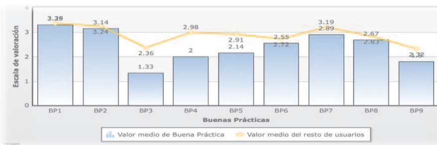
Figura 1. Resultados del protocolo de Buenas Prácticas en parentalidad positiva. FEMP.