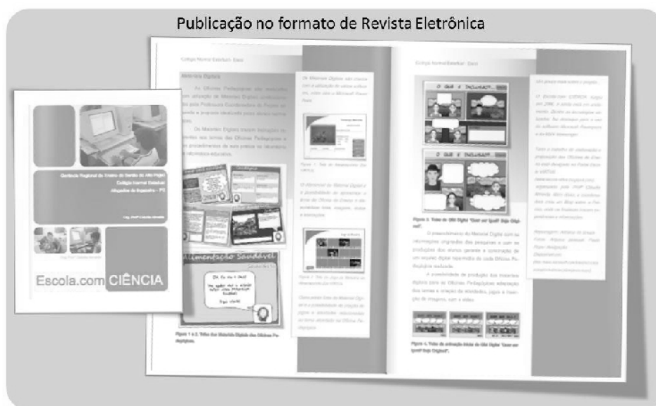
Figura 3. Exemplo de Publicação Eletrônica em PDF.

Pensando também em ferramentas de disponibilização de materiais e documentos para leitura, integramos recursos do Issuu 7 para a publicação de textos em PDF (Figura 5) no formato de publicações eletrônicas. O formato das publicações em PDF assemelha-se ao formato de revistas e livros convencionais, possibilitando que documentos completos sejam disponibilizados como E-books 8 .