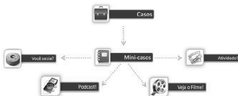
Figura 5. Estrutura da Atividade ZooVIRTUS e elementos midiáticos disponibilizados.

A inclusão de elementos de texto, gráficos, imagens, arquivos de áudio e vídeo correlatos ao conteúdo tratado permite agregar os aprendizes favorecendo a aprendizagem do grupo por contemplar os diferentes estilos cognitivos, permitindo aos mesmos ainda, a escolha do modo de visualização que mais lhes convier (Loiselle, 2002).