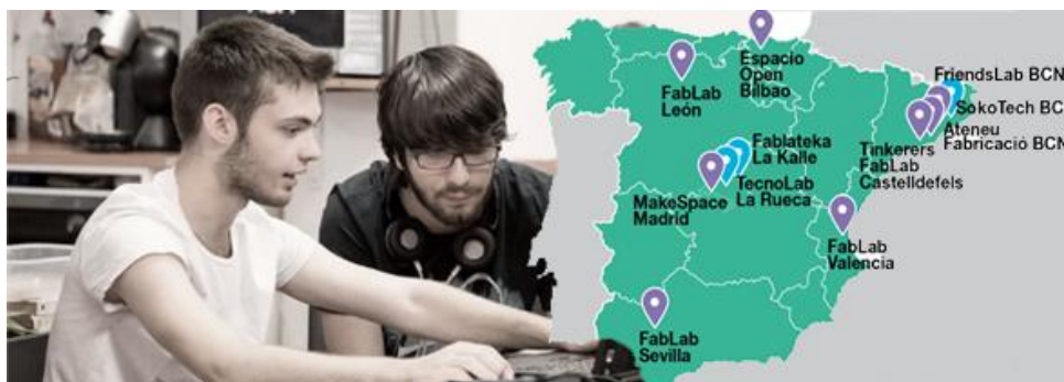
Figura 2. Mapa de los espacios colaboradores del programa «Breakers» (en morado) junto a un grupo de jóvenes participantes.

Así, este artículo recoge la validación de los instrumentos de recogida diseñados para uno de los programas formativos a analizar: «Breakers», fabricate un nuevo mundo 2 . Se trata de un programa que surgió a mediados de 2016 impulsado por la Fundación Orange, la Federación de Entidades con Proyectos y Pisos Asistidos (FEPA), la Red Española de Fablabs (CREFAB) y BJ Adaptaciones, que busca ofrecer nuevas oportunidades a jóvenes tutelados y ex tutelados mediante la introducción a la cultura maker y tecnologías de creación digital. Dicho programa formativo tiene una duración de 40 horas y se desarrolla durante tres ediciones anuales en ocho espacios de fabricación digital del estado de forma paralela.