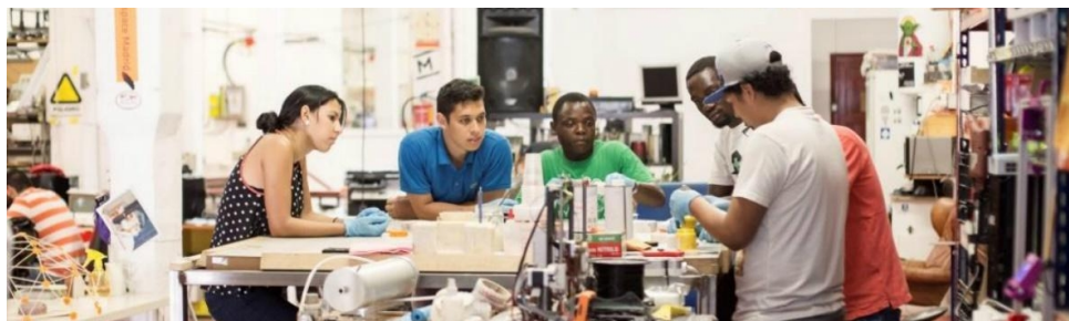
Figura 1. Grupo de jóvenes trabajando en el espacio de fabricación MakeSpace (Madrid).

El movimiento está constituido por «makers que realizan making». El maker, hace referencia a alguien que diseña y crea cosas mientras disfruta del proceso experimental, donde aprende ideando, experimentando y prototipando soluciones que responden a necesidades individuales o sociales (Bowler y Champagne, 2016; Martín; 2015). El making, en cambio, se define como una práctica del ser humano que según Tesconi y Arias (2013), parte del interés individual de querer crear un artefacto o sistema que sea significativo para uno mismo, pero que, a su vez, puede ser compartida con otras personas o colectivos. Este proceso creativo, se basa en la experimentación mediante la combinación y uso de técnicas manuales (costura, moldeado, carpintería) y digitales (diseño por ordenador, corte láser, impresión 3D, prototipado electrónico y robótica, corte CNC), fomentando, tal y como sostienen Douglerty (2012) o Sheridan et al. (2014), el conocimiento mediante la combinación de varias técnicas en un solo proyecto.