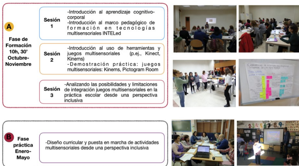
Figura 2 . Fases del programa de desarrollo profesional docente.

seleccionados en función de los objetivos curriculares que querían trabajar y las características del grupo, creando un plan de lecciones que implementaron dentro de cada aula de trabajo. Asimismo, realizaron un análisis sobre las posibilidades y limitaciones educativas de los juegos Kinems. Los maestros/as especialistas en pedagogía terapéutica y audición y lenguaje, empezaron seleccionando a los estudiantes que podrían beneficiarse más de las aplicaciones digitales incorporadas (entre todas las que estaban tratando), buscaron juegos que pudieran ajustarse a sus objetivos de aprendizaje y que pudieran adaptarse a las necesidades de cada niño/a, y los aplicaron a sus sesiones individuales.