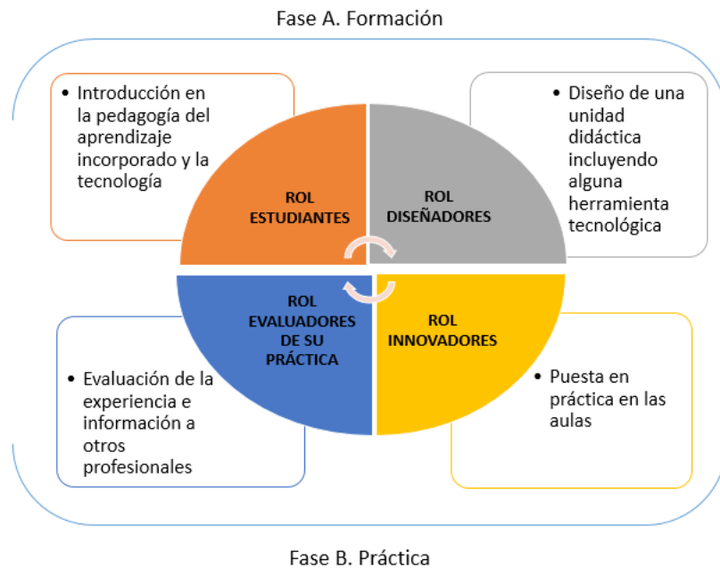
Figura 1. Diagrama de representación de las fases del programa.

desarrollaron su papel de "Estudiantes" (Figura 2). La primera sesión se centró en la presentación y reflexión del marco pedagógico del proyecto sobre las estrategias de enseñanza-aprendizaje cognitivo-corporales, y en la integración de las tecnologías multisensoriales en el aula desde una perspectiva inclusiva.