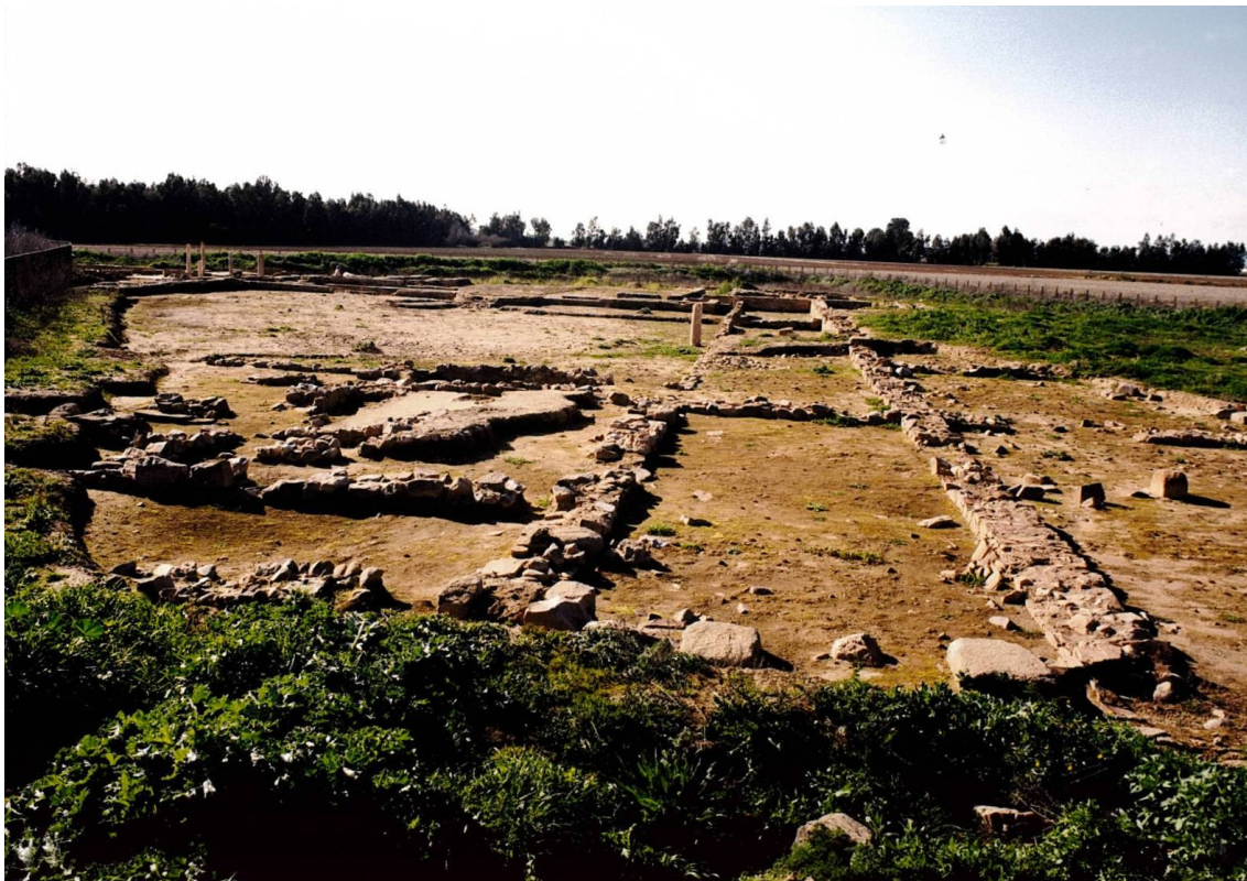
Fig. 3: Vista Este de la villa tras las excavaciones arqueológicas realizadas.