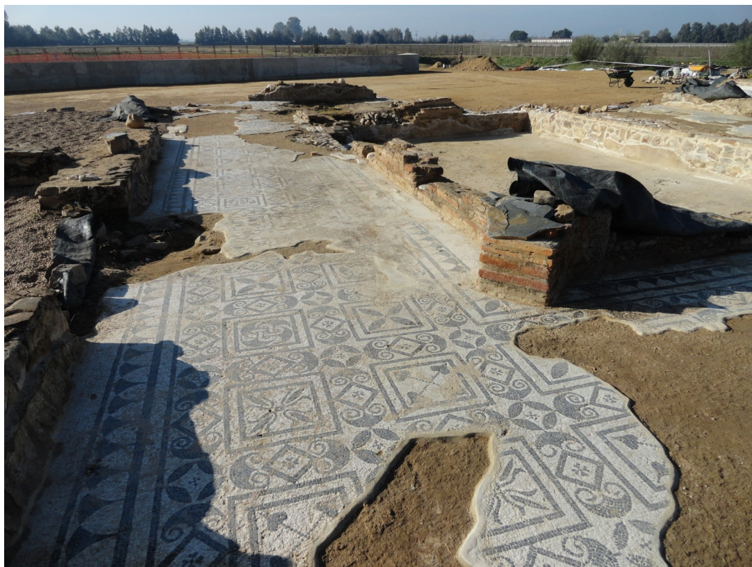
Figuras 13 y 14: Vista de la restauración del mosaico bicromo de los pasillos del atrio y un detalle de un motivo figurado de una de las estancias.