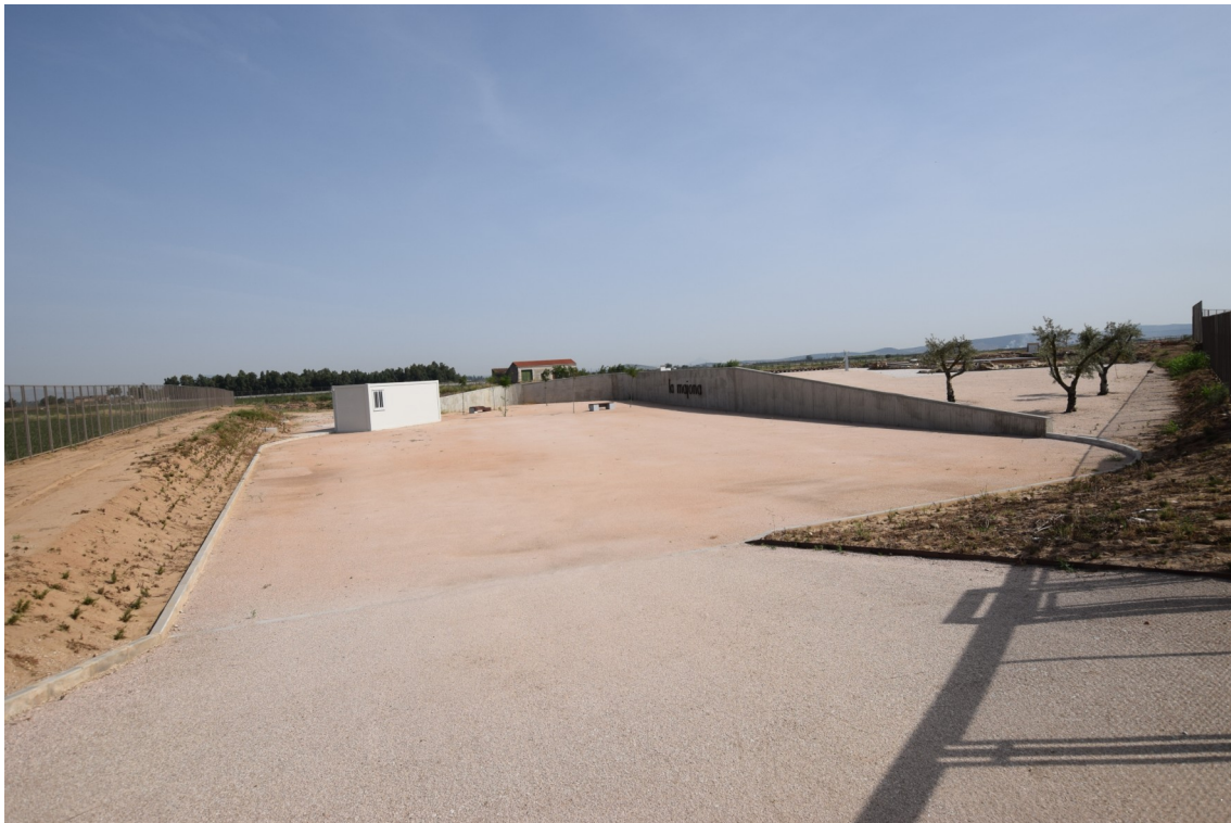
Fig. 17: Vista del acondicionamiento realizado en la zona destruida.