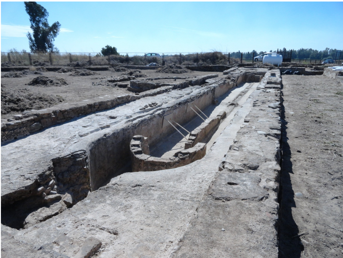
Fig. 15: Vista de los trabajos de restauración de las estructuras de la fuente monumental.