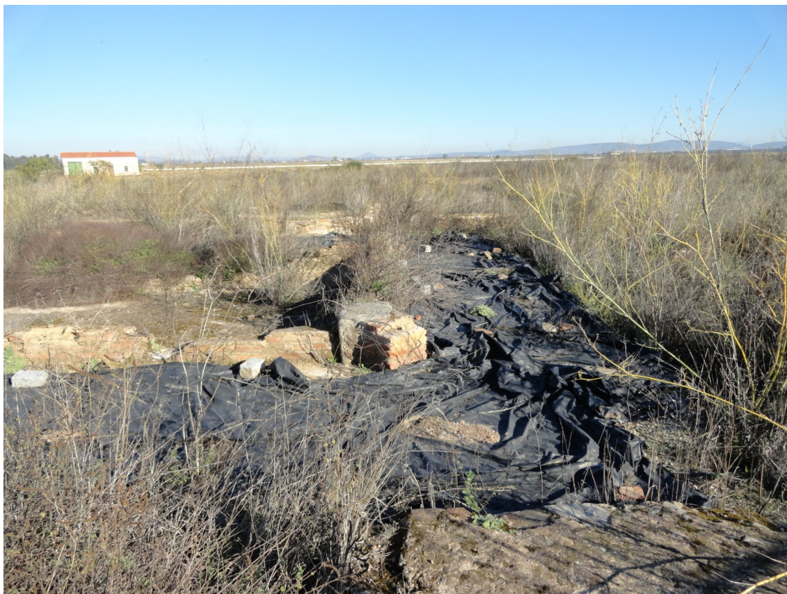
Fig. 4: Vista del estado de abandono que presentaba La Majona antes de realizar los trabajos de puesta en valor desarrollados en el año 2013.