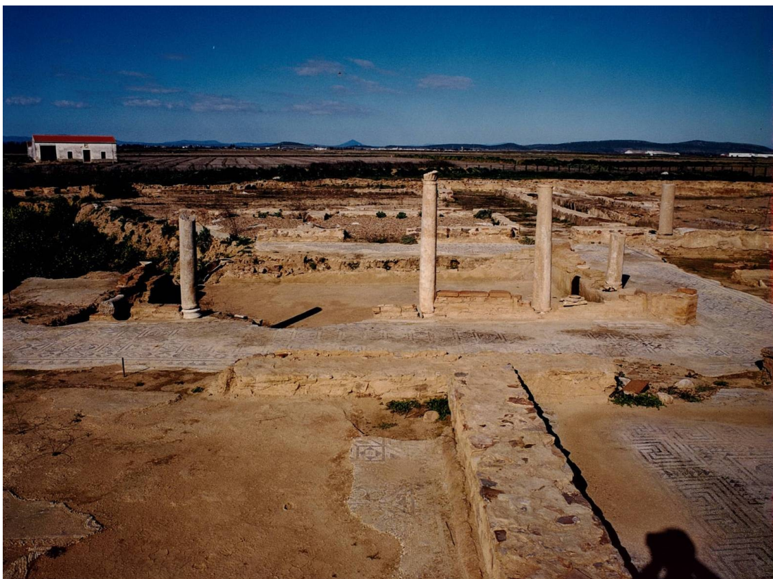
Fig. 2: Vista Sur de la villa tras las excavaciones realizadas a finales del siglo XX.