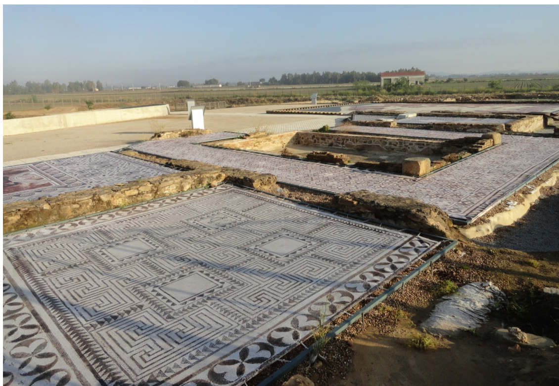
Fig. 16: Vista general de las lonas instaladas que reproducen los mosaicos.