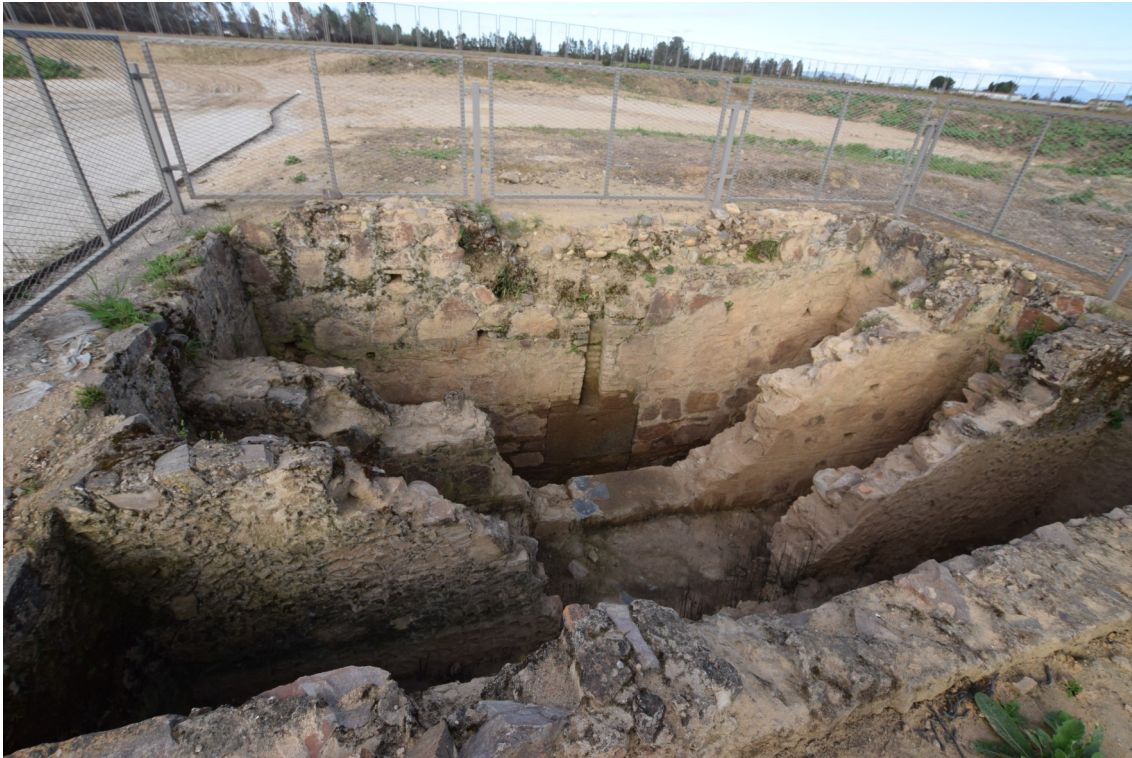
Fig. 9: Vista de la estructura relacionada con un posible pozo con noria.