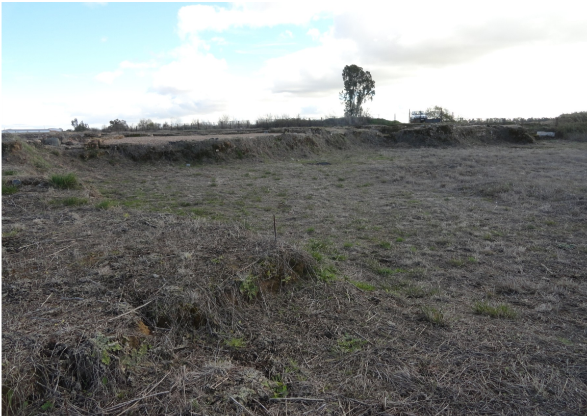
Fig. 1: Vista de la zona occidental del yacimiento que fue destruida por las máquinas en el año 1995.