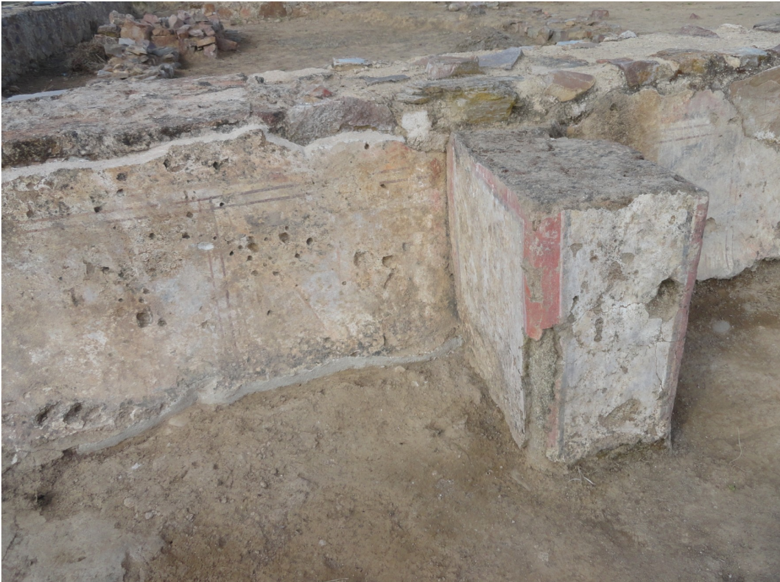
Fig. 10: Vista de las pinturas restauradas en el pasillo oeste del peristilo