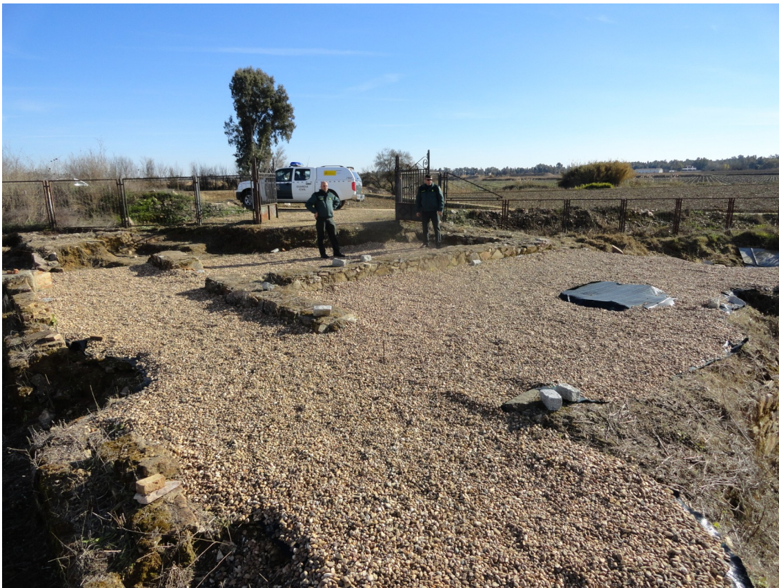
Fig. 5: Fotografía tomada durante una de las visitas de inspección de los agentes del Seprona del puesto de la Guardia Civil de Don Benito.