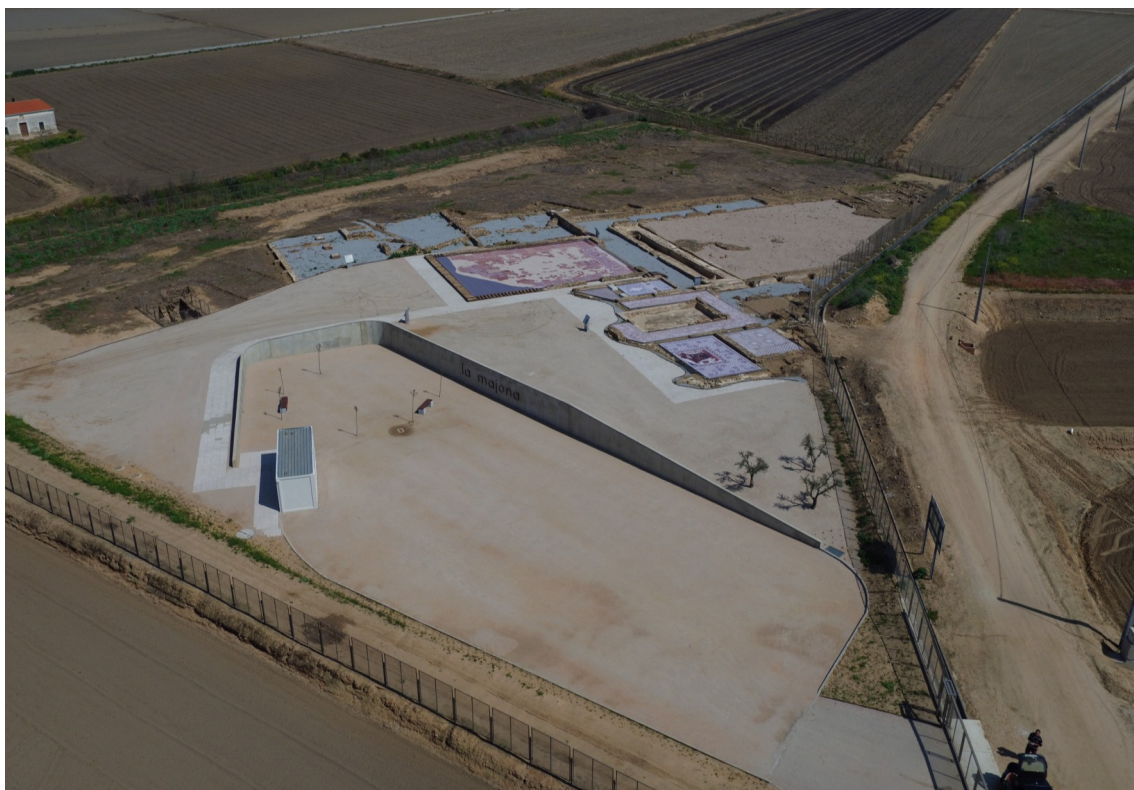
Fig. 20: Vista del estado que presentaba La Majona tras los trabajos de puesta en valor desarrollados en 2015 y 2016.