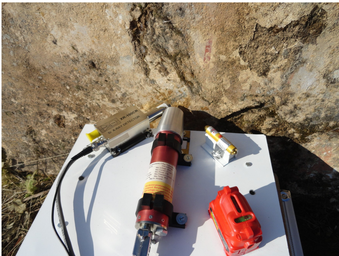
Fig. 6: Fotografía del proceso de análisis de esas pinturas romanas.