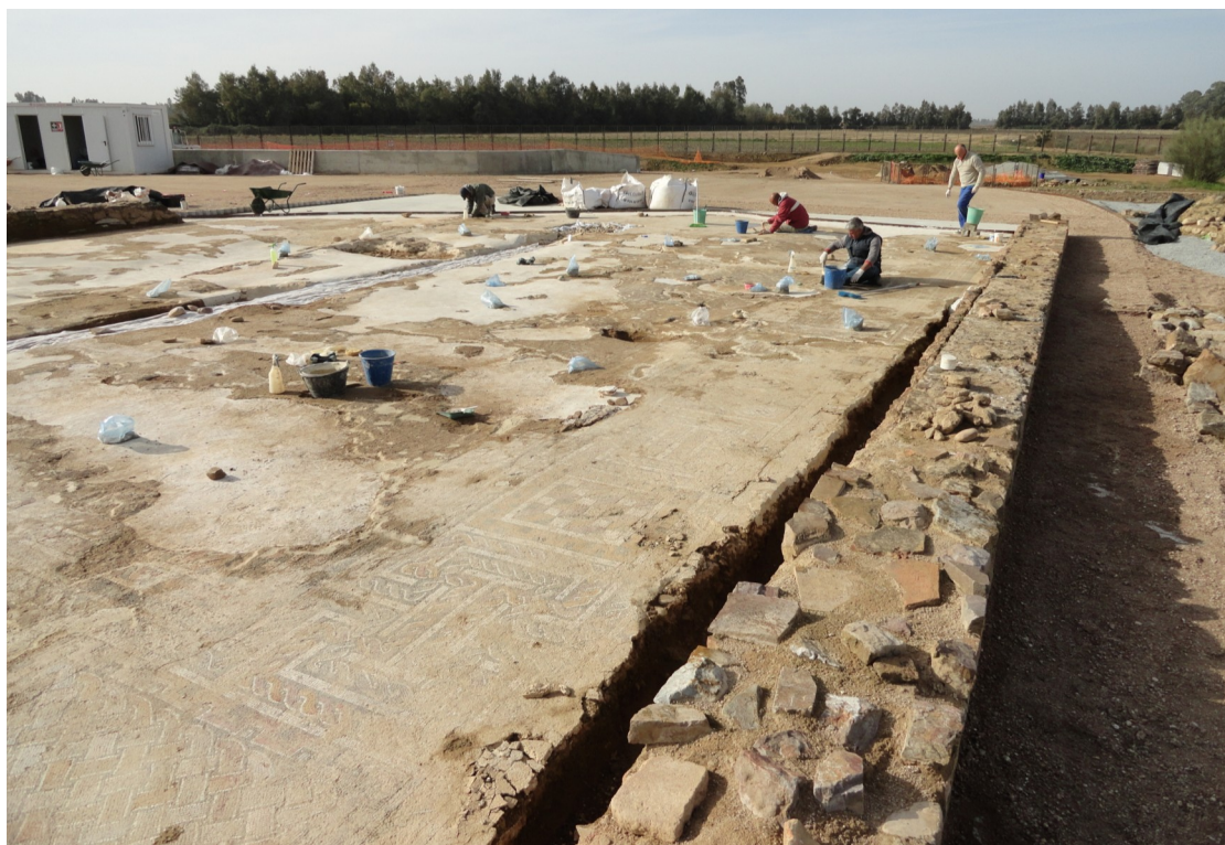
Figuras 11 y 12: Vista general y de detalle de los trabajos de restauración del mosaico policromo de la gran sala