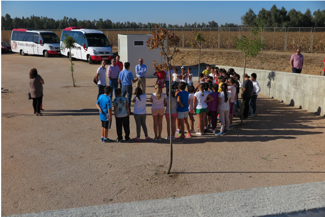
Fig. 18: Vista de visitantes y escolares del Colegio Público Donoso Cortés que asistieron al acto de apertura de la villa romana de La Majona.