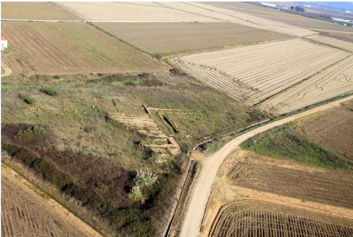
Fig. 7: Vista aérea de La Majona antes de iniciarse las obras del año 2015.