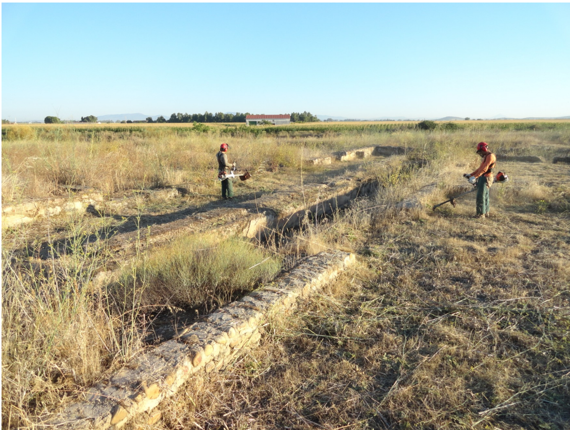
Fig. 8: Vista del desarrollo de los trabajos de desbroce realizados en 2015.