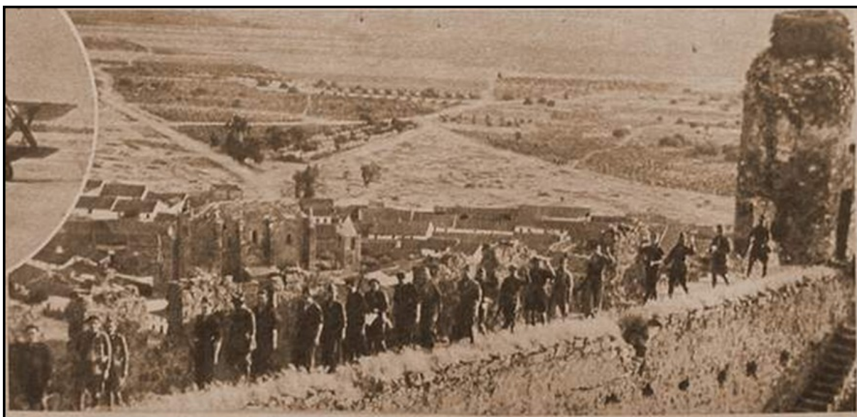
Imagen 4. Milicianos en el Castillo de Medellín.

El segundo de los hechos que también tendrían como escenario los muros del castillo sería la Guerra Civil Española. El rápido avance desde el sur de la columna de Yagüe en pos de llegar a Madrid hizo, que una vez conquistadas Badajoz y Mérida en agosto de 1936, el avance hacia el norte continuara dejando atrás una zona de frente que tendría a Medellín como punta de lanza, fue la denominada "Bolsa de la Serena". Debido a su alto valor estratégico el castillo fue ocupado por tropas republicanas, siendo visibles todavía los nidos de ametralladoras que se hicieron en alguna de las torres del recinto. Las tropas de Franco romperían la bolsa y tomarían Medellín el 25 de julio de 1938, en un momento en que ya el discurrir de los hechos bélicos les era ya, claramente favorable.