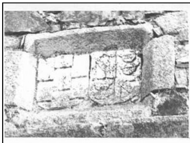
Imagen 3. Escudo de los Portocarrero/Villena.

La historia del cautiverio del hijo a manos de su madre dio lugar a la leyenda del conde de Medellín que inspiraría la famosa obra de Calderón de la Barca "La Vida es Sueño".