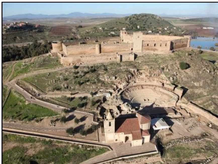
Imagen 2. Castillo y Teatro Romano de Medellín.

Cuando en el año 79 a.c. el Cónsul Quinto Cecilio Metelo fundaba la colonia de Metellinum como asentamiento de carácter militar en el contexto de las guerras sertorianas, aparece una primera fortaleza en la cumbre del cerro, a cuyo pie se construiría, aprovechando la pendiente del terreno, el magnífico teatro recientemente excavado. La importancia de la colonia decaería ante el mayor brillo de la vecina Augusta Emérita (Mérida), fundada en el 25 a.c.