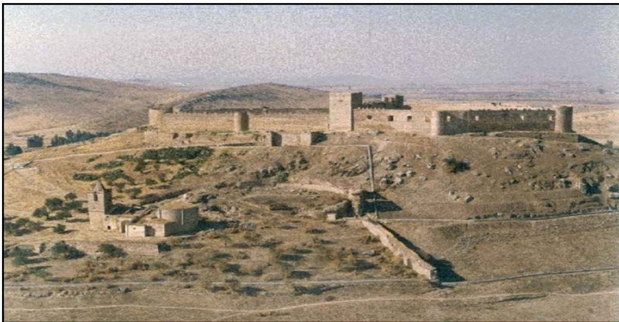
Imagen 1. Panorámica del Castillo de Medellín.

Con las líneas que ahora siguen iniciamos, dentro de la sección, De turismo por, perteneciente a la Revista de Historia de las Vegas Altas, una serie dedicada a los castillos de nuestro entorno más próximo. A través de ella pretendemos un mejor conocimiento de estos antiguos y silenciosos testigos, cuando no protagonistas, de nuestra historia, y que, consecuencia de los diversos avatares bélicos del pasado, jalonan algunas de las localidades de La Serena, Vegas Altas y la Siberia extremeña.