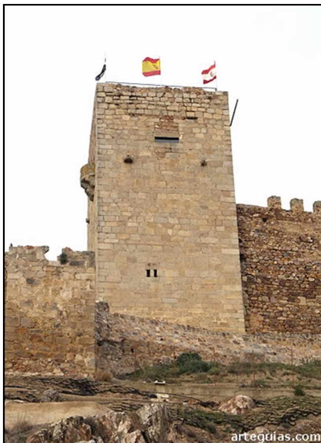
Imagen 6. Torre del Homenaje del Castillo de Medellín.

De la etapa musulmana del castillo lo mejor conservado es el aljibe hispano-musulmán, de época Almohade debió construirse a mediados del s.XII constituido con dos naves con una columna al medio, de donde arrancan dos arcos tumidos que sirven de apoyo de las dos bóvedas de cañón correspondientes a las dos naves. En el patio occidental se encuentra una alberca árabe, de forma rectangular irregular, ahondada en el suelo, que estaba destinada al uso y servicio del castillo.