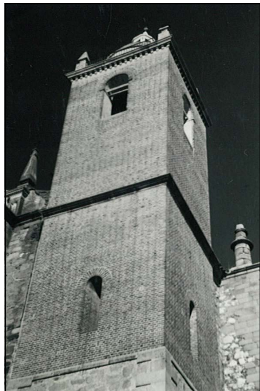
La torre de la Iglesia de Santiago a principios del siglo XX.