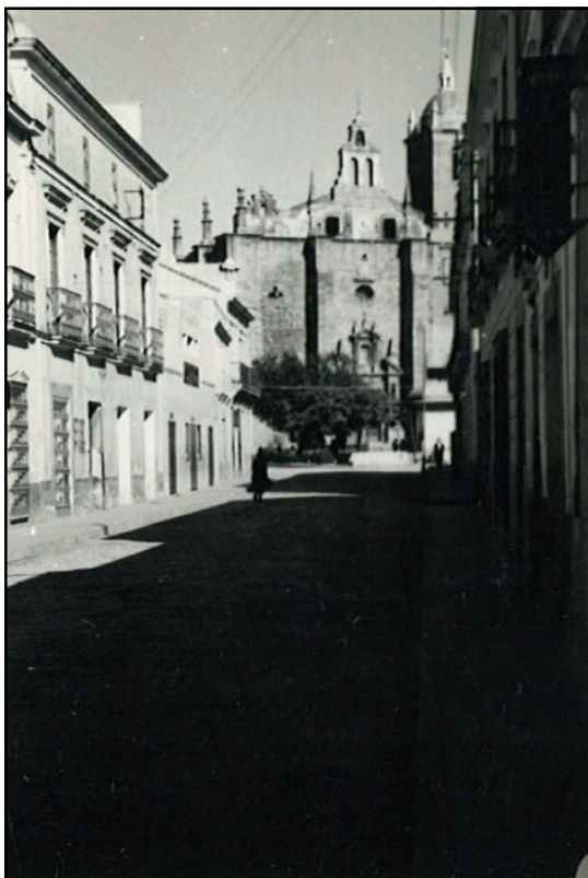
La calle Arroyazo a principios del siglo XX.