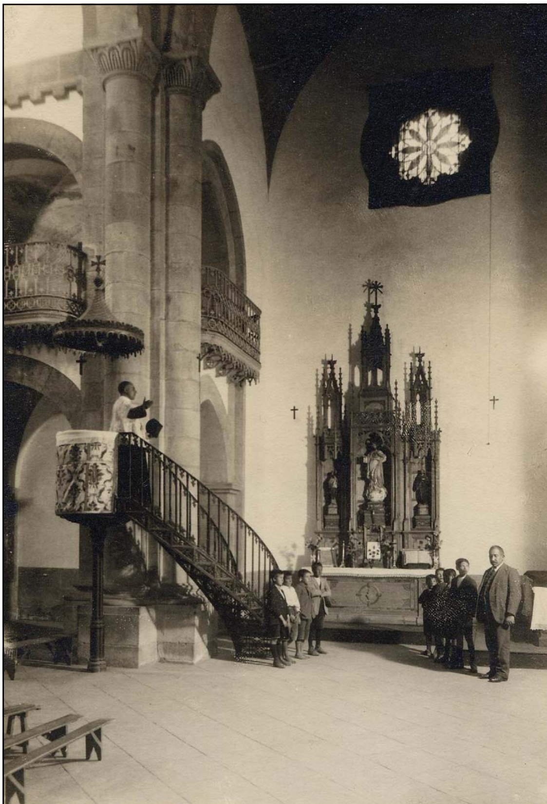
Detalle del interior de la Iglesia de San Juan de Don Benito donde aparece su Capellán exhortando al público y a los alumnos de las Escuelas del Ave María. Imagen de principios del siglo XX.