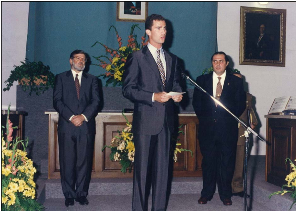
Visita del Rey Felipe VI de España, entonces Príncipe de Asturias, a Don Benito. Año 1996.