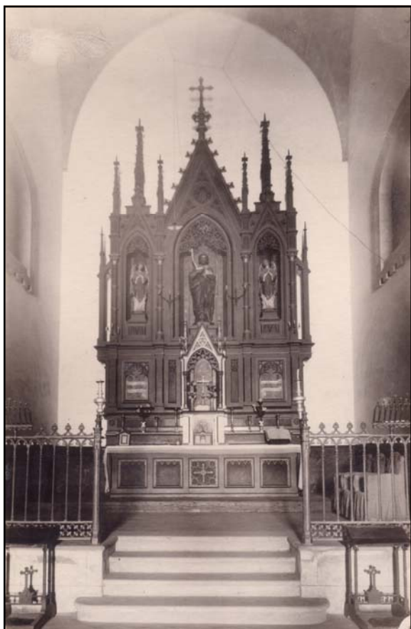
Presbiterio de la Iglesia de San Juan de Don Benito, que fue construido a expensas de D a Consuelo de Torre-Isunza y Alguacil-Carrasco. Imagen de principios del siglo XX.