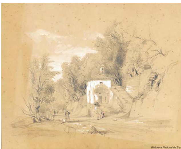
Figura 4. Eugenio Lucas Velázquez, Paisaje con ermita situada entre árboles con pequeñas figuras . 1842. Dibujo sobre papel grueso castaño con lápiz grafito, pincel y toques de gouache blanco. Madrid, Biblioteca Nacional, DIB/18/1/422.