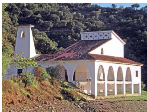
Figura 6. Talaván, ermita actual de la Virgen del Río. 1971.

Dibujo sobre papel agarbanzado con lápiz de grafito y realces de clarión. Madrid, Biblioteca Nacional, DIB/14/1/14.