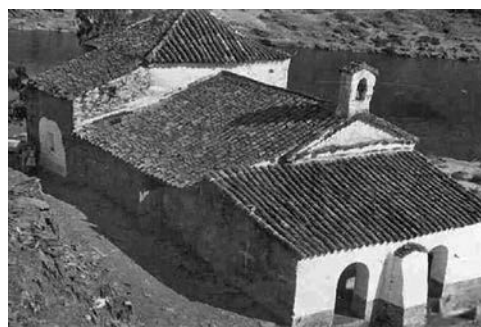
Figura 7. Talaván, antigua ermita de la Virgen del Río, sumergida por las aguas en 1969 a raíz de la construcción de la presa de Alcántara.