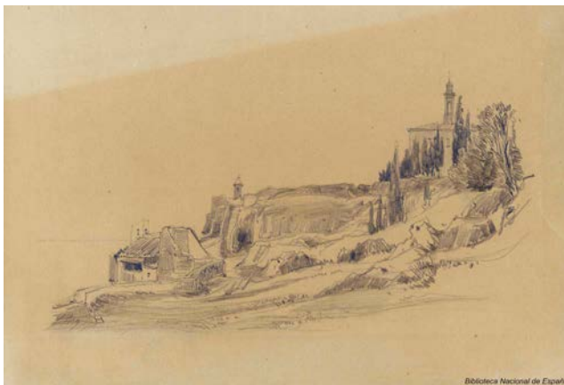
Figura 3. Eugenio Lucas Velázquez, Paisaje con ermita y otras construcciones . 1842. Dibujo sobre papel grueso castaño con lápiz grafito. Madrid, Biblioteca Nacional, DIB/18/1/421.

Nuestro objetivo con el presente trabajo se cifra en estudiar la serie de ermitas que antaño se alzaron entre las cuencas del Tajo y del Guadiana a su paso por Extremadura, tomando como referencia para ello los pueblos más cercanos a los cauces de ambos ríos y los santuarios que se elevaron en función de la devoción que profesaban sus gestes. Para ello, hemos acudido al Interrogatorio de la Real Audiencia (1791), a la obra (1798) de Tomás López y al Diccionario (1846-1850) de Pascual Madoz 12 .