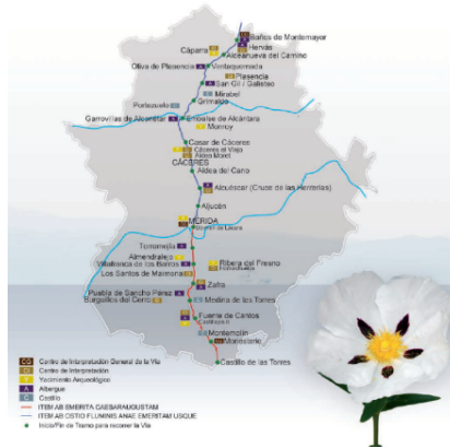
Figura 1. Mapa de la Vía de la Plata con infraestructuras

Elementos del patrimonio histórico, artístico, arqueológico, industrial y natural se conjugan en prácticamente todas las poblaciones que atraviesa dicho corredor cultural, permitiendo utilizar, desde un punto de vista didáctico, las rocas con las que están construidos diversos monumentos, los museos y centros de interpretación, los paisajes o el relieve, o el uso industrial de minerales y rocas, entre otros, para incorporar al proceso de enseñanza de las Geociencias prácticamente todo el elenco de conceptos básicos en el currículo de dicha materia en la Enseñanza Secundaria (tabla 1).