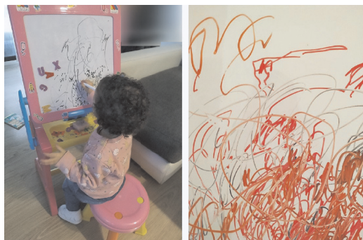
Figura 1. Taller Trazos.

La muestra, debido a la situación de aislamiento social y confinamiento, está formada por una menor de 16 meses y dos familiares, un papá y una mamá educadora artística e investigadora en el ámbito del arte, diseño y salud.