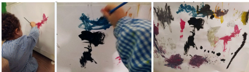
Figura 2. Taller Memorias.

Por lo tanto, los resultados alcanzados, una vez diseñadas e implementadas la serie de actividades a modo de taller programadas (Véase, Tabla 1), nos permiten indicar como postula Siegel y Bryson (2018, p: 26,28) cómo los momentos de la vida cotidiana pueden influir en la manera en la que el cerebro del menor avanza hacia la integración. La integración entendida como un proceso de configuración y reconfiguración para permitir crear conexiones entre las distintas partes del cerebro y, en este punto, el arte como experiencia (Dewey, 2008) ha permitido conectar distintas partes del cerebro. En este caso mediante las actividades expuestas, sostenemos los cimientos de la integración y la salud mental de nuestra menor, entendiendo salud como nuestra capacidad de permanecer en un río de bienestar (Sigel y Bryson, 2018, p.29)