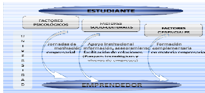
Figura 1 Proceso del aprendizaje emprendedor en las Universidades según los factores influyentes de Veciana

Los factores psicológicos hacen referencia al perfil de personalidad que debe poseer un estudiante para llegar a ser emprendedor, incluyéndose aquí la necesidad de logro o la búsqueda de independencia. Lo mejor que se puede hacer desde las universidades para favorecerlos son las jornadas sobre motivación empresarial. Dentro del enfoque sociocultural, o los factores socioculturales, se estudia la incidencia de factores sociales, políticos, económicos, familiares y, en especial, la influencia del apoyo institucional en la decisión del emprendedor de crear su propia empresa. Aquí la universidad tiene un papel institucional de apoyo en materia de información, asesoramiento y facilitación de relaciones para que los estudiantes desarrollen su idea. Esto suele hacerse desde los viveros de empresas o parques tecnológicos asociados a la Universidad. El enfoque gerencial enfatizaría en los conocimientos y habilidades adquiridas en el ámbito de la economía y la dirección de Empresas. Para mejorar este factor las Universidades deben incluir en sus planes de estudio, además de las materias típicas de cada titulación, otras formas de formación complementaria en materia empresarial, favoreciendo las habilidades de trabajo en equipo, pensamiento crítico o autoconocimiento continuado.