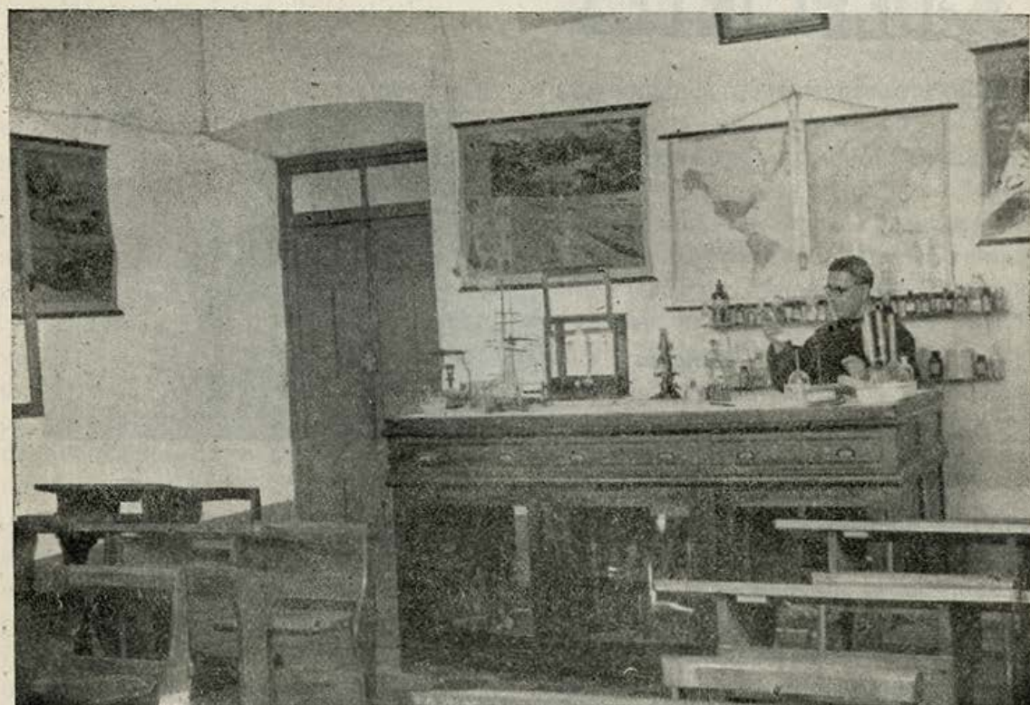
Clase de Química.