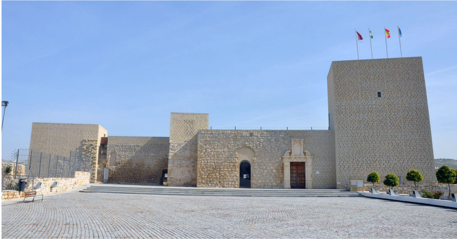
Fig. 9. Castillo de Baena (Córdoba, fot. María Gracia Gómez de Terreros, 2020), en el que ha intervenido el arquitecto José Manuel López Osorio entre 2008 y 2014.

En cuanto al tema central del estudio, sin que quepa en este reducido texto adelantar todas las conclusiones a las que hemos llegado y que quedan vertidas en el anunciado libro, sí podemos anticipar algunas.