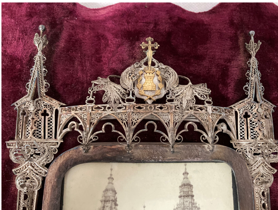
Fig. 5: Miguel Bruzos: Placa conmemorativa. 1910. Museo Quiñones de León.

laurel y roble con botones de oro que nuestros compañeros colocarán sobre la tumba del ilustre general inglés Lord Wellington que tanto se distinguió luchando por la independencia de nuestra patria contra las huestes napoleónicas 52 .