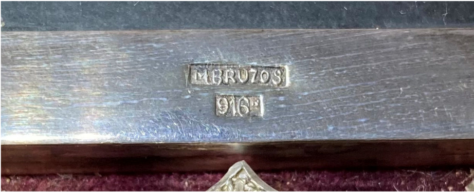
Fig. 4: Miguel Bruzos: Placa conmemorativa. 1910. Museo Quiñones de León.

donde se combina la torre viguesa y la cruz de Santiago compostelana [fig. 5]. El trabajo de los detalles arquitectónicos es de una filigrana de un preciosismo que rara vez hemos observado en piezas compostelanas de este tamaño. Forman dos columnillas laterales caladas, escudos lobulados y conopiales, hojas sobrepuestas con finos tallos, ventanitas cruciformes, ménsulas, etc. La riqueza se acentúa con la aplicación de pequeñas perlas.