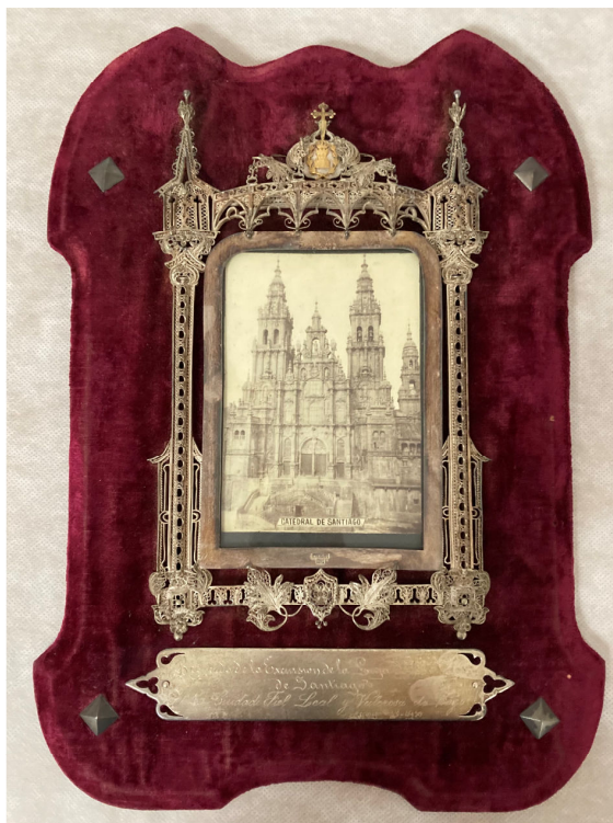
Fig. 3: Miguel Bruzos: Placa conmemorativa. 1910. Museo Quiñones de León.

formaba parte de dicha excusión [...] 50 .