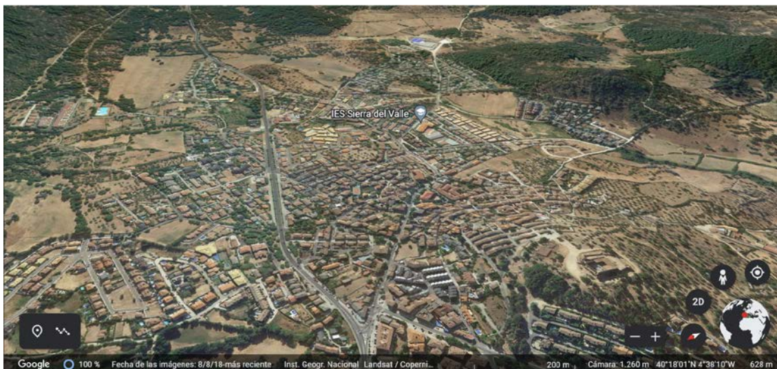
Imagen 1. Localidad de la Adrada: Fuente: Google Earth .

La idea es que, a partir de la introducción en el manejo de este SIG, sean capaces de ir analizando los elementos del plano urbano, el entorno y su historia. El caso de la localidad de La Adrada, en Ávila, que cuenta con un castillo bien conservado, es ideal para tal efecto, tal y como muestra la imagen 1; si bien es cierto que, habiendo conexión a Internet y ordenadores, la práctica se podría realizar sobre el plano de cualquier ciudad del mundo (los casos de las localidades de Salamanca y Ávila, por seguir con las experiencias, son igualmente sencillos, tal y como se ilustra en la imagen 2 para el primer caso).