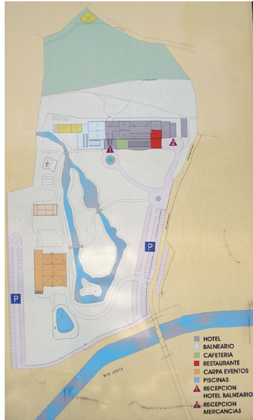
Figura 14. Valdastillas, Balneario Valle del Jerte. Distribución de las instalaciones termales, hoteleras y de recreo.

Aunque los cálculos iniciales hablaban de un coste inferior a los 3 millones de euros, en la Resolución de 2005 otorgando la concesión de aprovechamiento del agua minero-medicinal, se indica que el proyecto global balneoterápico más la instalación hotelera, tiene un presupuesto total de 4.861.198 euros 32 .