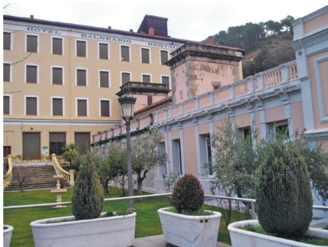
Figura 5. Baños de Montemayor. Balneario Viejo y Hotel.

aunque ya no existía la Junta de Vecinos, extinguida en 1951. A principios de los años 90, y en función de que el último día del año 1994 vencería el contrato de arrendamiento, se reactivó la Junta de Vecinos, que planteó la construcción de un nuevo Balneario y la conversión del antiguo en Museo. Junta de Extremadura, Ayuntamiento y Gobierno Civil apoyaron la idea 17 .