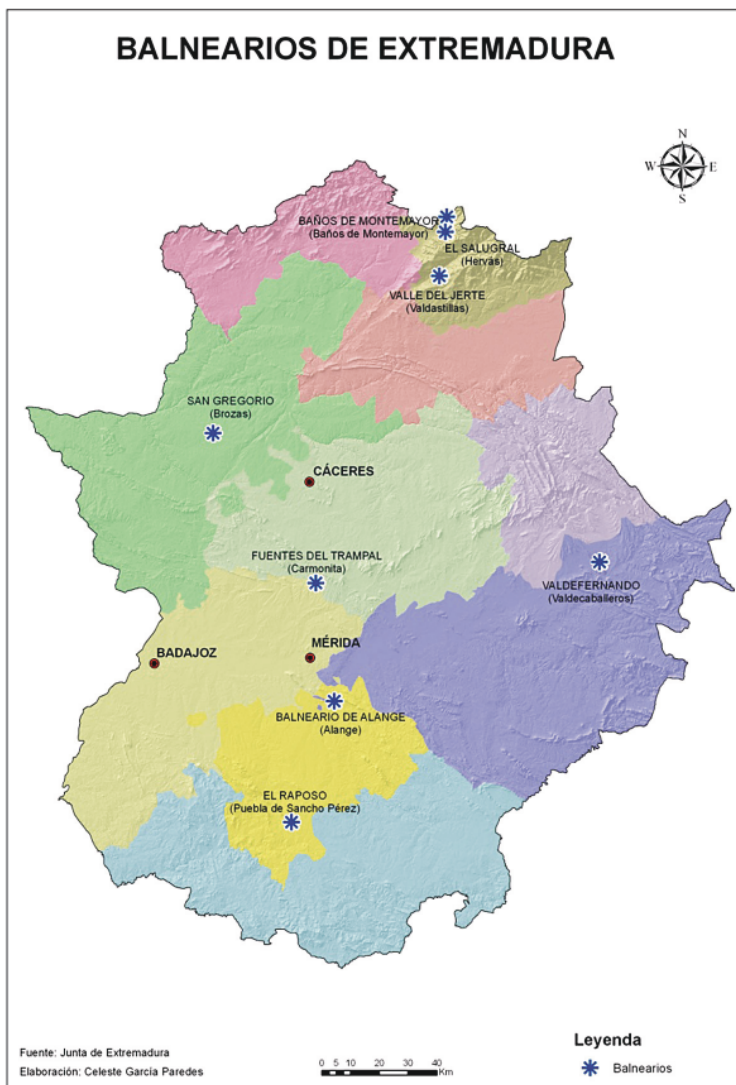
Figura 2. Mapa de Balnearios de Extremadura (Celeste García Paredes) para SÁNCHEZ LOMBA, F., ROBADO QUIRÓS, A., Cultura y Turismo , Col. «Extremadura. Más de 20 años de progreso con Europa», Vol. 3, Junta de Extremadura, Mérida, 2010. Inédita.

Otras muchas zonas de baño están prácticamente abandonadas: La Guarrita (Zorita), Charca de El Tío Ferrino (Santibáñez el Alto), El Lavadero (Arroyo de la Luz), La Polvorosa (Santibáñez el Alto), Fuente del Padre Mateo (Valencia de Alcántara) o La Geregosa (Santiago de Alcántara), que actualmente se intenta recuperar.