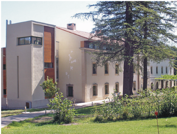
Figura 11. Hervás, Balneario El Salugral. Vista general de las instalaciones hoteleras.

Al margen de la importancia de la obra nueva, en particular la relativa al Balneario, es de destacar la tarea de rehabilitación y remodelación de buena parte de los edificios preexistentes. En el antiguo Hotel se actúa sobre el salón social, eliminando las pequeñas ventanas y convirtiéndolo en pabellón acristalado, al tiempo que se amplía el comedor y se redistribuyen las dependencias de administración, recepción, aseos y cocina. Las dos plantas superiores se modifican, quedando la primera con quince habitaciones y la segunda con dieciséis.