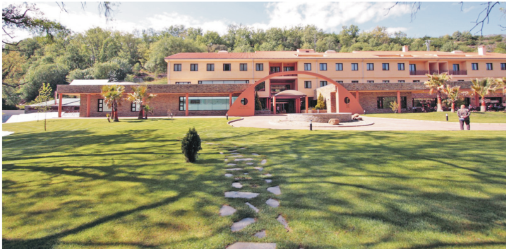
Figura 13. Valdastillas, Balneario Valle del Jerte. Vista General.

Las aguas de los Baños de la Guarrapa se caracterizan por ser sulfuradas, fluoradas, cloruradas y bicarbonatadas sódicas. Indicadas para tratamientos del aparato locomotor, afecciones dermatológicas y enfermedades del aparato respiratorio. Fueron declaradas minero medicinales por Resolución de la Consejería de Economía y Trabajo de la Junta de Extremadura el 5 de noviembre del año 2003 31 .