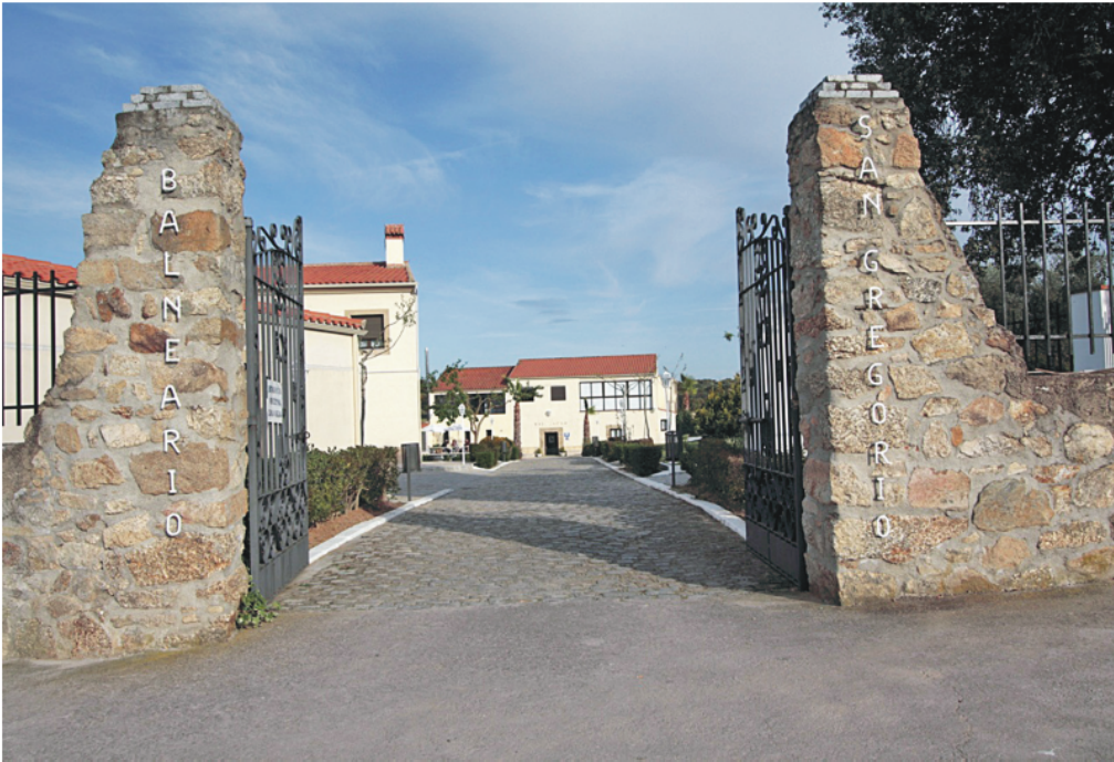
Figura 8. Brozas, Balneario de San Gregorio. Entrada a las nuevas instalaciones.

Desde el año 2002 el establecimiento ha sufrido una transformación total hasta su inauguración en abril del 2005. Además de la construcción de modernos alojamientos con habitaciones, restaurante y cafetería, el balneario se ha ampliado y equipado con las más modernas técnicas, se han acondicionado terrazas dedicadas a solárium y zonas de descanso para bañistas, y se han recuperado los jardines del entorno, de modo que los visitantes pueden disfrutar de un paisaje típicamente extremeño, con grandes extensiones de encinares y alcornoques habitadas por cigüeñas, aves rapaces, etc.