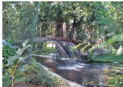
Figura 15. Valdastillas, Balneario Valle del Jerte. Zona de paseo, con arboleda y agua.