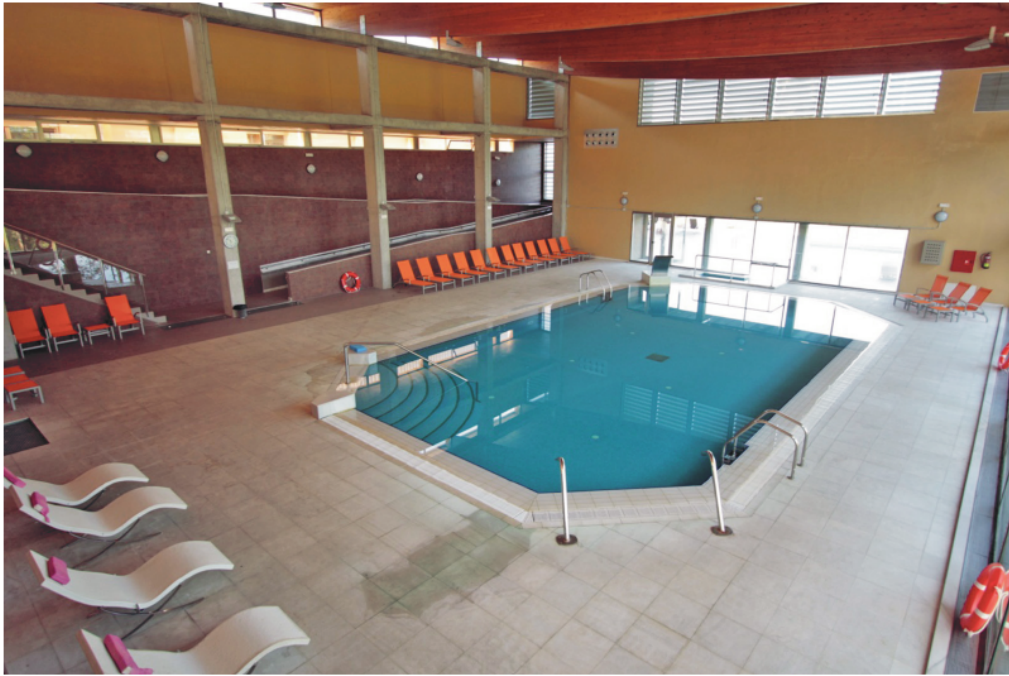
Figura 10. Hervás, Balneario El Salugral. Piscina termal.

Al margen de la importancia de la obra nueva, en particular la relativa al Balneario, es de destacar la tarea de rehabilitación y remodelación de buena parte de los edificios preexistentes. En el antiguo Hotel se actúa sobre el salón social, eliminando las pequeñas ventanas y convirtiéndolo en pabellón acristalado, al tiempo que se amplía el comedor y se redistribuyen las dependencias de administración, recepción, aseos y cocina. Las dos plantas superiores se modifican, quedando la primera con quince habitaciones y la segunda con dieciséis.