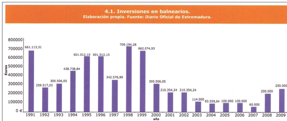
Figura 16. Cuadro económico de Inversiones en Balnearios. De SÁNCHEZ LOMBA, F, ROBADO QUIRÓS, A., Cultura y Turismo , Col. «Extremadura. Más de 20 años de progreso con Europa», Junta de Extremadura, Mérida, 2010, Vol. 3, p. 59.

El cuadro de inversiones, extraído del libro «Turismo y Cultura» ya citado, permite hacerse una idea de las grandísimas inversiones que se han tenido que afrontar, por parte de la administración y por parte de los particulares. Pero están dando sus frutos y lo que era una actividad casi marginal hace 20 años es ahora uno de los referentes turísticos más atractivos de la región.