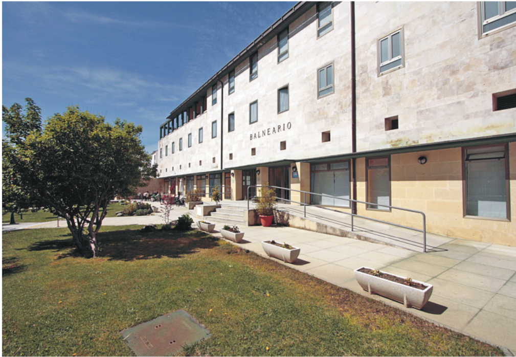
Figura 6. Baños de Montemayor. Balneario nuevo.

Extremadura 21 , el gerente del establecimiento, D. Antonio Sierra, hace balance del primer año de funcionamiento, con nuevos tratamientos, nuevos clientes, aumento considerable del personal, recordando que en los momentos actuales el cliente ya no viene a tomar los baños y que las aplicaciones complementarias: parafangos, parafina, presoterapia, sauna, masaje o piscina climatizada, atraen a un gran número de clientes ajenos a la cura tradicional, con lo que se consigue actividad y ocupación de once meses al año.