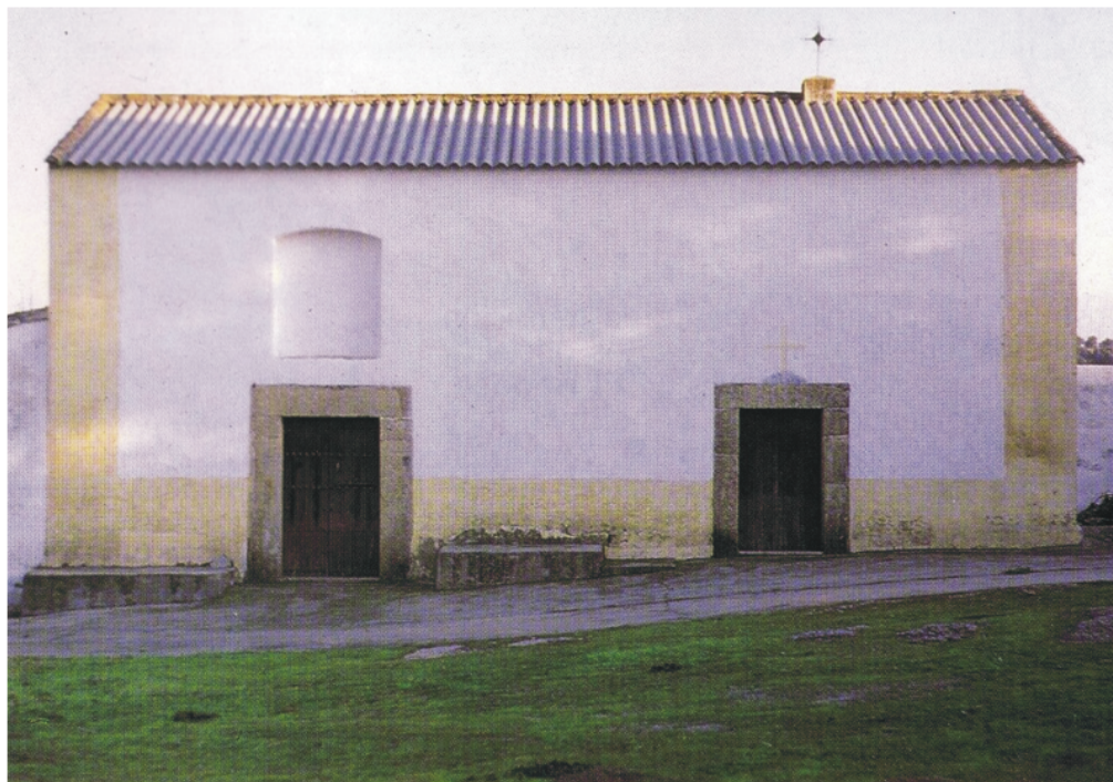
Figura 7. Brozas, Balneario de San Gregorio. Imagen hacia 1990.