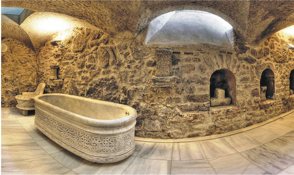
Figura 3. Baños de Montemayor. Cámara circular romana, musealizada en el Balneario Viejo.