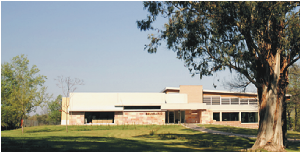
Figura 9. Hervás, Balneario El Salugral. Vista general de las instalaciones termaleas.

«En este territorial término se halla una fuente mineral al sitio que llaman el Salogral y este nombre tiene citada fuente de sulfuria, así lo han acreditado en varias experiencias que se han hecho, tanto en lo medicinal como en extractos químicos, y por más verdad es marcial aperitiva y reobstruente, que sea medicinal aún más se acredita porque, aun hallándose a orillas del río, se advierte que los ganados no aprecias esta agua y pasándola veven en zitada fuente» 27 .