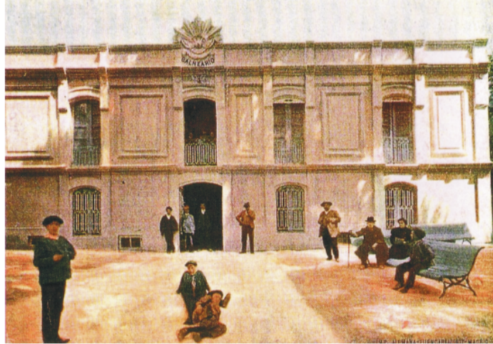
Figura 4. Baños de Montemayor. Postal antigua (hacia 1920).