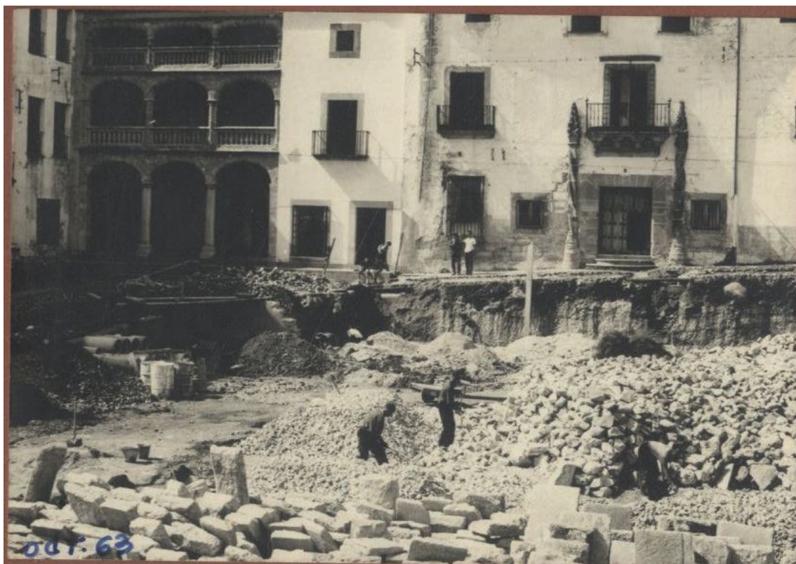
▪ Fig. 5. Aspecto del lado suroccidental durante las obras de demolición del mercado en 1963.

con afectación de una de las fachadas del palacio del Marqués de la Conquista.