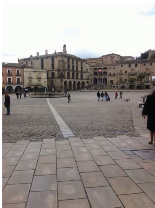
▪ Fig. 12. Vista general de la plaza desde San Martín en marzo de 2017.

La Dirección General de Bellas Artes contribuyó a la recreación de la imagen patrimonial de Trujillo subordinando los distintos proyectos de cada monumento en los que intervino al gran proyecto de ordena-