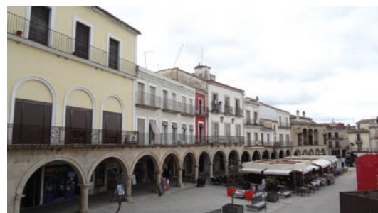
▪ Fig. 10. Soportales de la plaza en su lado noroccidental en la actualidad.

Los proyectos abordados en la Plaza Mayor de Trujillo desde la Dirección General de Arquitectura y prácticamente todos los que esta ejecuta en Extremadura desde su creación, respondieron en buena medida al deseo de generar un gran marco escenográfico para la promoción turística de las zonas declaradas –interés turístico que comienza a despegar con fuerza–; sin perder la conexión con las connotaciones ideológicas y simbólicas que subyacen detrás de cualquier proyecto de restauración, y que abundaron sobre todo durante el “primer franquismo”. Reconocer como conjuntos históricos-artísticos ciudades y pueblos con un pasado ilustre y con personajes históricos