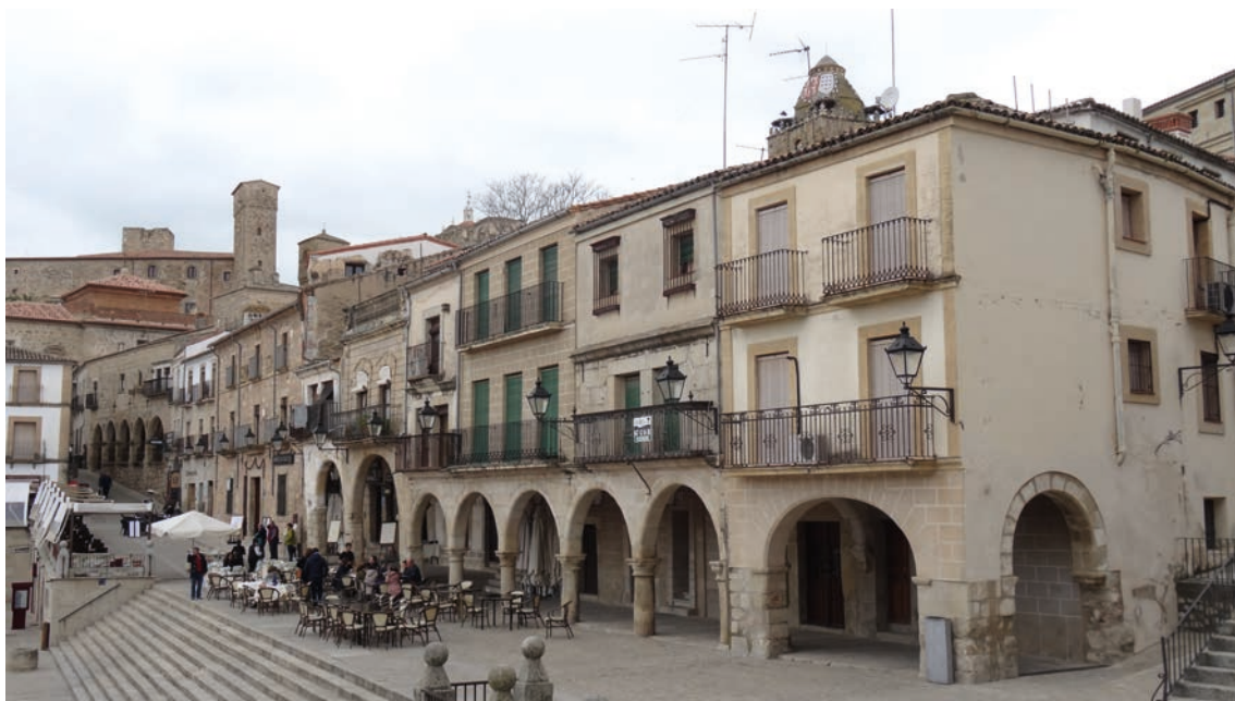
▪ Fig. 11. Soportales de la plaza en el frente norte que comunica con la Villa Adentro en la actualidad.

relevantes respondía a los mismos criterios por los cuales Franco decidió restaurar en el período de "autarquía" monumentos muy significativos de la historia de España para la redefinición de la identidad nacional y la legitimación de su régimen político.