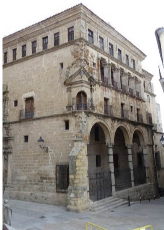
▪ Fig. 7. Palacio de San Carlos con la galería superior descubierta en la actualidad.

definitiva no desentonar con la imagen que se pensaba proyectar de la ciudad 52 .