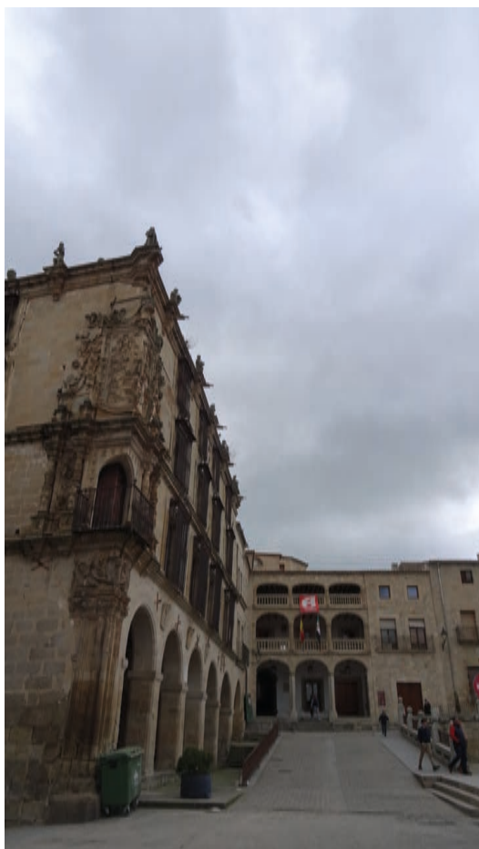
▪ Fig. 6. Rampa de acceso a las Casas Consistoriales Viejas en la actualidad.

ría con la mejora del acceso a esta zona desde el palacio del Marqués de la Conquista y que facilitaría la comunicación con otros inmuebles y espacios muy destacados artísticamente, como el palacio de Orellana y su entorno urbano, desconocidos e infravalorados por no estar situados en la plaza sino en sus proximidades (Fig. 6).