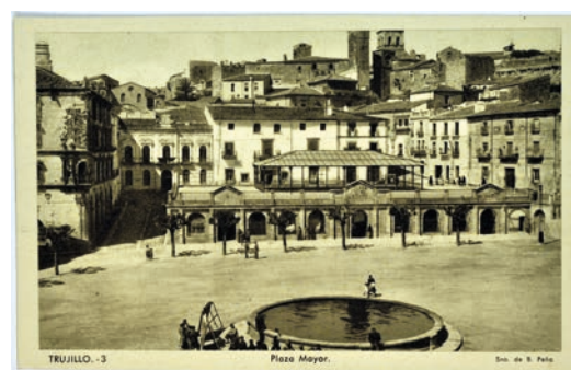
▪ Fig. 3. Aspecto del mercado antes de su demolición y del ángulo suroccidental de la plaza con la fachada que será demolida en 1957.

En el lado opuesto, el nororiental, dominado por la iglesia de San Martín y el palacio convento de San Carlos, los problemas que se presentaban eran otros, fundamentalmen-