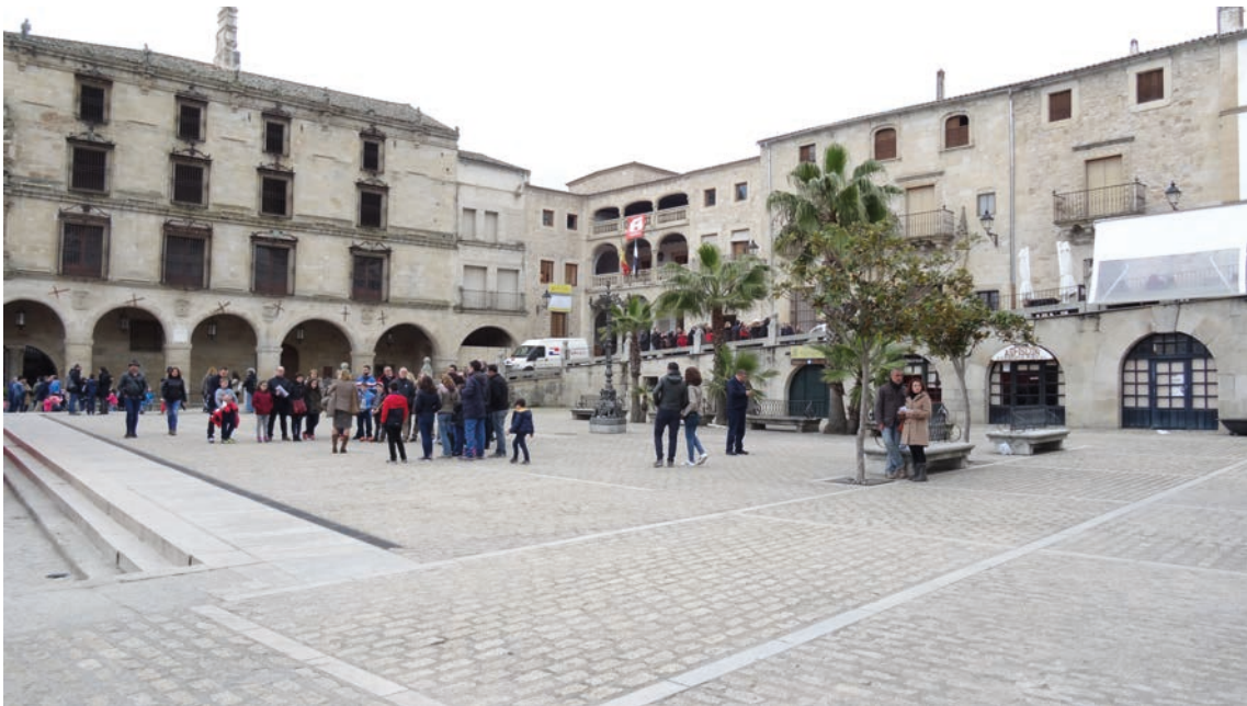
▪ Fig. 8. Nueva plaza generada tras la demolición del mercado y locales comerciales en el muro de contención, en la actualidad.

como un gran monumento o conjunto de estos, consideración esta última fruto de la evolución normativa referida, la cual va otorgando una importancia cada vez mayor a las arquitecturas y espacios circundantes en torno a los edificios singulares y que se observa en el caso de las obras acometidas en Trujillo a lo largo de la década de los sesenta, tanto por parte de la Dirección General de Bellas Artes como por la Dirección General de Arquitectura, la primera preocupada principalmente por los monumentos aislados y la segunda centrada en los conjuntos histórico-artísticos desde su Sección y posterior Servicio de Ordenación de Ciudades Histórico-Artísticas.