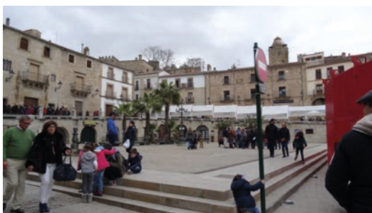
▪ Fig.9. Otro ángulo del nuevo espacio abierto creado tras la demolición del mercado en la actualidad.

como un gran monumento o conjunto de estos, consideración esta última fruto de la evolución normativa referida, la cual va otorgando una importancia cada vez mayor a las arquitecturas y espacios circundantes en torno a los edificios singulares y que se observa en el caso de las obras acometidas en Trujillo a lo largo de la década de los sesenta, tanto por parte de la Dirección General de Bellas Artes como por la Dirección General de Arquitectura, la primera preocupada principalmente por los monumentos aislados y la segunda centrada en los conjuntos histórico-artísticos desde su Sección y posterior Servicio de Ordenación de Ciudades Histórico-Artísticas.