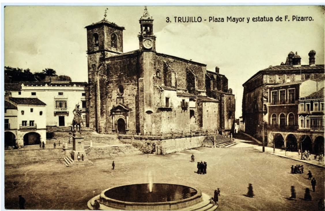
▪ Fig. 4. Ángulo nororiental de la plaza con la iglesia de San Martín en primer término y al fondo el palacio de San Carlos con la galería de ventanas aún cegadas anterior a 1960.

te en el pavimento, muy desnivelado y con acusadas pendientes de terreno que había que salvar en algunas zonas (Fig. 4). El estado de conservación de los pavimentos y los distintos elementos de fábrica también dejaba mucho que desear, especialmente en los soportales próximos a San Carlos.