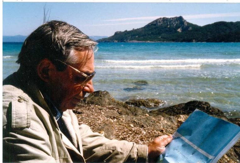
(7) À Porquerolles, en mai 1987