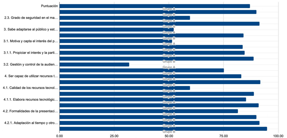
Figura 2. Gráfico con los ítems y puntuaciones.

relacionados con el uso de recursos tecnológicos. En la Figura 2 se recoge toda la información de estos ítems.