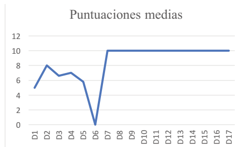
Figura 1. Variable logros

En la Figura 1 pueden verse las puntuaciones medias de los logros obtenidos y en la Figura 2 las puntuaciones medias de las variables apoyo, espontaneidad, implicación y satisfacción. En ambas figuras se observa como varían a lo largo de las sesiones de intervención. De manera que podemos decir que todas mejoran con la intervención.