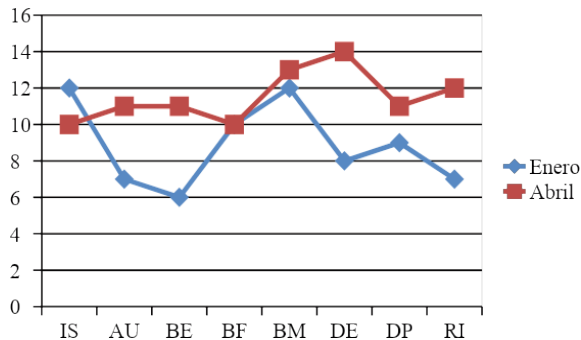
Figura 3. Resultados Escala KidsLife

En los resultados obtenidos tras las medidas pre-post intervención de la escala KidsLife, se observan mejoras en el total de las dimensiones, excepto en IS, ya que el entrenamiento de SAAC únicamente se ha desarrollado en casa y con su familia. Destacar también que la puntuación en Bienestar Físico se mantiene, lo que es lo adecuado, ya que las actividades llevadas a cabo tienen finalidad comunicativa exclusivamente (ver figura 3).