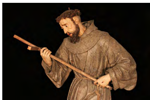
▪ Fig. 12. Luis Salvador Carmona. San Francisco de Asís. c.1740-1745. Plasencia, palacio episcopal. Vista de perfil.

En el convento de Plasencia sabemos que san Francisco tenía su capilla situada en el presbiterio, abriendo paso desde la sacristía por el costado de la Epístola 54 . El prurito que el artista ponía en conocer el espacio para el que iban destinadas sus esculturas, unido a la creatividad más exquisita y elegante con la que siempre se enfrentó a la efigie del santo –fruto sin duda de su devoción–, constituyen un argumento para justificar la composición y el nuevo modelo que introduce nuestra talla en la serie que Luis Salvador dedicó al Poverello d'Assisi . En lo que respecta a la composición, cabe argüir que el artista confeccionó una obra plenamente equilibrada, que el fiel podía contemplar en su capilla desde distintos puntos de vista dentro de un espacio circulante, fruto del propósito del escultor por alcanzar la audacia de inserción espacial