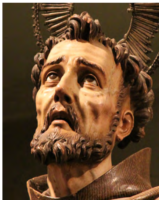
▪ Fig. 6. Luis Salvador Carmona. San Francisco de Asís . 1740. Yepes (Toledo), iglesia de San Benito. Detalle del rostro.

La intensa espiritualidad que el artista logró materializar en el rostro de san Francisco es una de las notas dominantes de la escultura placentina. El artista debió crear un modelo para representar al Poverello d'Assisi al inicio de su carrera, con rasgos faciales y detalles que serán constantes en su trayectoria, y que repetirá con variantes hasta llegar a la testa del Museo de León (c.1755) 38 . Uno de los primeros modelos fue el que hizo para Yepes, talla con la que entra en directa relación nuestra obra (Figs. 5 y 6): san Francisco presenta un rostro curtido, fruto de la observancia de la Regla (1209) que él mismo se dio, e inmerso en la contemplación del Crucificado que sostiene con ambas manos. La fuerza de su mirada se traduce en la tensión del gesto, con el ceño fruncido y los labios entreabiertos para hacer visibles la lengua y los dientes de pasta, detalles todos ellos muy del gusto de Carmona; la nariz, fuerte y afinada, contribuye a vigorizar el gesto. Las mejillas están demacradas y los pómulos y surcos nasogenianos muy pronunciados, con muestras