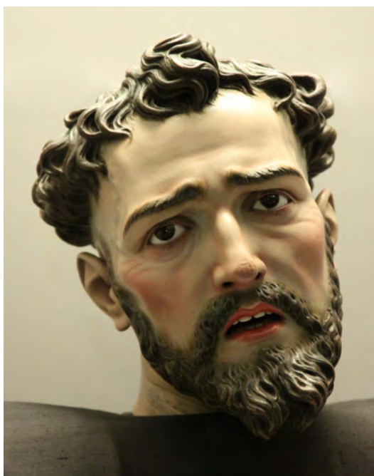
▪ Fig. 7. Luis Salvador Carmona. San Francisco de Asís . c.1755. Museo de León.

de demacración; se establece así una secuencia facial en tres planos que luego mantendrá, aunque de un modo muy suavizado, en las esculturas de Estepa, Olite, León (Fig. 7) o Ávila. Al verismo de la talla contribuyen las cuencas oculares, muy hundidas, con ojos de cristal, arrugas muy finas a ambos lados y pestañas pintadas; y las venas hinchadas que surcan las sienas, sello particular del artista, las cuales se pierden junto a los ojos y cuyo vigor es fruto del “flujo de sangre que el éxtasis eleva a la cabeza”, como en alguna ocasión ha señalado Nicolau Castro 39 . Los mechones de la ancha tonsura monacal son similares a los que tienen las esculturas de Yepes o León.