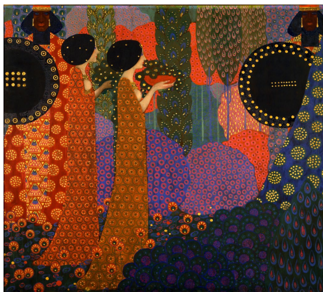
Figura 2: Vittorio Zecchin, Le principesse e i guerrieri ( Las princesas y los guerreros ), 1914. Óleo y oro sobre tela, 170 x 188 cm.

Vittorio Zecchin (1878-1947) y Galileo Chini (1873-1956) fueron los mejores ejemplos de esa influencia, ya que a través de la propia Bienal conocieron el laboratorio de experiencias de la Secession vienesa y fue, tanto en la ciudad como en sus intervenciones dentro de la Bienal, donde desarrollaron sus trabajos ligados a esa recepción.