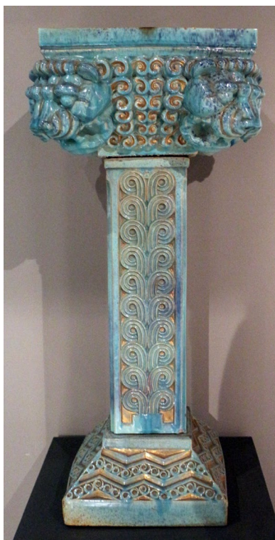
Figura 3: Galileo Chini, Florero decorativo para las Termas Berziere en Salsomaggiore , 1920. Cerámica y dorado, 90 x 42 x 42 cm.

Entre 1911 y 1913 Chini fue comisionado por el rey de Siam Chulalongkorn (Rama V) (1853-1910) para decorar el Palacio del Trono en Bangkok. Inspirado por el simbolismo a través de Ver Sacrum 10 , la recepción de Klimt se observa, entre otros, en los paneles de gran formato de La Primavera (1914), estructurada sobre motivos florales y formas geométricas y biomorficas. Chini la pintó en apenas un mes para el salón central del Palacio de Exposiciones de la Bienal que acogería las esculturas de Ivan Mestrovic (1883-1962) 11 .