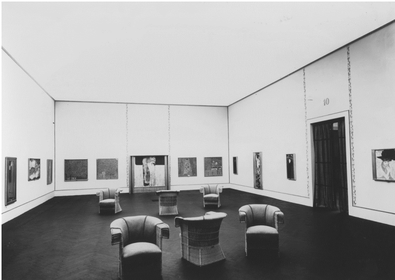
Figura 1: IX Exposición Bial de Venecia. Vista de la Sala 10 “Pro-Arte”, 1910.

del Imperio Austrohúngaro. Asimismo, Italia fue el país en el que tuvo una mayor fortuna crítica tanto por la relevancia de sus exposiciones como por la atención que suscitó su obra. Los debates teóricos dividieron a la crítica entre los que la consideraban decadente e incomprensible y aquellos que lo reconocieron como uno de los heraldos del arte nuevo como Umberto Boccioni (1882-1916) –que lo definió como un aristocrático innovador del estilo– y Ardengo Soffici (1879-1964).