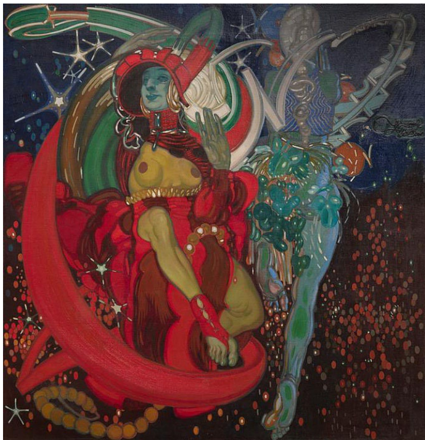
Figura 6: Vito Timmel, Fuochi d'artificio ( Fuegos artificiales ), 1924. Óleo sobre tela, 100,5 x 100,5 cm.

reflejaba el conflicto entre mujeres y hombres de moda en el periodo, y los motivos decorativos, van desapareciendo durante su carrera.