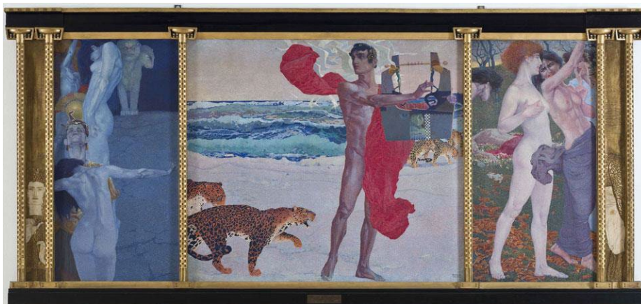
Figura 5: Luigi Bonazza, La legenda di Orfeo/Rinascita d'Euridice/Morte di Orfeo ( La leyenda de Orfeo/Renacimiento de Euridice/Muerte de Orfeo ), 1905. Óleo sobre tela, 176 x 380 x 10 cm.

Bonazza retornó a Trento en 1912 y adquirió unos terrenos en Bolghera, un barrio meridional en la periferia de la ciudad, para construir su casa 18 . El artista concibió todos los elementos en los que trasladó la influencia centroeuropea en pinturas murales, el mobiliario y los motivos ornamentales, en línea con las casas de arte que se habían realizado en Italia hasta el momento 19 y que concluiría en los años cuarenta 20 .