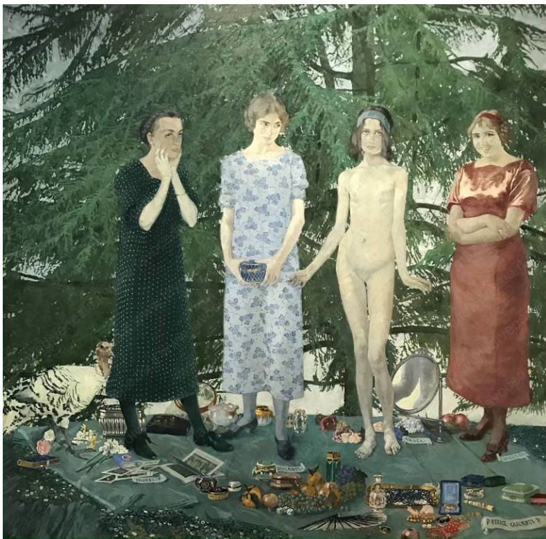
Figura 4: Felice Casorati, Le signorine ( Las muchachas ), 1912. Óleo sobre tela, 197 x 190 cm.

En Verona, Casorati entabló amistad con Attilio Trentini (1857-1919) y con su hijo Guido (1889-1975). El padre, que provenía de la decoración mural, se había formado en Milán y en Múnich y era buen conocedor de la cultura vienesa. La obra de Attilio Trentini acusa la decoración e inserción de motivos dorados determinados por el uso del mosaico de Klimt. Por su parte, Guido observa la incorporación de elementos simbolistas en los que el ornamento se convierte en una de sus características – La fanciulla sommersa ( La muchacha sumergida , 1914), en la que reinterpreta el mito de Ofelia, o las dos pinturas tituladas La pianta rossa ( Planta roja ) de 1914 y 1915, caracterizadas por su color y composición desnaturalizados–.