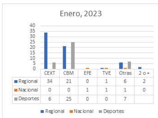
Gráfico 5. Fuentes utilizadas en Canal Extremadura TV en enero de 2023

El mes de diciembre, representado en el gráfico 4 y la tabla 6, no deja de ser un mes siempre un tanto anómalo sobre todo si coincide en que dos de los días que han sido analizados son días festivos o previo a festivos (han sido analizados el día 6, festivo nacional por la celebración del Día de la Constitución, y el 24 de diciembre, víspera del día de Navidad y con reducción horaria en muchas empresas). En este caso, en el que más del 50% de la procedencia de imágenes para el informativo es de la productora CBM tiene una clara lectura: permisos para el personal del Canal que hace necesario una mayor cobertura por parte de la Productora. Esto se traduce en que los recursos humanos del Canal son claramente