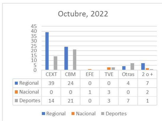
Gráfico 2. Fuentes utilizadas en Canal Extremadura TV en octubre de 2022

En la opción que otorgamos a “otras fuentes” indicar que en este caso un total de 6 noticias son procedentes de redes sociales, que va a ser la fuente habitual en este “cajón de sastre” que hemos incluido en el apartado de “otras...”. También con 6 noticias encontramos aquellas informaciones con más de una fuente que, en este caso, no hacen sino dar mayor peso a Canal Extremadura y a la productora CBM, ya que de esas 6 noticias cinco de ellas están elaboradas con recursos de la productora y el Canal, mientras que la restante está elaborada con recursos del Canal y de la Agencia EFE.