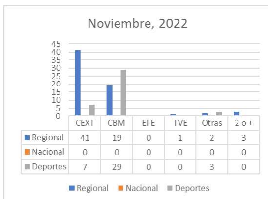
Gráfico 3. Fuentes utilizadas en Canal Extremadura TV en noviembre de 2022

en el caso para más de dos encontramos casos incluso con más de dos fuentes (EFE/TVE/Canal o RRSS/CBM/Canal). En todas las variables posibles, en todas aparece Canal Extremadura como fuente por lo que debe entenderse que sumar alguna otra fuente en la noticia ha sido para completar recursos propios. Resumiendo: Canal Extremadura está presente en todas cuando existe más de una fuente, CBM está presente en 5, TVE aparece en 3, EFE en 1 y el uso de las redes sociales como fuente ha sido utilizada en 4 ocasiones.