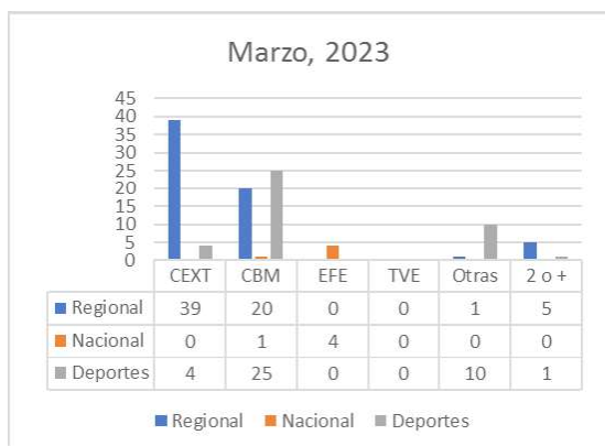
Gráfico 7. Fuentes utilizadas en Canal Extremadura TV en marzo de 2023

portivos en manos de la productora CBM, una división reflejada en bastante de los gráficos presentados. Este mes, además, la producción deportiva tiene un número muy representativos de noticias. En lo referente a otras fuentes, serán las redes sociales la fuente de procedencia de los recursos audiovisuales, mientras que para el caso de más de una fuente nos encontramos igualmente esta vez con presencia en todos los casos de las redes sociales emparejadas con la Agencia EFE, con la productora CBM y con el propio Canal.