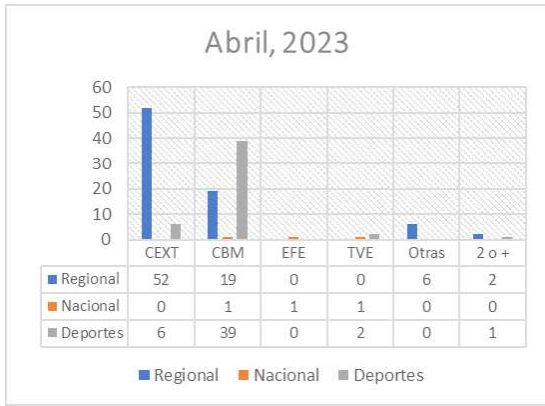
Gráfico 7. Fuentes utilizadas en Canal Extremadura TV en marzo de 2023

Nos encontramos igualmente información con más de una fuente, estando en este caso representadas –en todos los casos– CBM y Canal Extremadura, acompañada por redes sociales en la mayor parte de los casos (en 5 de los 6 casos).