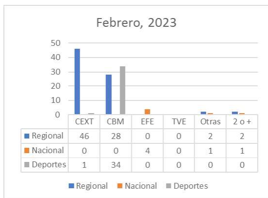
Gráfico 6. Fuentes utilizadas en Canal Extremadura TV en febrero de 2023

En la utilización de otras fuentes, llama esta vez poderosamente la atención que para información deportiva nos encontramos material procedente de la televisión gallega (tres noticias) e imágenes de la Real Federación Española de fútbol (cuatro noticias).