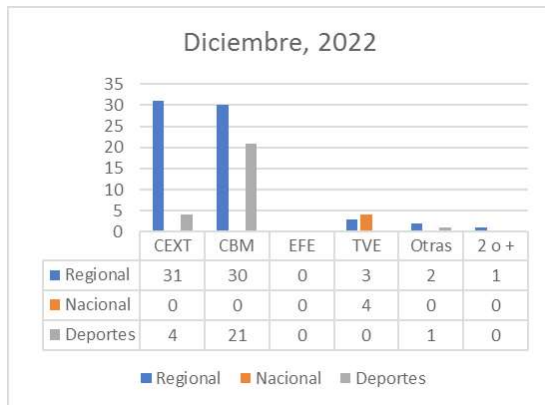
Gráfico 4. Fuentes utilizadas en Canal Extremadura TV en diciembre de 2022

El gráfico 3 y la tabla 5 correspondiente al mes de noviembre, nos ayuda a entender la supremacía de las dos principales fuentes y, frente a lo que pudiera estimarse de la preponderancia del Canal como fuente, nos aporta los mismos datos para Canal y para CBM como fuentes de información cuando se utiliza una sola fuente. Entendamos que en este mes se refleja claramente lo señalado con anterioridad, la preponderancia de la productora para noticias deportivas.