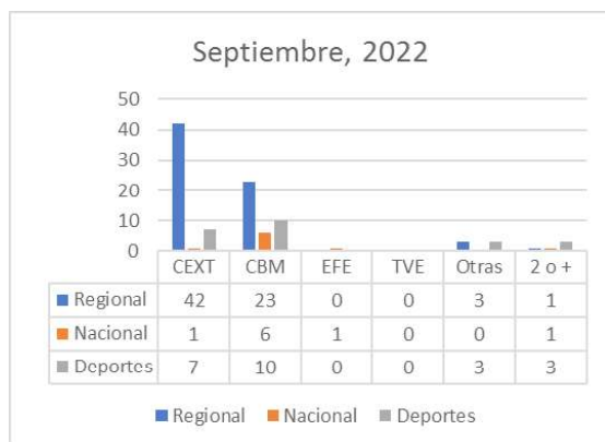
Gráfico 1. Fuentes utilizadas en Canal Extremadura TV en septiembre de 2022

Vamos a ir analizando los resultados por mes, agrupando la información que hemos obtenido en las tablas de análisis la cual recoge la información por día y por sección temática. No obstante, se destaca aquellos elementos que recogidos en la tabla de análisis no pueden ser visualizados, por su naturaleza, en los gráficos que presentamos.