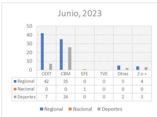
Gráfico 8. Fuentes utilizadas en Canal Extremadura TV en junio de 2023