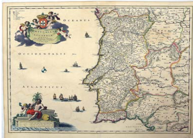
VISSCHER, Nicolaes. Portugalliae et Algarbiae Regna, [1658?]