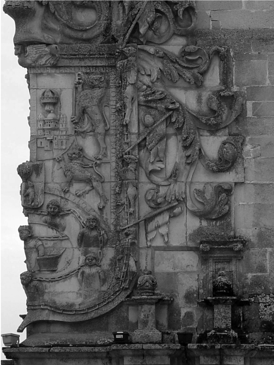
FIG. 3. Trujillo. Esquina de las Casas del Estado de La Conquista. Hacia 1560.