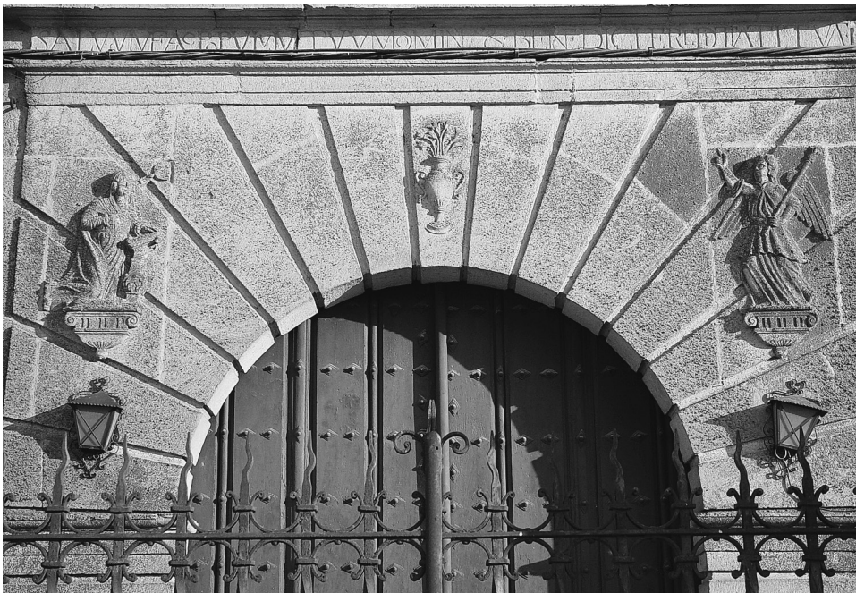
FIG. 5. Trujillo. Fachada principal convento de Dominicos de la Encarnación.