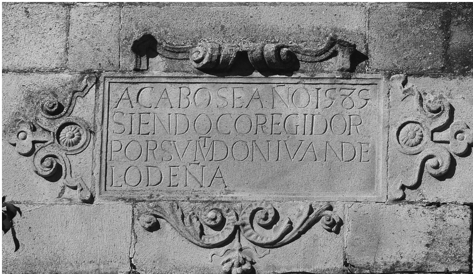
FIG. 2. Trujillo. Alhóndiga Nueva. Cartela conmemorativa de su terminación. 1589.