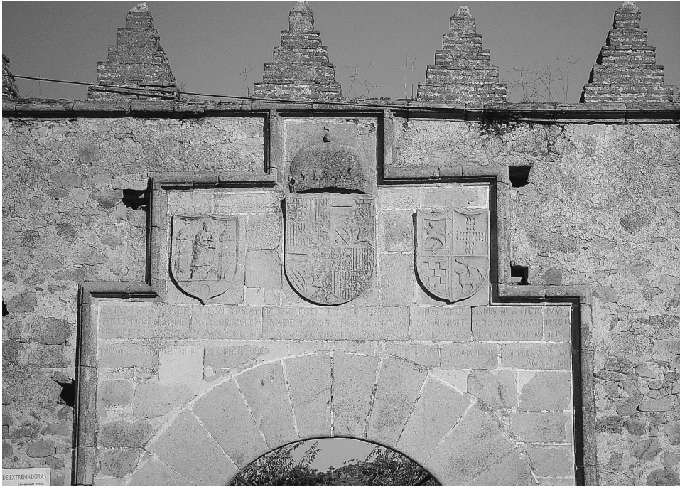
FIG. 4. Trujillo. Fachada de la Puerta de la Dehesa de los Caballos. 1535.