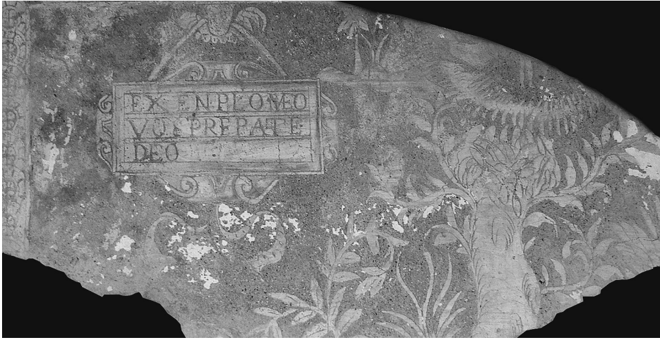
FIG. 1. Trujillo. Convento de Franciscanas de La Coria. Esgrafiado. Detalle. Claustro. ½. S. XVII.