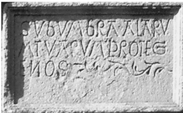
FIG. 8 y 8BIS. Trujillo. Puerta principal de la Casa-Fuerte de los Bejarano. Hacia 1500. Nótese la cartela con la inscripción «Sub Umbram Alraum Taurum Protegenos».