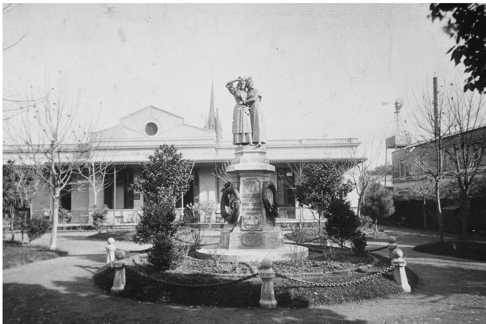
FIG. 3. Hospital Francés. Buenos Aires, Argentina. 1925.