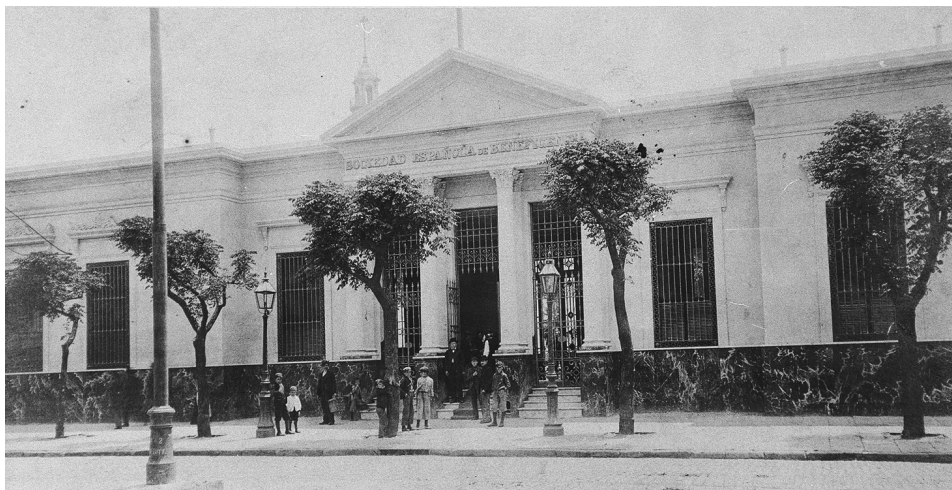
FIG. 5. Sede de la Sociedad Española de Beneficencia. Buenos Aires, Argentina.