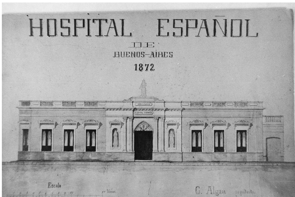
FIG. 7. Hospital Español. Buenos Aires, Argentina. 1872.