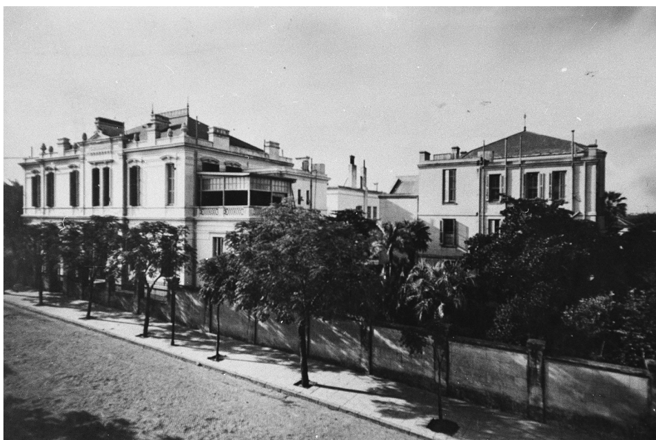
FIG. 4. Hospital Británico. Buenos Aires, Argentina. 1925.