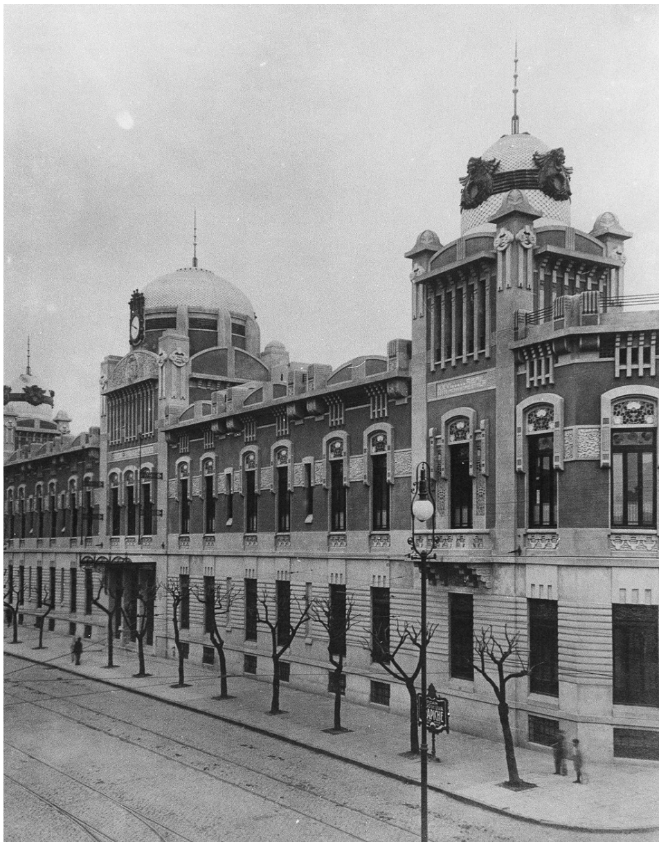
FIG. 9. Hospital Español. Buenos Aires, Argentina.