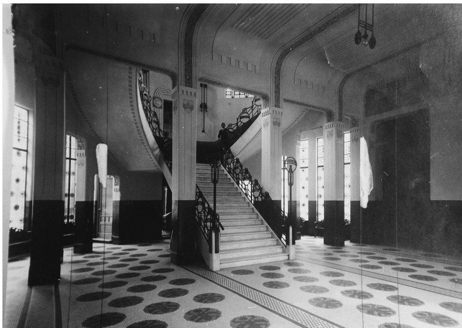
FIG. 8. Hospital Español Interior. Buenos Aires, Argentina.