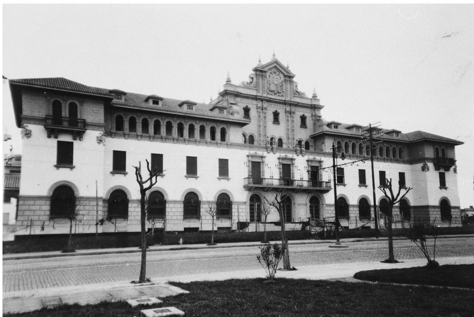
FIG. 6. Sede de la Sociedad Española de Beneficencia. Buenos Aires, Argentina.