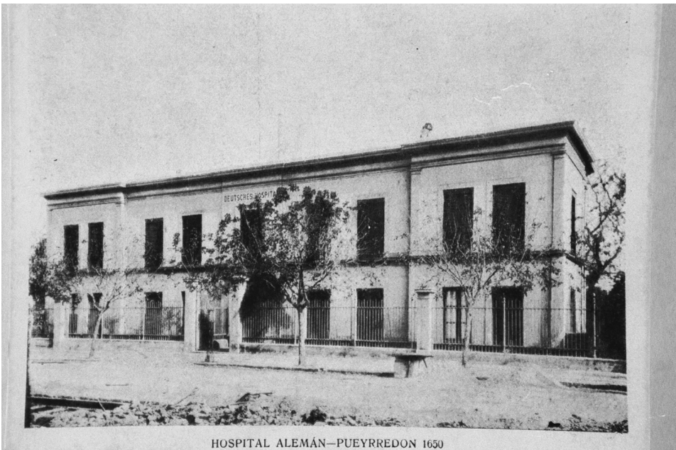
FIG. 2. Hospital Alemán. Buenos Aires, Argentina. 1925.