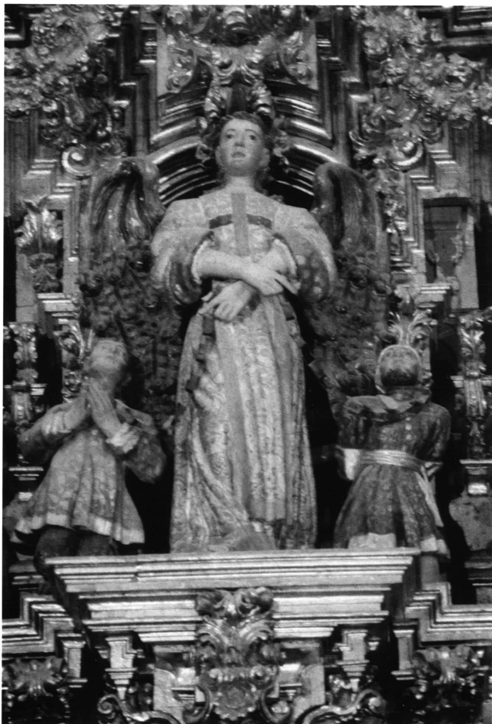
LÁM. III. Retablo mayor del antiguo convento trinitario de Hervás: El Ángel redentor de cautivos.