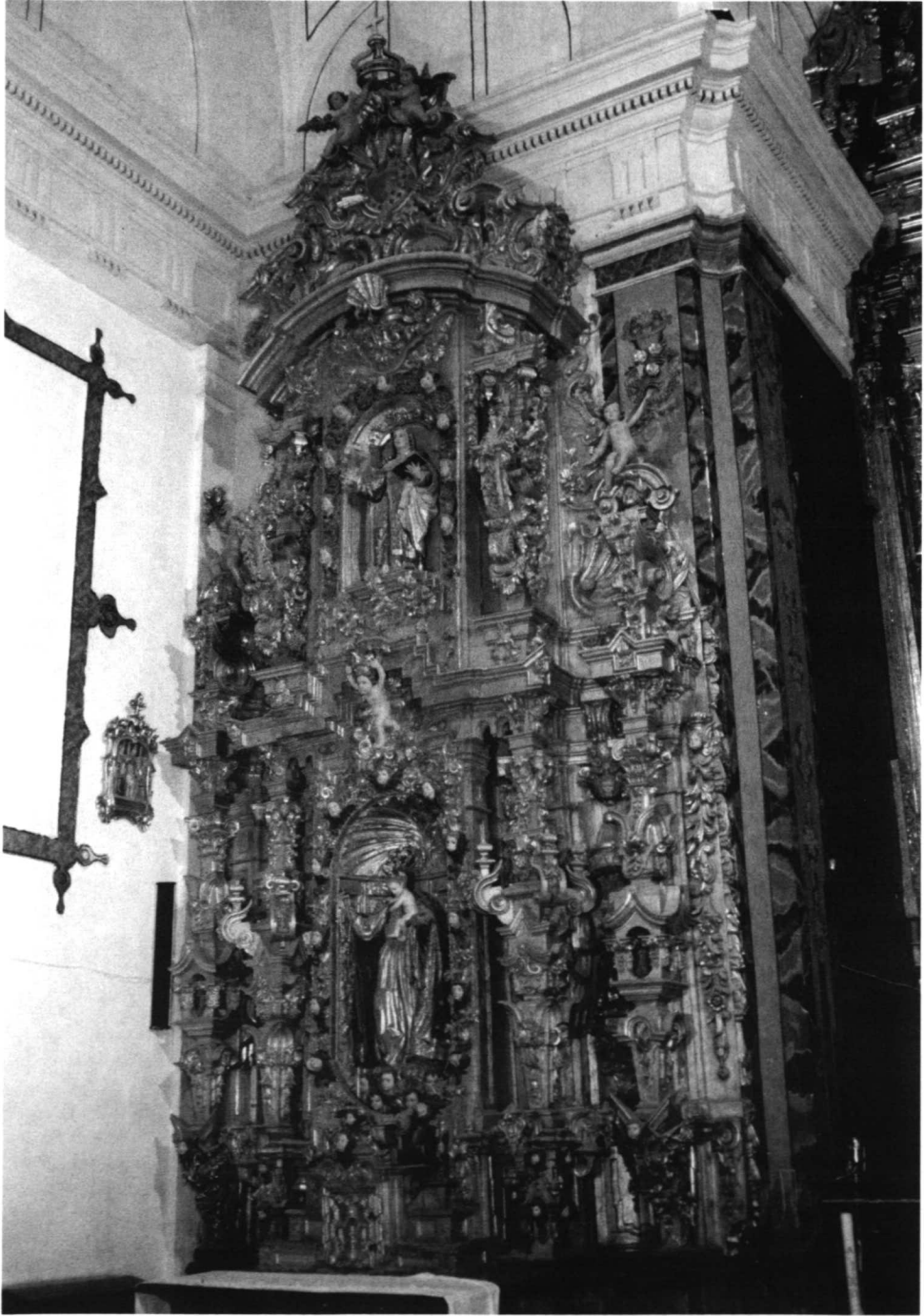
LÁM. V. Antiguo convento trinitario de Hervás: retablo colateral del Evangelio, dedicado a Ntra. Sra. de Gracia con el Niño.