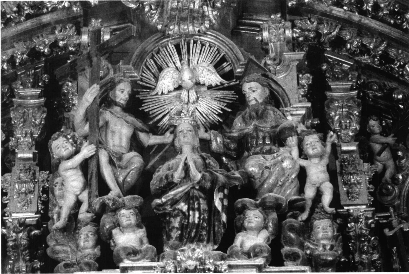
LÁM. IV. Retablo mayor del antiguo convento trinitario de Hervás: La coronación de la Virgen por la Santísima Trinidad.