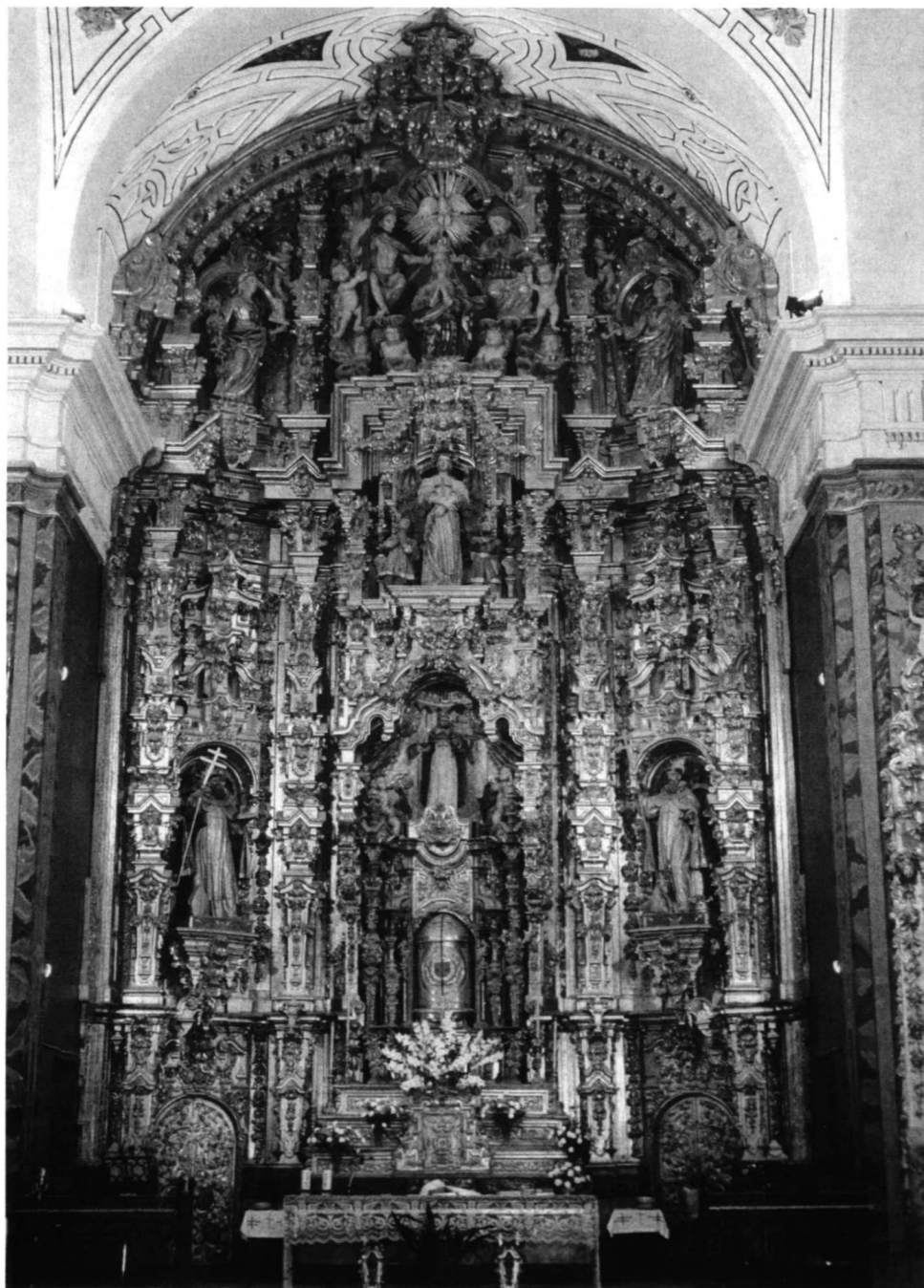
LÁM. I. Retablo mayor del antiguo convento trinitario de Hervás.