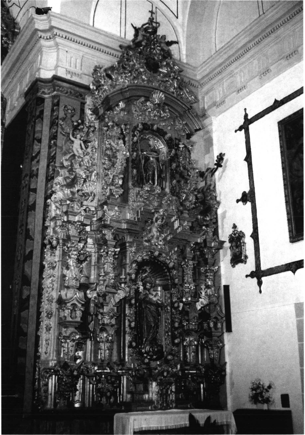
LÁM. VI. Antiguo convento trinitario de Hervás: retablo colateral de la Epístola, dedicado a San José con el Niño.