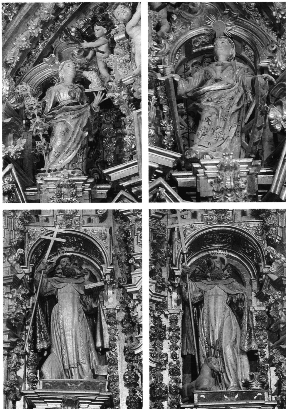
LÁM. II. Retablo mayor del antiguo convento trinitario de Hervás: 1. Santa Inés. 2. Santa Catalina de Alejandría. 3. San Juan de Mata. 4. San Félix de Valois.