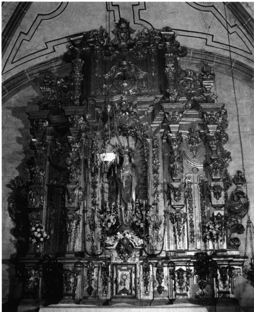
LAM. VIII. Catedral de Coria. Retablo de la capilla de los Maldonado, dedicado a la Inmaculada.