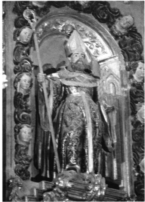
LÁM. VII. Antigo convento trinitario de Hervás, imágenes de los retablos colaterales: 1. Nuestra Señora de Gracia con el Niño (colateral del Evangelio). 2. Santa Teresa de Jesús (colateral del Evangelio). 3. San José con el Niño (colateral de la Epístola). 4. San Agustín de Hipona (colateral de la Epístola).