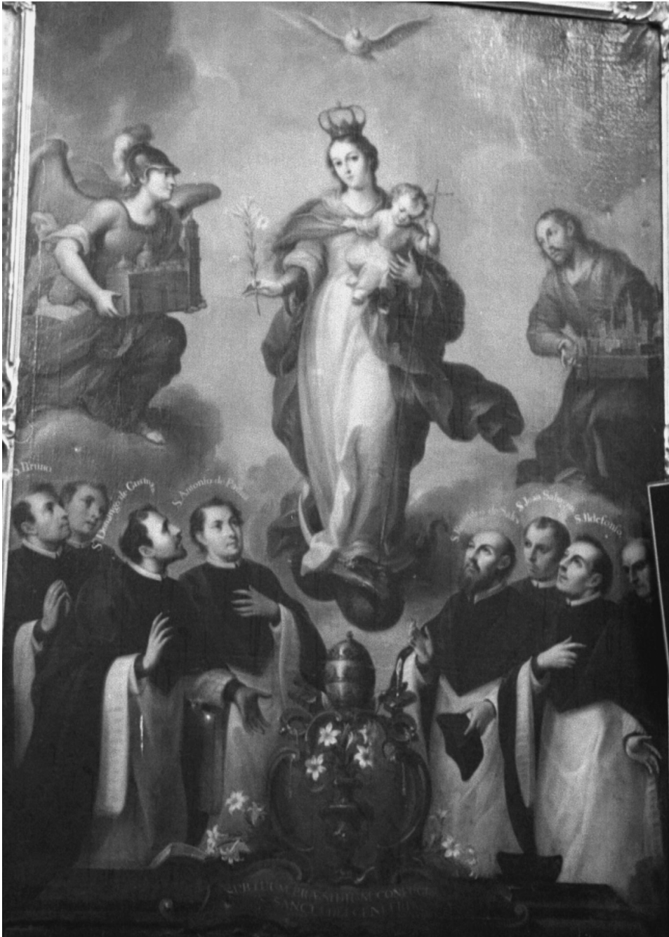
FIG. 12. José de Ibarra: Patrocinio de la Virgen Inmaculada sobre Puebla. Siglo XVIII. Coro sobre el lado de la Epístola, Catedral de Puebla.