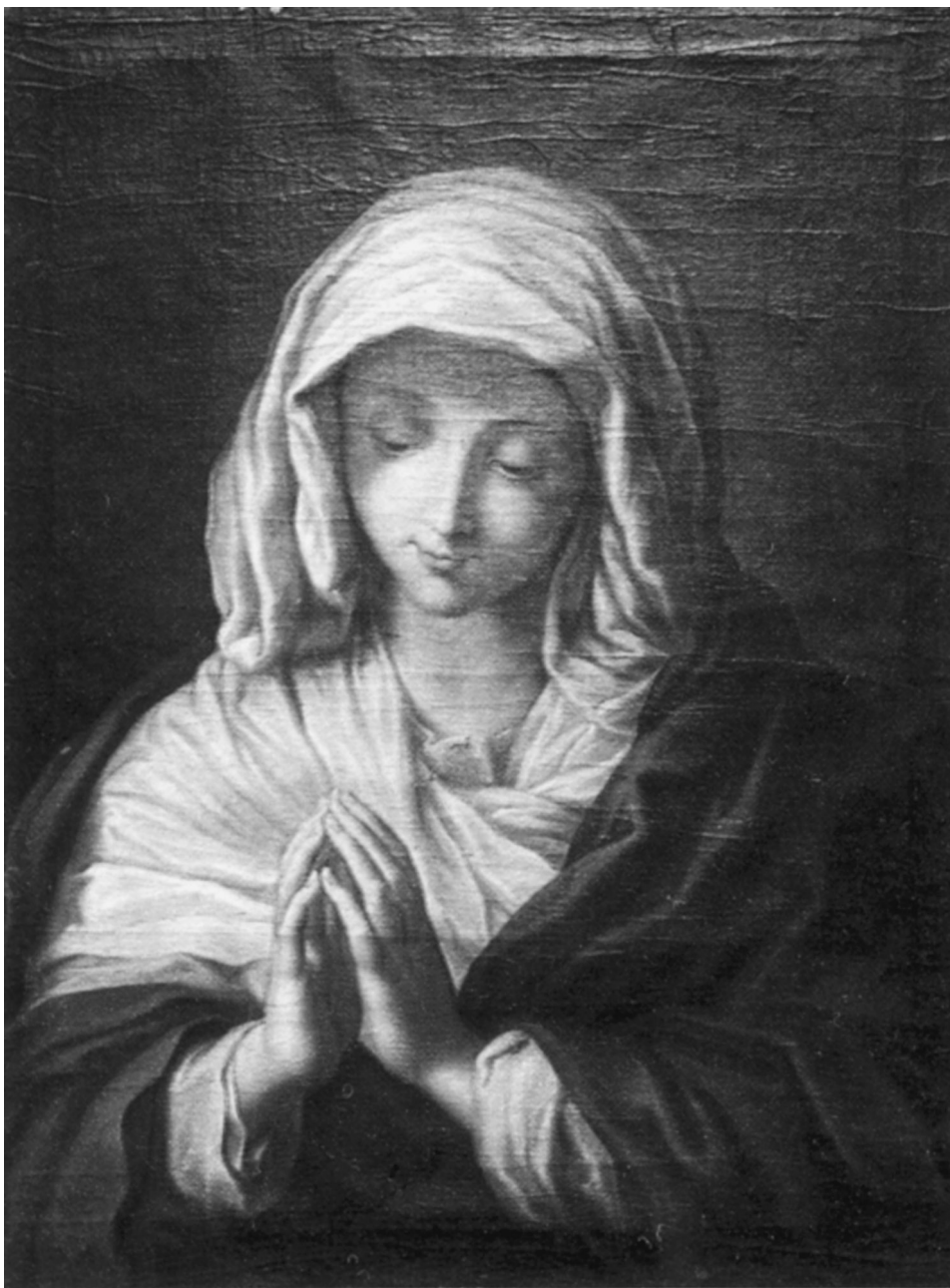
FIG. 8. Anónimo (copia de Sassoferato): María en oración, Siglo XVII, Sacristía de la Catedral de Puebla.