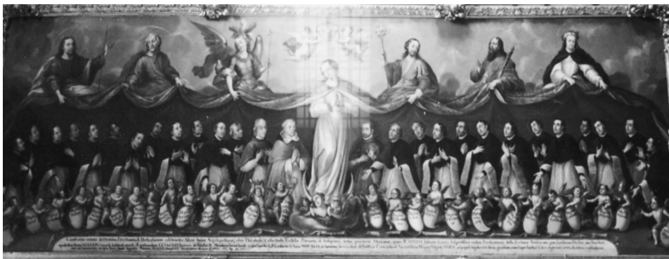
FIG. 9. José Joaquín Magón (atribuido): Patrocinio de la Virgen sobre la Diócesis de Puebla. Siglo XVIII, Sacristía de la Catedral de Puebla.

María. Se trata de un tema derivado del cuadro que originalmente realizara Guido Reni cuyo modelo sirvió de inspiración a varios artistas de la Puebla barroca, pues encontramos más versiones de este mismo tema en otros templos de la ciudad.