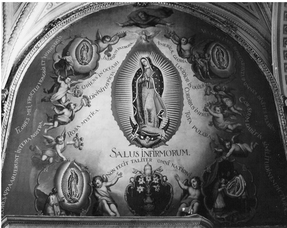
FIG. 3. Anónimo: Los milagros de la Virgen de Guadalupe. Siglo XVIII, Capilla de Nuestra Señora de los Dolores, Catedral de Puebla.

pero que no presenta tan buena calidad como las habituales obras de Luis Berrueco, el pintor dieciochesco a quien, insistentemente, se atribuye el lienzo.