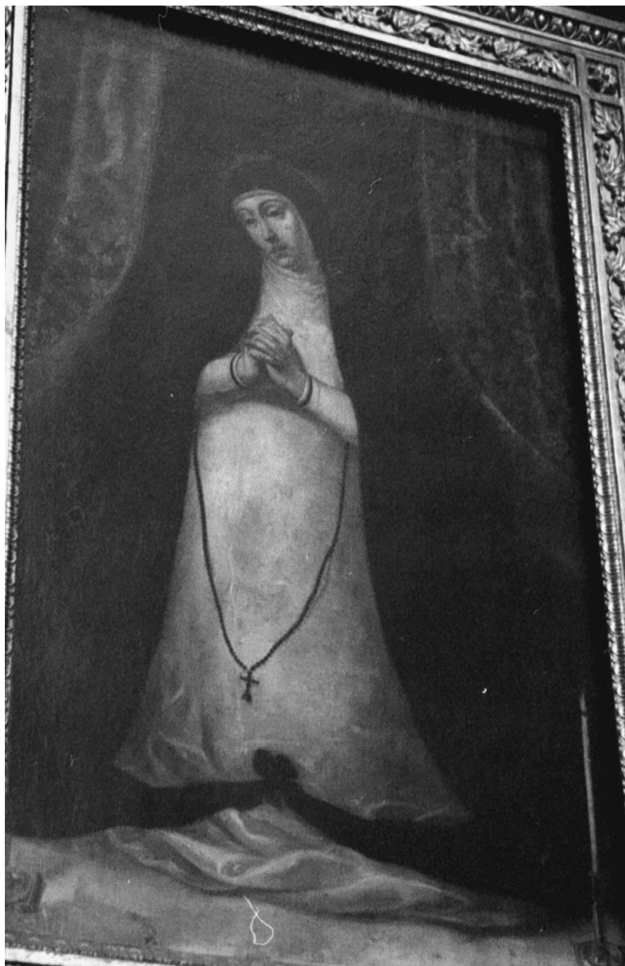
FIG. 5. Anónimo: Nuestra Señora de la Soledad. Siglo XVIII, Capilla de Nuestra Señora de la Soledad, Catedral de Puebla.