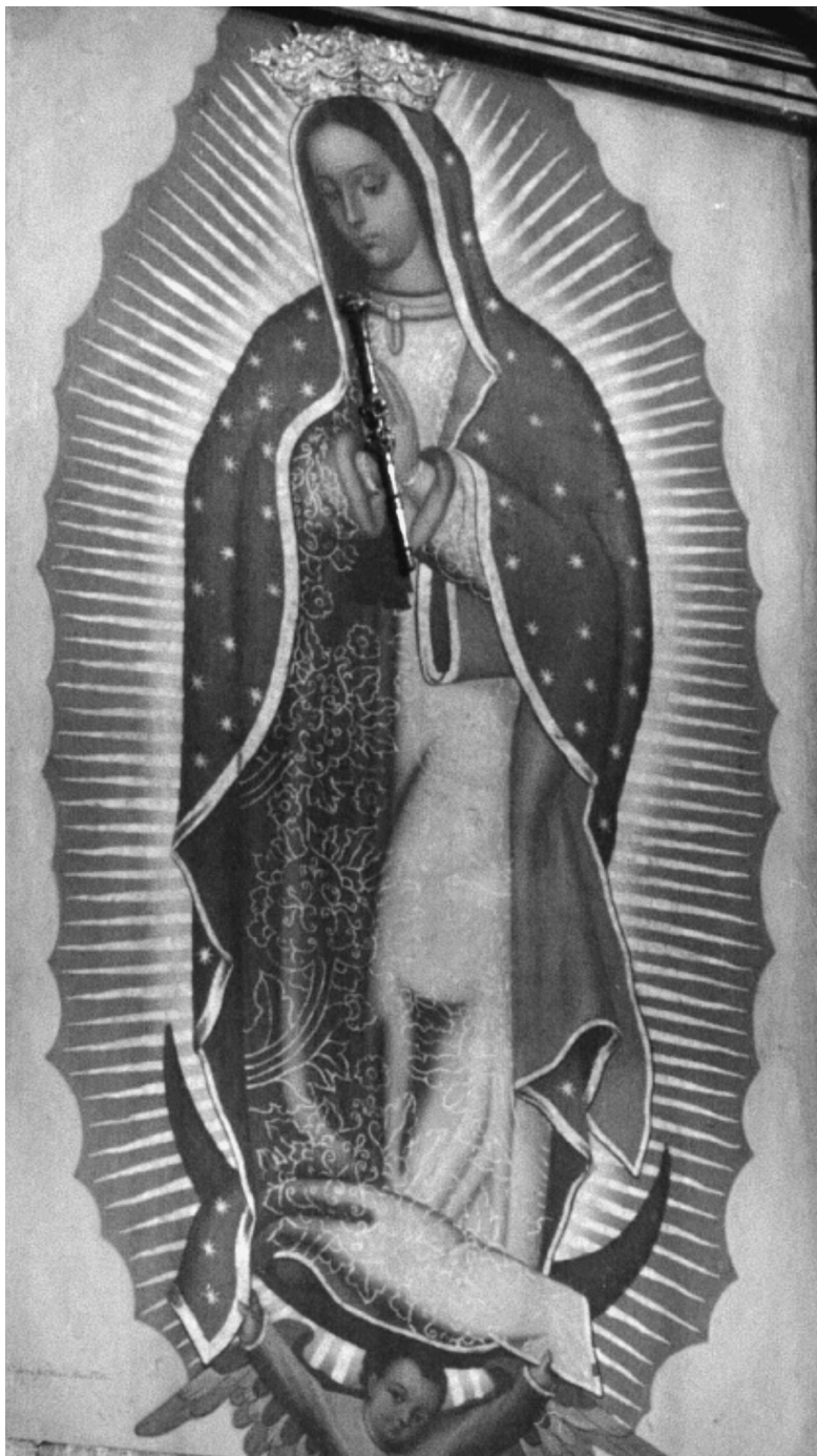
FIG. 2. Miguel Cabrera: Nuestra Señora de Guadalupe, 1756. Capilla de la Virgen de Guadalupe, Catedral de Puebla.