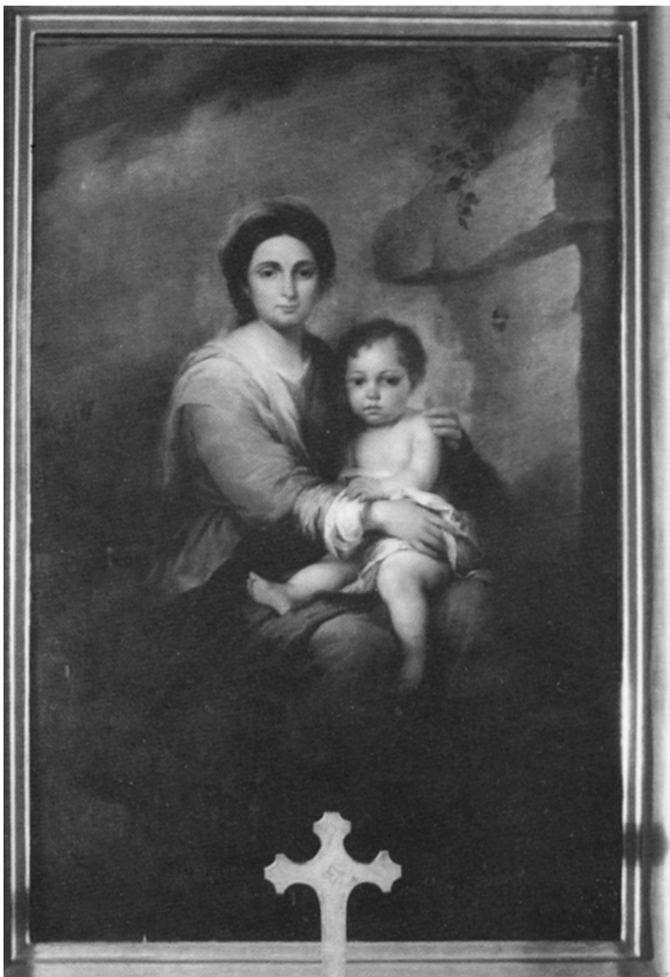
FIG. 7. Anónimo (copia de Murillo): Virgen de Belén, Capilla del Sagrado Corazón de Jesús, Catedral de Puebla.