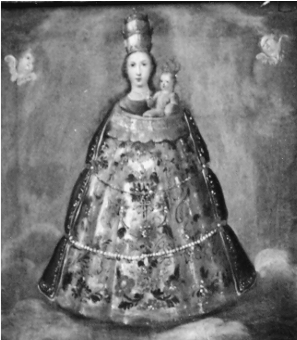
FIG. 4. Anónimo: Virgen de Loreto. Siglo XVIII, Capilla del Ochavo, Catedral de Puebla.

También será en la Capilla del Ochavo donde se conserve la única pintura que contiene esta advocación en el templo. Se trata de un lienzo de pequeño tamaño centrado, únicamente, en la imagen mariana (Fig. 4). Resulta curioso no contar con más ejemplares de esta advocación, pues la devoción que existe en la Nueva España por la Virgen de Loreto viene desde la época de la Conquista y fue una imagen muy demandada para venerarse en distintos templos, debido al patrocinio que de ella hicieron los jesuitas.