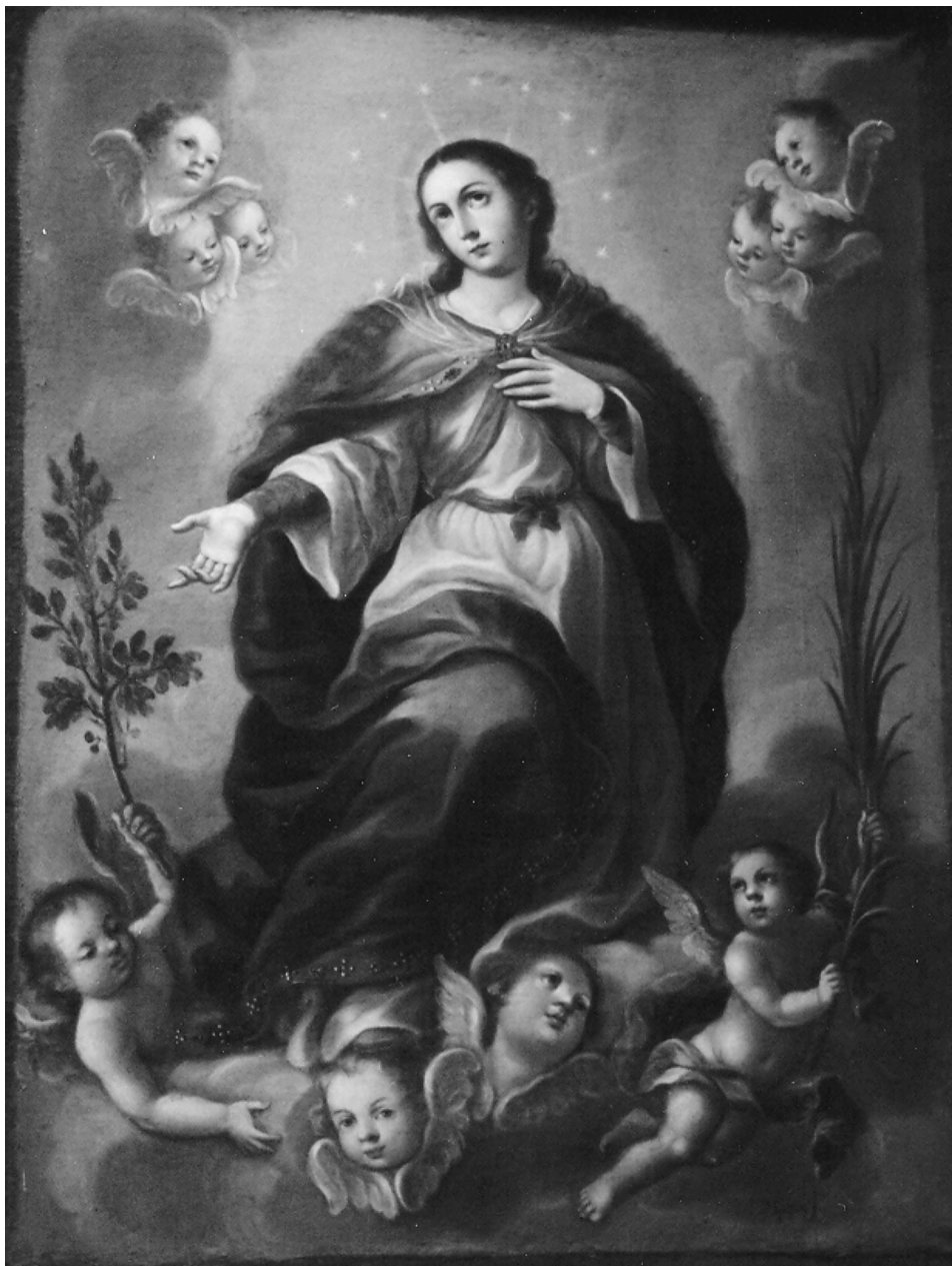
FIG. 1. José Joaquín Magón: Inmaculada Concepción. Siglo XVIII. Sacristía de la Catedral de Puebla.