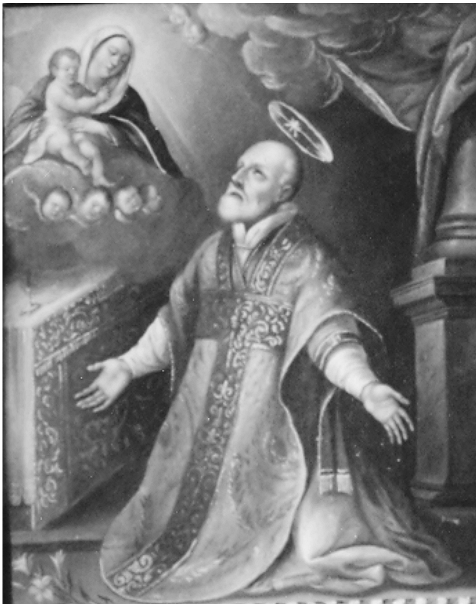
FIG. 10. Anónimo ( copia de Guido Reni ): Aparición de la Virgen María a San Felipe Neri. Siglo XVII, Capilla del Ochavo, Catedral de Puebla.