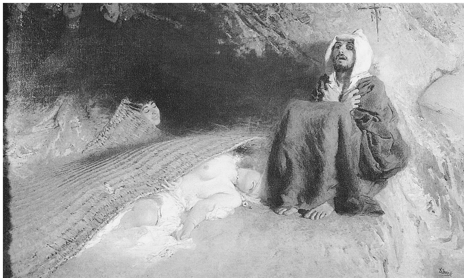
LÁM. 13. La Tentación de San Antonio . 1903. D. Morelli.