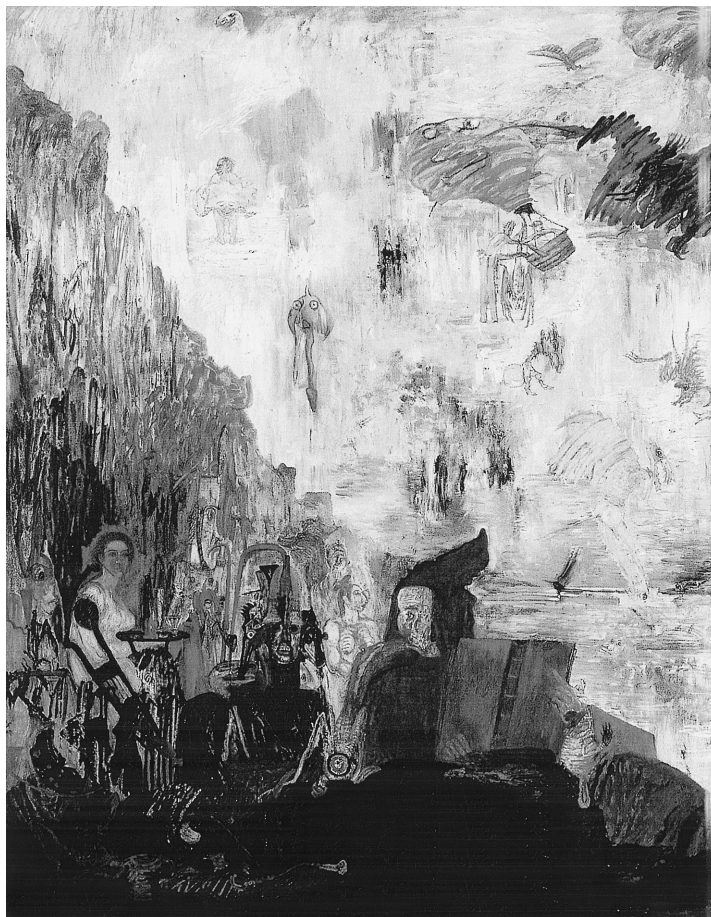
LÁM. 5. Las Tribulaciones de San Antonio. 1887. Ensor.

impresionismo. Su pintura es muy expresiva, fantasmagórica, agresiva y chillona. Su punto de vista sobre los acontecimientos y el mundo eran profundamente subjetivos. Su universo es fantástico, como queda bien patente en sus dos cuadros, La Tentación de San Antonio , uno de ellos conservado en el Museo de Arte Moderno de Nueva York, y el segundo guardado en una colección particular. Es, al mismo tiempo, irónico y sarcástico. Hace del mundo una crítica radical. Todas estas cualidades explican su interés por la figura de Don Quijote. Se acusa en su obra el influjo de El Bosco, de Bruegel, de Rembrandt y de Rops, entre otros. Los dos cuadros, que tienen como protagonista a San Antonio, son un excelente exponente de las corrientes artísticas del arte de Ensor. En ambos se observa una total libertad de imaginación. En Las Tribulaciones de San Antonio hay un fuerte contraste de colores. En La Tentación de San Antonio dominan los tonos amarillentos. La tentación se presta a una serie de visiones fantásticas y sin coherencia. El conjunto es al mismo tiempo caótico y ruidoso. En el ángulo inferior izquierdo marcha una procesión de burgueses bien identificados