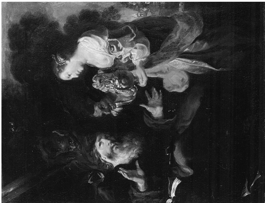
L.ÁM. 2. La Tentación de San Antonio, 1624-1625. Johann Liss.