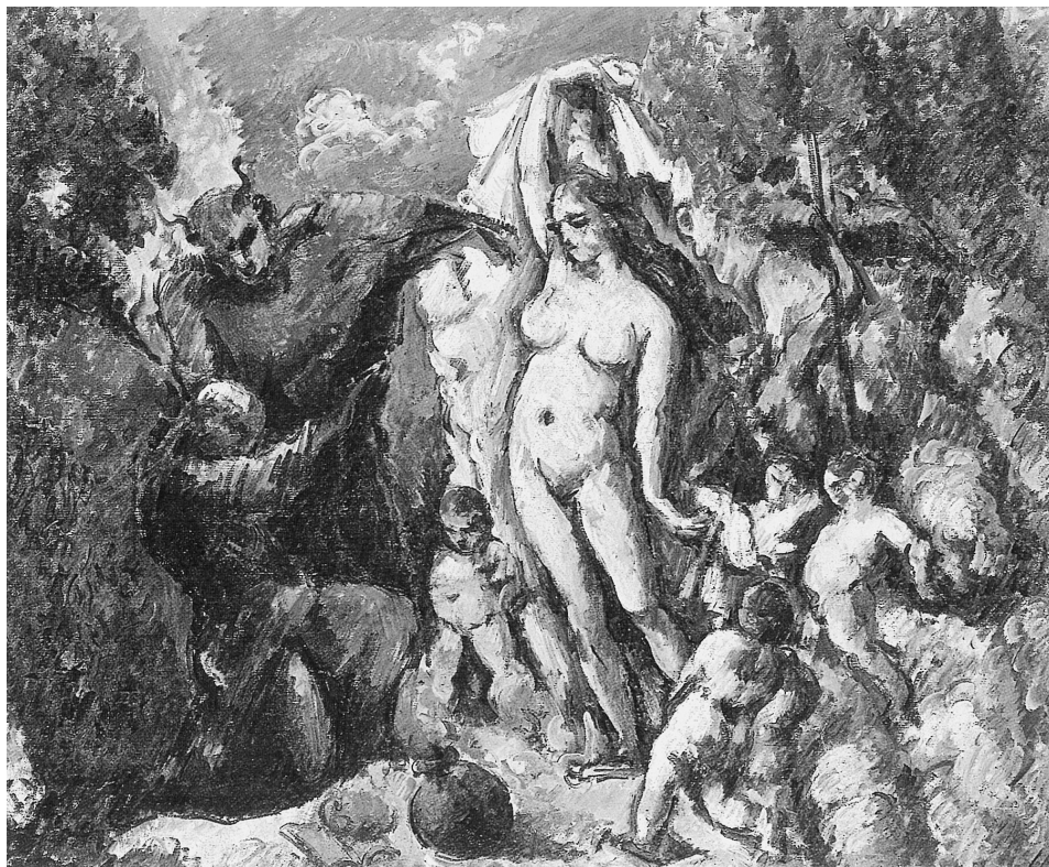
LÁM. 3. La Tentación de San Antonio . 1873-1877. Cézanne.

oscuro. Los arbustos, que indican que las tentaciones tienen lugar al aire libre, son verdosos. Los cuerpos desnudos son de color blanquecino. El fondo del lado derecho es azulado, al igual que el cielo. Se observa, pues, un fuerte contraste de colores.