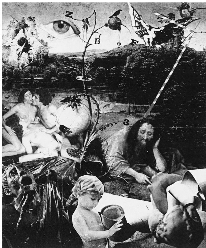
LÁM. 14. Las Tentaciones de San Antonio . Hacia 1990. V. Nello.