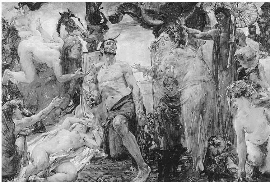
LÁM. 7. Tentación de San Antonio. 1908. Lovis Corinth.