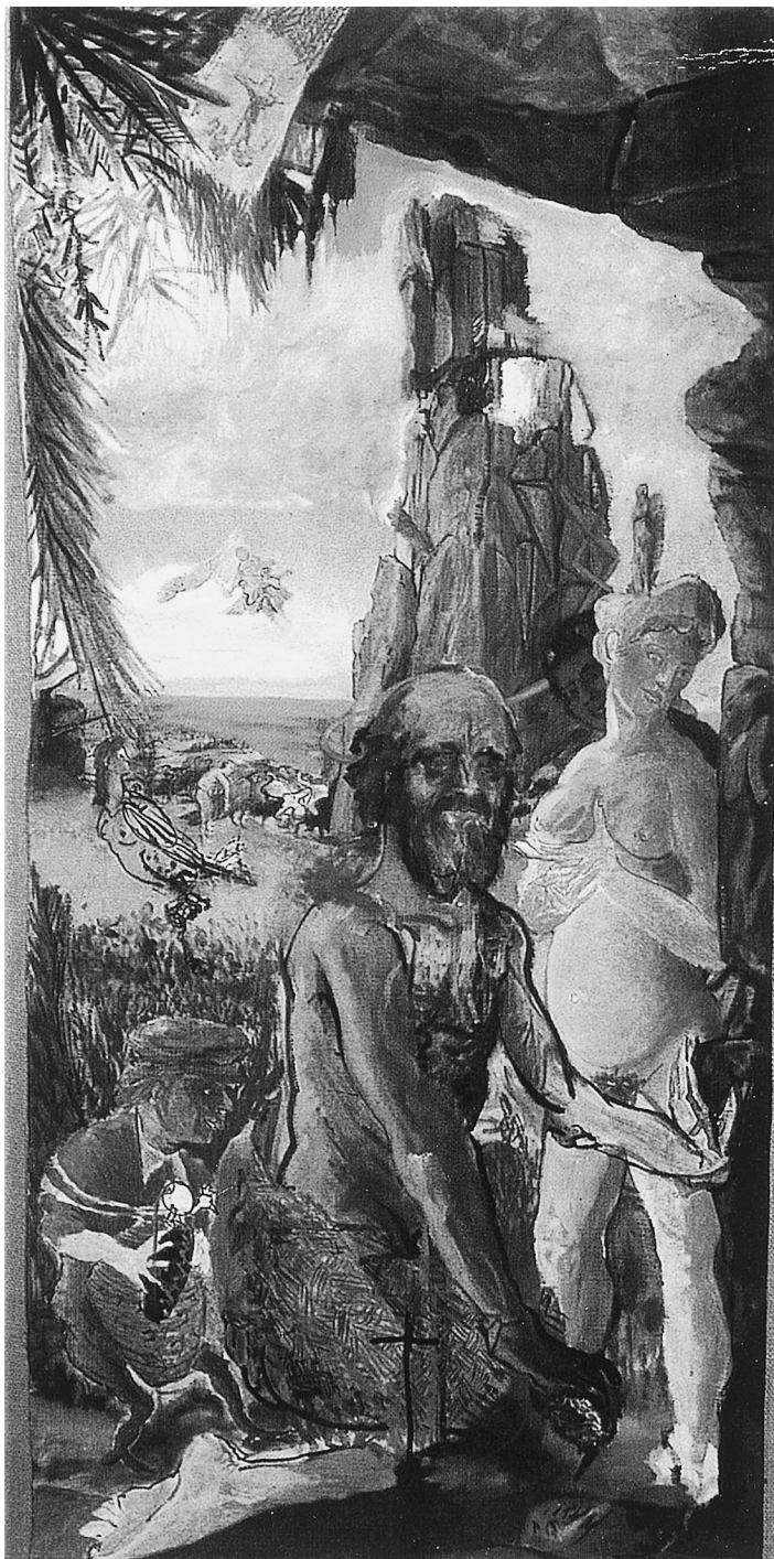
LÁM. 15. Tentaciones de San Antonio . 1992. C. Franco.