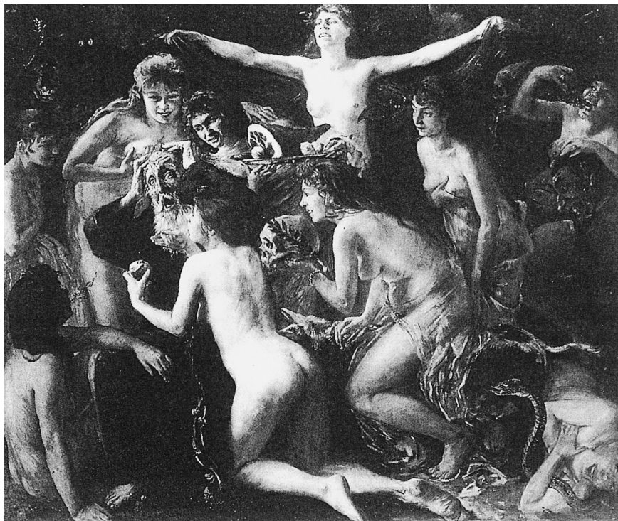
LÁM. 6. Tentación de San Antonio. 1897. Lovis Corinth.