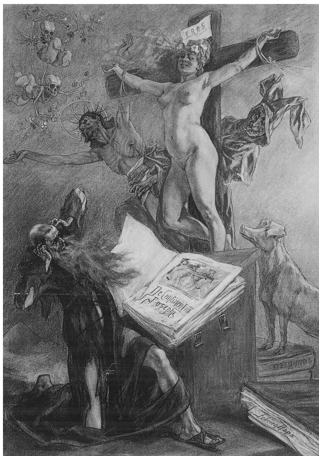
LÁM. 4. La Tentación de San Antonio . 1878. F. Rops.

libro. Detrás de la cruz, un cerdo apoya las patas delanteras en varios gruesos volúmenes, simboliza la lujuria. Detrás de la cruz, y envuelto en su manto rojo, que le tapa los cuernos, un diablo saca la lengua esperando el desenlace. Dos diablillos con una calavera por cabeza revolotean. Queda bien patente que el cuerpo de la mujer desnuda es el símbolo de lo inmundo. En la citada acuarela, Pornokrates , 1878, aquí una mujer desnuda conduce atado por una cuerda a un cerdo. En el cielo revolotean tres angelillos.