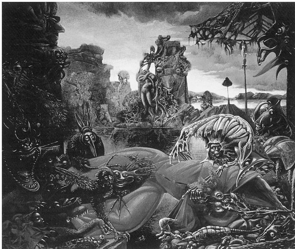
LÁM. 8. La Tentación de San Antonio . 1945. Max Ernst

dama desnuda, de pie, y de frente, es parecido al representado en su cuadro, datado entre los años 1940-1942, que lleva por título La Europa después del diluvio , en la actualidad en el Wadsworth Atheneum de Hartford, también con una dama desnuda, colocada de frente.