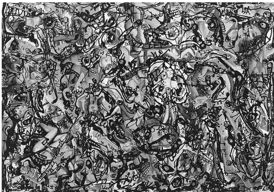
LÁM. 10. Tentaciones de San Antonio . 1964. A. Saura.