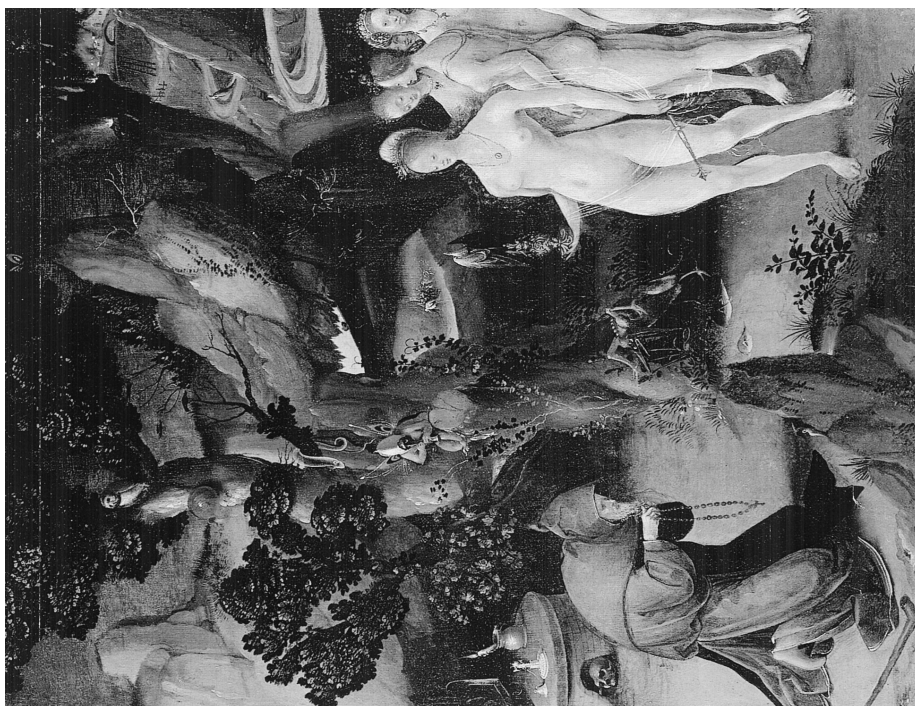
L.ÁM. 1. La Tentación de San Antonio, 1520. Jan Wellens Cock.