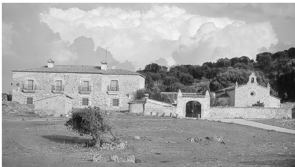
FIG. 7. La Matilla de los Almendros (Trujillo, Cáceres).