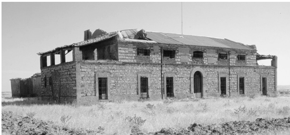
FIG. 1. Casa de La Pared (Quintana de la Serena, Badajoz).