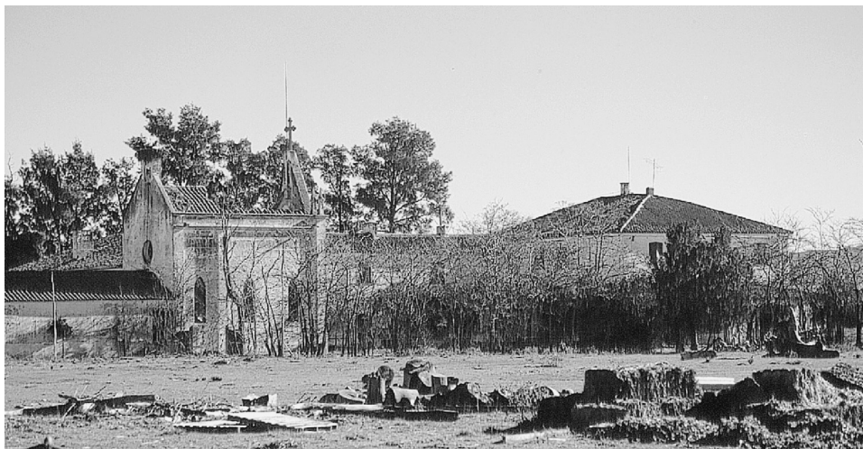
FIG. 4. Mesas Altas (Acedera, Badajoz).