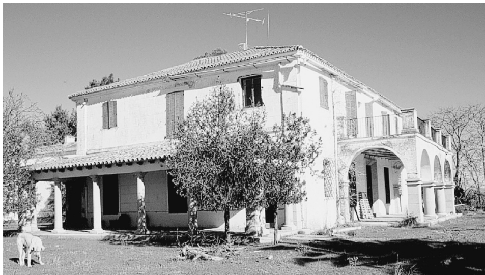
FIG. 6. Casa principal de Mesas Altas (Acedera, Badajoz).