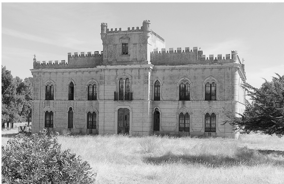
FIG. 2. Palacio del Conde de la Oliva en la finca La Zapatera (Oliva de Mérida, Badajoz).