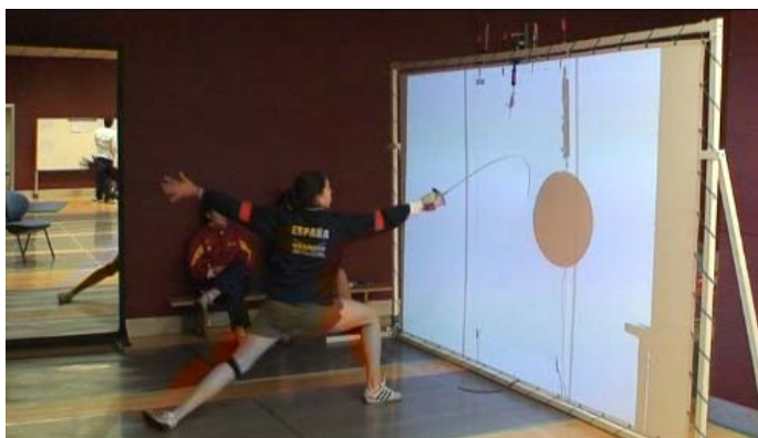
Figura 2.- Test de Tiempo de Respuesta Simple sobre un estímulo no específico de esgrima utilizando el fondo para tocar. (TRespS-if).

- Test de Tiempo de Respuesta Simple sobre un estímulo no específico de esgrima utilizando el fondo para realizar el tocado (TRespS-if) . En el cuál se realizó la tarea descrita anteriormente (TRVS-i), pero en este caso, los puntos se proyectaron sobre la pantalla y el Tiempo de Respuesta Simple se registro mediante el tocado de la pantalla con la punta del arma, tal y como se muestra en la figura 2.