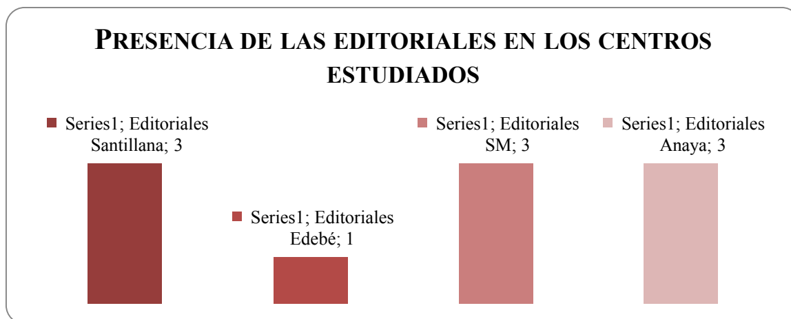
Gráfico 1: Presencia de editoriales en los centros estudiados.

A continuación, mostramos los resultados obtenidos en nuestro trabajo de campo.