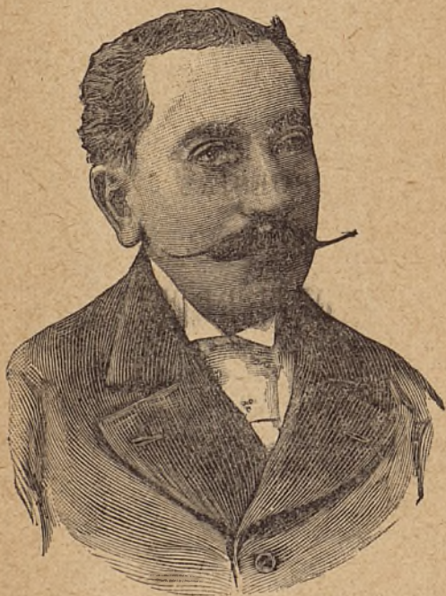
MANUEL GUTIÉRREZ NAJERA