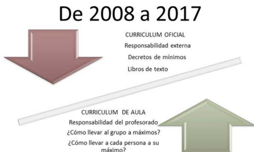
Figura 5. Tendencia en la reflexión en torno a currículum y profesorado.

Los resultados muestran que, poco a poco, nos vamos centrando más en el denominado curriculum de aula, aquel en el que el profesorado toma sus propias decisiones. El marco normativo aparece, desde 2015 en adelante, más como un punto de referencia que como algo que limita de manera determinante, al menos en la visión del profesorado universitario, si bien es cierto que en las investigaciones presentadas sobre el profesorado de niveles no universitarios no ocurre lo mismo (Cuenca, Martín, 2009:510; Granados, 2010: 307; Canal y Sant, 2012: 542; de la Montaña, 2014: 553).