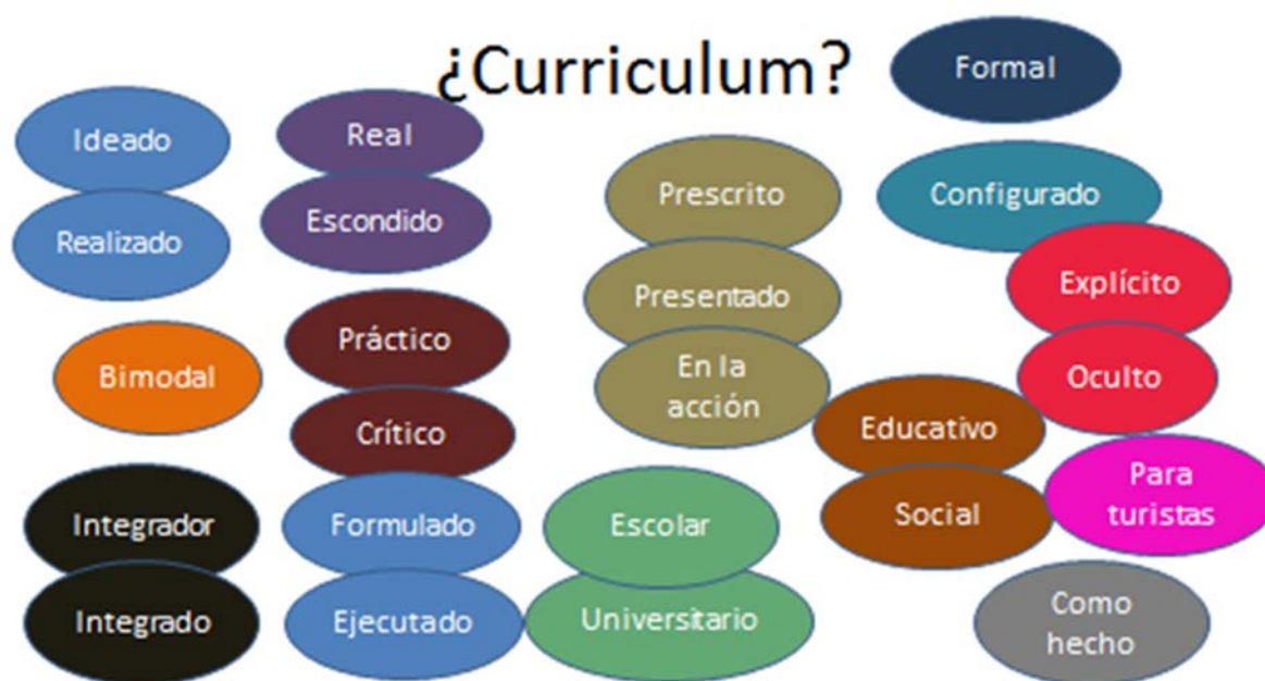
Figura 1. ¿Qué currículum?

Como puede apreciarse una complejidad de situaciones y conceptos que podrían resumirse en “currículum dispuesto por la Administración Educativa (currículum prescrito)” frente a “Estudio de los materiales curriculares que se emplean en el quehacer diario en clase (currículum presentado)” o el “Análisis de la práctica docente que se suele realizar en relación con la enseñanza sobre el medio (currículum en la acción)” (Martín, et al., 2010, p. 647).