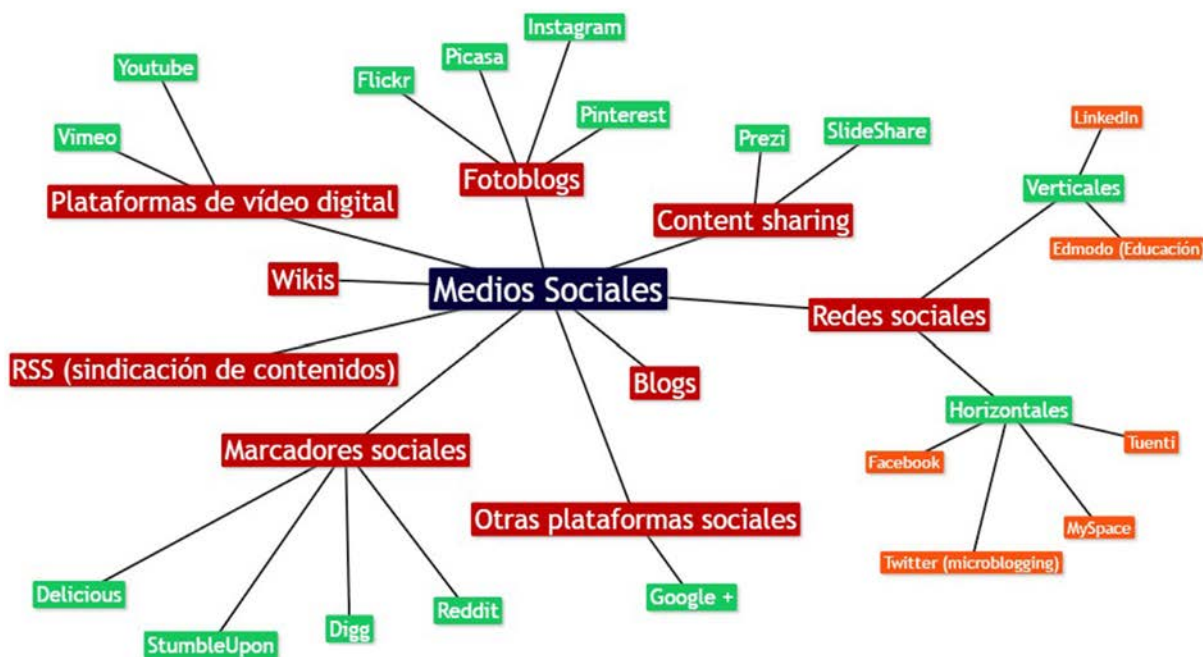
Figura 1. Mapa conceptual sobre la taxonomía de los medios sociales

Con respecto a las tipologías de medios sociales, aunque existen diversas clasificaciones al respecto (Haro, 2010; Agarwal y otros, 2012; Dowerah, 2012; Pino y otros, 2013; Kaplan, 2016), en la Figura 1 se observa la organización propia de medios sociales creada en esta investigación, que incluye algunos de los numerosísimos medios existentes, en concreto, aquellas herramientas 2.0 cercanas al concepto social más puro (fuerte conectividad e interacción). Hay que resaltar que se ha realizado una sistematización acorde con la visión que sobre los medios sociales se recoge en la parte práctica de este trabajo, siendo una más de entre las numerosas que pueden encontrarse en otras publicaciones. Por ello, es bastante complicado acertar con una clasificación en este terreno puesto que existen distintas características, según qué medios sociales, que los hace proclives a pertenecer a varias categorías, o a encontrarse a caballo entre una o más taxonomías, pudiéndose encontrar en muchas ocasiones que hay publicaciones y/o autores que contemplan una visión más amplia del concepto de "redes sociales", incluyendo en el mismo diversas plataformas que aquí se han clasificado de otra manera.