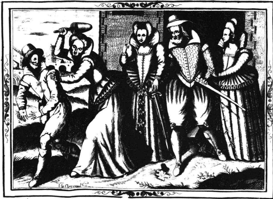
Lám. 12. 107 (4) Serie del Hijo Pródigo.

Post ubi consumptis opibus spes nulla relieta est. Tim moei lanæque animos auertere ab illo Nec superest vnta quod queat esse satis 4 Incipiunt tectis eyciuntque suis .