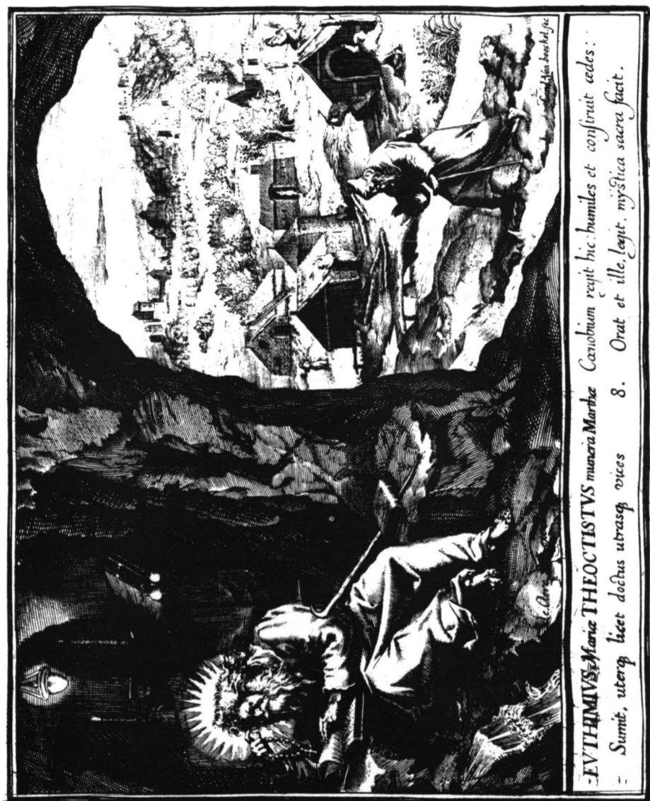
Lám. 8. 62 (8) «EVTIMIVS ET THEOCTIVS». I le Clerc excudit. Carel van Boeckel fecit. Serie Trophaeum Vitae Solitariae .