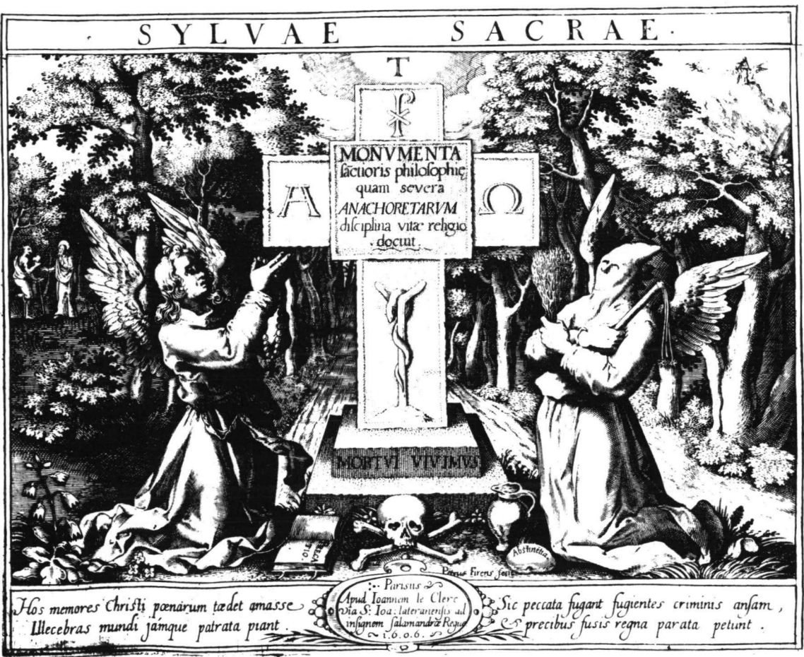
Lám. 3. 27 «SYLVAE SACRAE MONVMENTA ANACHORETARVM». Petrus Fircus fecit. Apud Ioannem le Clerc.