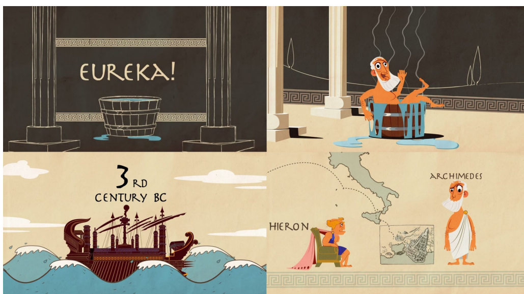
Figura 1. Fotogramas lección TED-Ed sobre el Principio de Arquímedes.

También hemos comprobado que ya existen algunas organizaciones sin ánimo de lucro que prestan sus servicios para la elaboración de contenidos didácticos, como TED-Ed, nacida en 1984 con el fin de difundir ideas a través de vídeos didácticos y educativos mediante la animación y el Motion Graphics . Actualmente disponen de una plataforma desde la que se puede acceder para consultar lecciones audiovisuales sobre cualquier tema. Podemos observar clases o conferencias grabadas y combinadas con animaciones que hacen más comprensible el tema sobre el que se habla. Su intención es la de comunicar a gran escala, llegar a todas partes del mundo y reunir en colaboración a los maestros apasionados por la enseñanza con animadores apasionados por la comunicación.