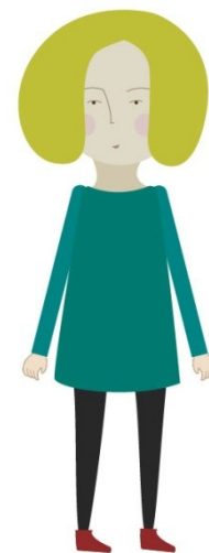
Figura 5. Personaje

Vamos a diseñar un personaje de forma sencilla. Tenemos dos opciones, componerlo a base de elementos geométricos como llevamos haciendo hasta ahora o dibujarlo con la herramienta Pluma , siempre desde Illustrator ® . En nuestro caso vamos a combinar ambas técnicas, pero un personaje puede ser tan sencillo como se quiera. Cuando el diseño del personaje está listo lo importamos a After Effects ® , una de las grandes ventajas de trabajar con los paquetes de Adobe ® es que todos sus programas tiene mucha cohesión y facilitan las tareas, respeta la separación de capas de un archivo de illustrator y si necesitamos hacer algún cambio en la imagen desde Illustrator automáticamente se actualizará en After Effects ® . Con esta práctica comprobamos cómo podemos animar un personaje de una forma fácil partiendo de una imagen completamente estática. Gracias a una herramienta de After Effects ® llamada herramienta de posición libre, podremos animar nuestro personaje, aunque con ciertas limitaciones, los resultados son muy buenos. Esta herramienta coloca una serie de chinchetas en las articulaciones de nuestro personaje que nos permite moverlo como una marioneta, pero además hacerlo con mucha flexibilidad. Solo tenemos que colocar a nuestro personaje en una posición, adelantarnos en nuestra línea de tiempo y cambiar su posición. After Effects ® calculará las posiciones intermedias que hay entre las dos posiciones.