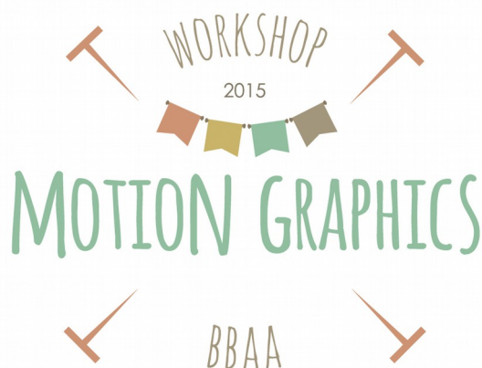
Figura 3. Diseño de imagen.

Si nuestra intención es crear una serie de vídeos, resultará esencial tener una imagen que se convierta en nuestra marca, que nos identifique. Un logotipo que además seremos capaces de animar y nos servirá como cortinilla de nuestros audiovisuales. De nuevo, debe ser una imagen icónica que esté estrechamente relacionada con nuestro trabajo. Para ellos vamos a utilizar el software Adobe Illustrator ®.