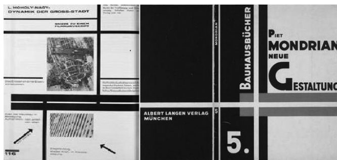
FIG. 2. Interior y portada del n.º 5 de la revista Bauhausbücher, atribuida a Moholy Nagy. 1924.

Los créditos y cartel de la película The man with the golden arm (Fig. 3) son un excelente ejemplo de la asimilación del uso de estos «filetes», en este caso actuando como marco del título de la película en los créditos y del símbolo del brazo en el cartel, cuyo significado nos explica en el documental Bass on Titles : «La película