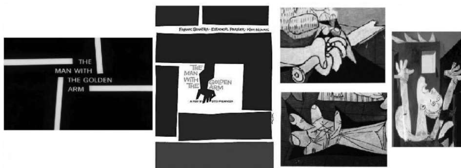
FIG. 3. De izquierda a derecha: créditos y cartel de la película The man with the golden arm y detalles de El Guernica de Picasso, 1937.

trata sobre la adicción a la heroína, y el símbolo del brazo, con su forma quebrada, expresa la existencia despedazada y desarticulada de un adicto» 18 . Parece evidente la relación existente entre este símbolo y el Guernica de Picasso, muy conocido en Estados Unidos tras su gira de 1939, durante la que recibió muchísima atención y una amplia cobertura mediática 19 . En cuanto al uso de la tipografía, tanto en éste como en otros trabajos de Bass siempre encontramos una supremacía de la función informativa de las mismas, aunque sin descuidar ni el lado emocional ni las posibilidades del movimiento. Bass es un maestro a la hora de mantener la independencia de texto e imagen a la vez que crea una alianza definitiva entre ambos 20 .