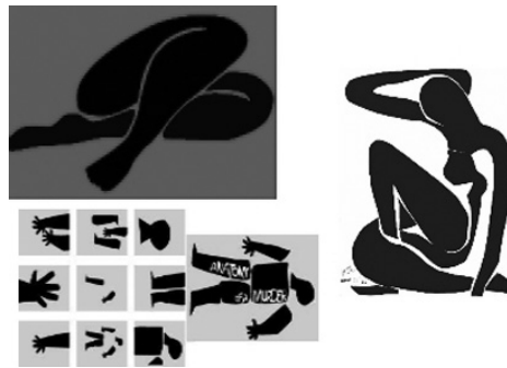
FIG. 1. De izquierda a derecha: créditos de Anatomy of a Murder 7 , detalle del cartel de Such Good Friends 8 y Femme bleue assis I de Matisse, 1952.

Pese a que, más allá de trabajos concretos, esta influencia europea se encuentra siempre latente en la obra de Bass, nos centraremos a continuación en el análisis de los títulos de crédito creados para la película de Otto Preminger The man with the golden arm , ya que nos permitirán cumplir el doble objetivo de entroncar su estilo con el arte europeo y al mismo tiempo definir la técnica y precedentes de los motion graphics , lenguaje muy ligado a los experimentos audiovisuales de las vanguardias europeas y en cuyo uso cinematográfico el diseñador es pionero. Debemos tener en cuenta que nos encontramos ante un creador original cuyo estilo se caracteriza precisamente por lo personal de sus formas, pero la influencia europea se hace presente a través de su concepción del propio diseño gráfico como disciplina, de sus elementos y objetivos, ya que es producto de la asimilación e interiorización de su formación en unas escuelas de diseño que en esa época acogían a muchos de los artistas europeos de vanguardia empujados al exilio tras el auge del nazismo 9 ; algunos de ellos, grandes innovadores en los medios y las técnicas ligados directamente al diseño gráfico como el cartel, la tipografía o los fotomontajes.