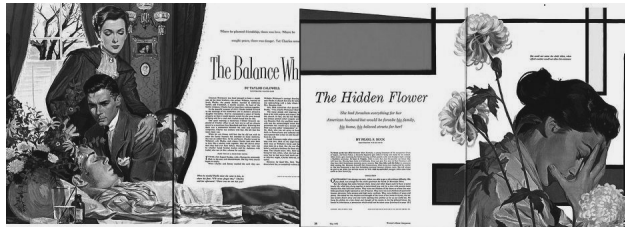
FIG. 4. Revista Woman's Home Companion . Izquierda, interior del número de noviembre de 1950. Derecha, interior del número de mayo de 1952.

Vemos aquí cómo el ilustrador Walter Skor pasa del estilo clásico de ilustración de la época a la irrupción del estilo moderno en su diseño para la portada de mayo de 1952. En esta última, la eliminación del fondo tradicional en sí es una novedad,