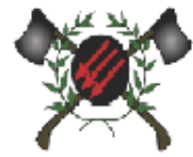
Figura 5. Grupo R.A.S.H

Su ideología no es tan heterogénea como los grupos de extrema izquierda, aun-