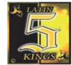
Figura 26. Número cinco Latin King