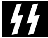
Figura 4. Emblema SS