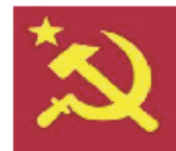
Figura 6. Bandera comunista