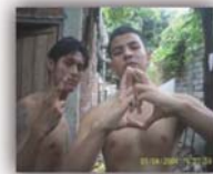
Figura 35. Fotografía de dos miembros de la Banda Ñeta realizando su saludo típico.