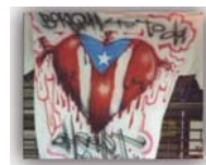
Figura 31. Graffiti de un corazón con los colores de la bandera de Puerto Rico.