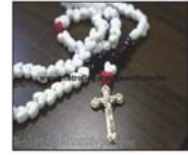
Figura 33. Collar de Cuentas Ñeta

En cuanto al saludo, los Ñetas suelen saludarse cruzando los dedos índice y corazón (véase figura 35) y añadiendo la frase “Ñeta de cora”. Con este gesto con los dedos interpretan que “el grande protege al pequeño” y “Ñeta de cora” es la abreviación de “Ñeta de corazón”.