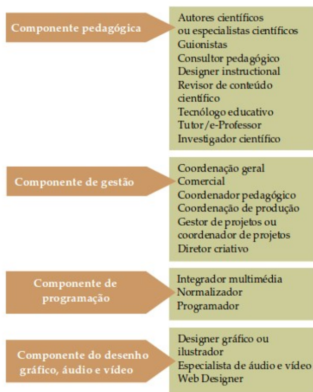
Figura 2. Competências e funções organizadas em componentes.