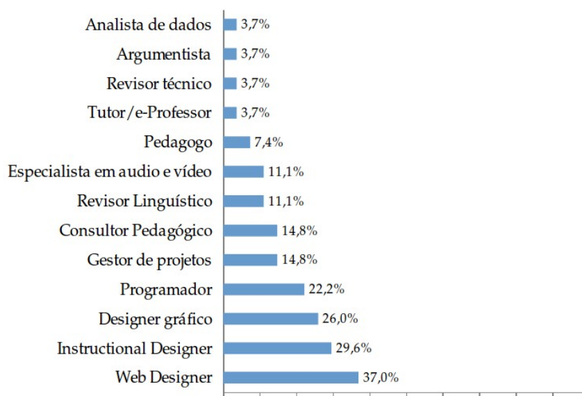
Gráfico 3. Funções que são exercidas fora da instituição.

Podemos organizar essas funções em dois grupos de profissionais. O primeiro é formado pela parte mais técnica: web designer, designer gráfico e programador que (na maioria das vezes) se fundem numa mesma pessoa. O segundo grupo é formado pelo designer instrucional, consultor pedagógico e gestor de projetos, que em algumas instituições é a mesma função. Em busca de ampliar os dados obtidos pelo questionário, buscamos na entrevista semiestruturada ampliar o conhecimento dessas funções dentro do setor de produção de conteúdos e-Learning. Cada coordenador nos forneceu informações das funções que são exercidas dentro de sua instituição. Na Tabela 5 são apresentadas as principais funções dos membros de cada instituição.