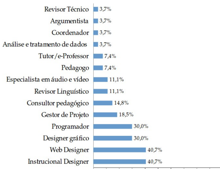
Gráfico 1. Principais funções dos funcionários.

Relativamente às funções dos inquiridos, o questionário nos mostrou que a maioria desempenham as funções de web designer e designer instrucional (Gráfico 1).