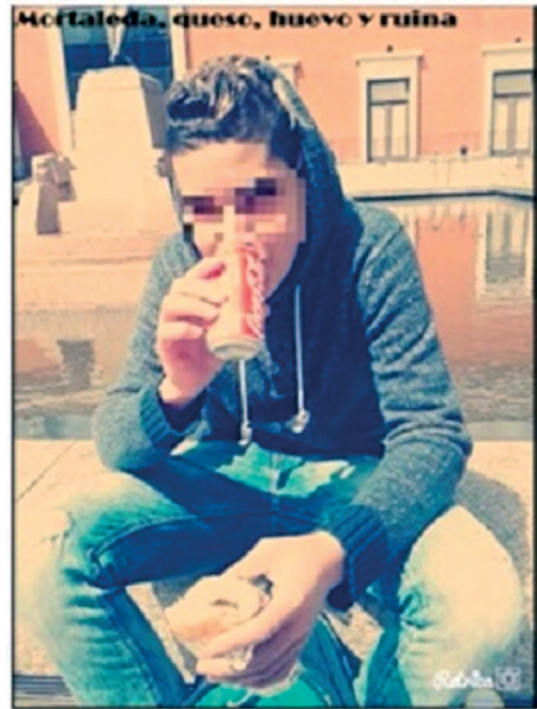
FIGURA 1.—Mortadela, queso, huevo y ruina. Fotografía extraída del documental, del apartado que los menores decidieron dedicar a hablar de la comida en el centro

mente preestablecidos o estancos. De este modo, pudimos intercambiar y combinar roles como investigador/a investigado/a o experto/a aprendiz. Es decir, no solo nosotras investigamos, por ejemplo, respecto a sus prácticas en la ciudad, ellos también se interesaron por saber qué era lo que nosotras hacíamos, y con quién y para qué. Por tanto, todos desempeñamos roles mixtos: como investigadores y expertos, pero también como investigados y aprendices. Además, la reflexividad de la metodología utilizada, en la que las decisiones podían ser modificadas ya que no todo estaba decidido, así como el uso del arte y el proceso creativo, nos permitió inventar nuevos roles y relaciones necesarias para componer y dar respuesta en tiempo real a otras posibilidades y necesidades que teníamos, aunque a veces no sabíamos muy bien cuáles eran y qué podían implicar a la larga. De este modo, hemos llegado a sentirnos amigos, confidentes e incluso hermanos.