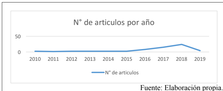
Figura 1: Distribución documental según el año de publicación

El número de publicaciones sobre “programas educativos y su construcción” durante el periodo de 2010 a 2019 (con los criterios de exclusión seleccionados), además de su posterior selección es de 62 trabajos. Durante este transcurso temporal se observa un aumento progresivo de la productividad científica que se incrementa gradualmente con el tiempo. Siendo su aumento más claro en los años 2017-2018, como lo muestra la figura 1. El número de publicaciones anuales oscila entre 6,2 trabajos por año, siendo el año que más se publicó, el año 2018 con 24 publicaciones y de menos publicaciones el año 2011 con 1 publicación, esto en el periodo temporal del 2010 al 2019.