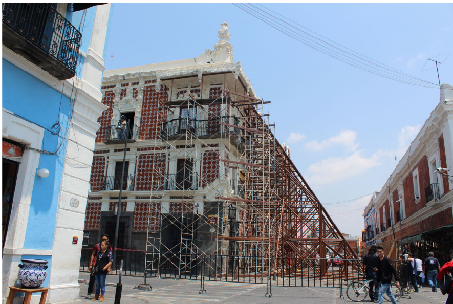
Fig. 6. Visión de la fachada exterior del Museo Casa Alfeñique apuntalada por los daños ocasionados en el terremoto de 2017. Puebla. México.