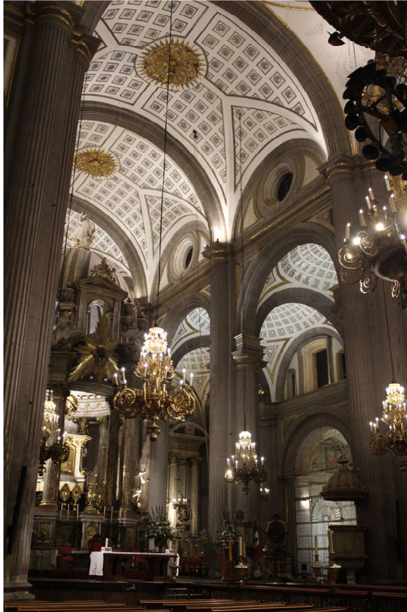
Fig. 7. Visión del ciprés y la nave central de interior de la Basilica Catedral de Puebla. México.

Asimismo, buscando dotar al ciudadano interesado por los bienes patrimoniales de herramientas con un enfoque más específico que los talleres generales, en 2018 apostaron por ofertar una formación complementaria en forma de cursos de extensión con una duración de entre uno a tres meses. Los talleres más representativos y con mejor acogida fueron el de Conservación preventiva y estabilización del patrimonio documental, seguido del de Elaboración de vitrales con técnica de Tiffany y emplomado 28 y del de Técnica de cartonería, así