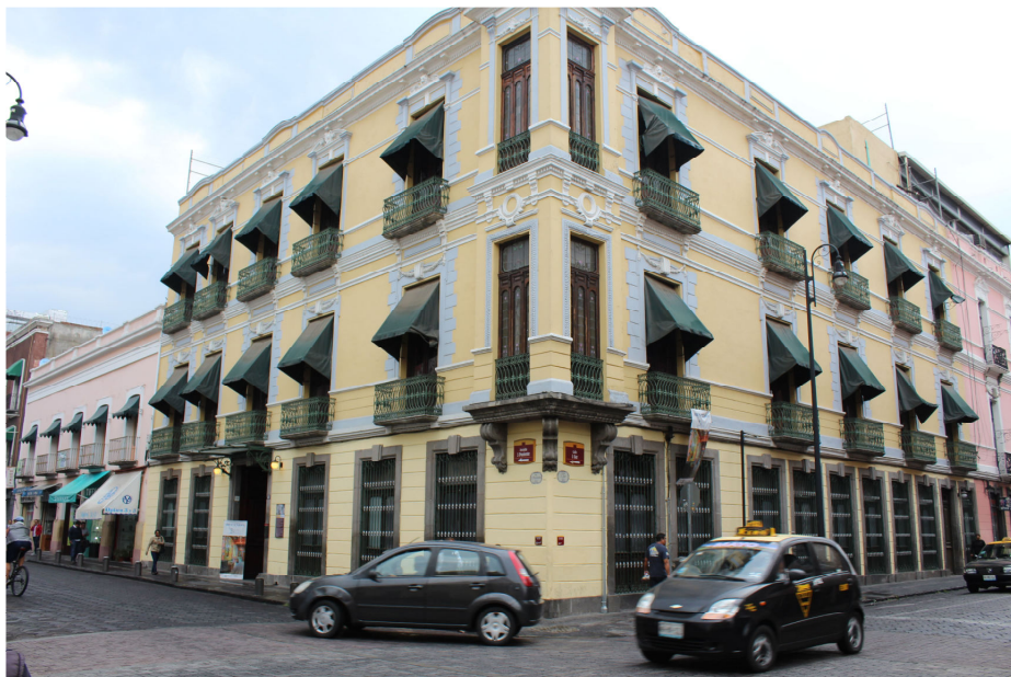
Fig. 5. Fachada del Museo José Luis Bello y González. Puebla. México.

del Estado de Puebla involucró a los jóvenes de la Escuela Taller en sus labores de mantenimiento y restauración 23 .