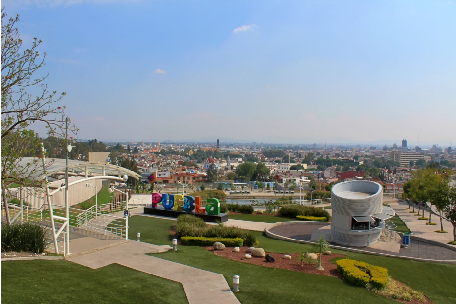
Fig. 2. Vista desde el Mirador de Mantarraya ubicado en la zona rehabilitada de los Fuertes y la Batalla del 5 de Mayo. Puebla. México.

amparada en las manifestaciones culturales, debe apostar por fórmulas estratégicas de planificación y gestión en la búsqueda de herramientas sostenibles.