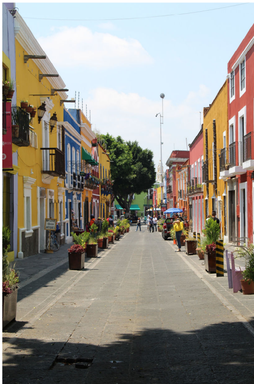
Fig. 1. Vista general de la calle 6 Sur o Callejón de los Sapos. Puebla. México.

Estos nombramientos, junto con la excepcionalidad del entramado de riqueza cultural existente en su Centro Histórico, han posibilitado que, desde el Gobierno del Estado, se plantee un discurso cultural específico cuya finalidad se ha localizado en acciones encaminadas a crear una mayor oferta de productos turísticos, como ha sido, entre otros espacios, el pintoresco e icónico Callejón de los Sapos [Figura 1]. Sin embargo, la peculiaridad y la singularidad de este patrimonio, su valor cultural y social y, especialmente, los desastres naturales acaecidos en 1999 y en 2017, han obligado a que las actividades de conservación y restauración sean una de las que mayor demanda han requerido en la gestión de la urbe. En este sentido, las acciones de la Escuela Taller de Capacitación en Restauración de Puebla (creada en 2001) han sido determinantes para la recuperación y mantenimiento de la ciudad.