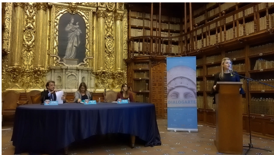
Fig. 8. Instantánea de la ponencia El oro y el Barroco en el ciclo de conferencias “Dialogarte. La Jiribilla del Barroco” organizadas por la Escuela Taller de Capacitación en Restauración de Puebla y la Secretaría de Cultura en octubre de 2018.

Y, para finalizar la lista de actividades llevadas a cabo por la Escuela Taller y sus participantes, es más que oportuno dedicar unas líneas para reflejar su implicación con la difusión de la cultura. En este sentido, la mencionada institución ha organizado jornadas y ciclos de conferencias como DIALOGARTE. Junto con las entidades universitarias de la localidad y la Secretaría de Cultura del Estado de Puebla, han desarrollado dos ediciones con un programa con especialistas internacionales para tratar temas como “el Barroco en el Arte Internacional” (2018) o cuestiones de gran interés como “el fenómeno de la Conquista y la Figura de Hernán Cortés” (2019) [Figura 8].