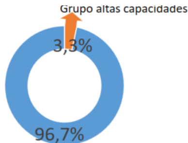
Figura 3. Grupo AC por multipotencialidad

Además, establecimos la prevalencia multipotencial de AC. (Ver Figura 3).