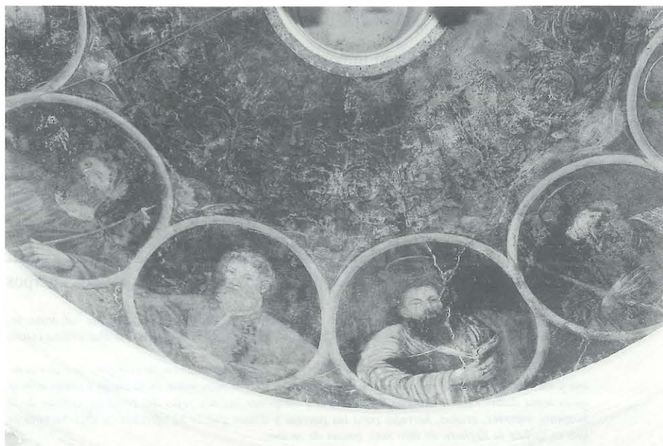
FIG. 4. Apóstoles en la base de la cúpula de Nuestra Señora de Altagracia.

en altura, respondiendo a las necesidades de correspondencia con el interior. En el muro, sobre la portada de entrada del piso bajo, el vano de iluminación del camarín, y coronando el espacio, una cúpula vista de ladrillo encalado y linterna superior cerrada en cupulín.