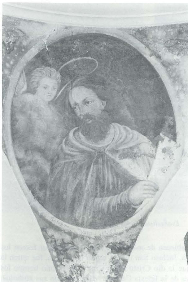
FIG. 5. Evangelista.

siguiente gliptografía: SE HIZO ESTA/OBRA A EXPENSA/DE LOS DEBOTOS/DE N.S. DE LA ANTIGUA SIENDO MAY. D. AL/ONSO CALDERON Y D./PEDRO DURAN A. DE 1853 67 .