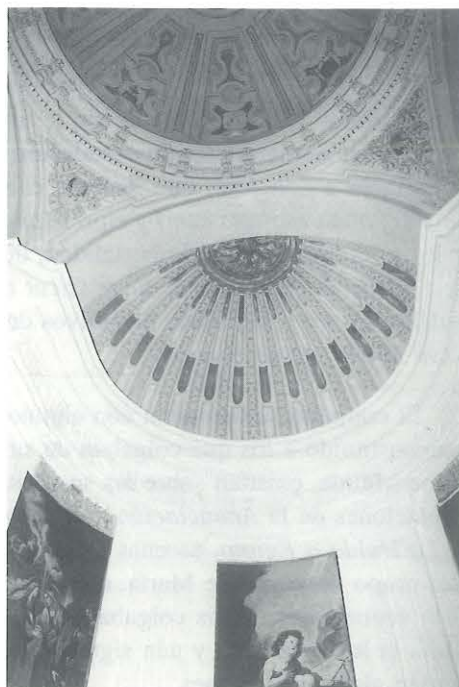
FIGS. 1 Y 2. Exterior e interior del camarín de Belén.

nalidad, concibiendo espacios avenerados unidos a uno principal cuadrado, distribuidos de manera simétrica a un lado y otro del eje imaginario creado por la hornacina-ostensorio y vano del frontis. Es una solución derivada de la cruz griega, como ocurre en el caso del camarín guadalupano, con terminaciones semicirculares de tintes borrominescos en dos de sus lados, y donde a diferencia del exterior, se aprueba un impetuoso dinamismo en las superficies. Los brazos, cerrados con veneras, se hallan marcados por cajeadas pilastras gemelas angulares de capiteles compuestos sobre las que emergen arcos de medio punto que responden al volteo de la cúpula por encima de las pechinas. El friso se adorna con triglifos y metopas con rosetas entre parejas de mutilos que enlazan con la cornisa de la cúpula, inflexionando sus superficies. Ésta, circular, está recorrida por bandas radiales que concurren hacia el óculo de la linterna.