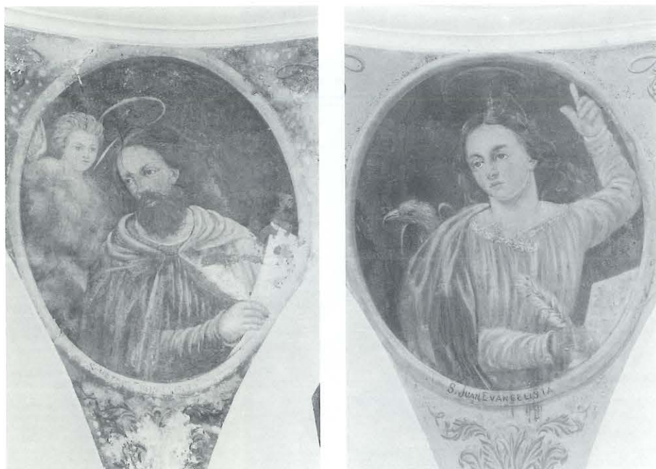
FIG. 6. Evangelistas de las pechinas.

relaciones con la Virgen se establecen de modo claro: los Evangelistas fueron los primeros que hablaron de María. Incluso San Lucas, según la leyenda, fue quien la pintó, y San Juan es el hijo que le dio Cristo en la Cruz 68 . Al mismo tiempo los Apóstoles simbolizan los pilares de la Iglesia Católica, cada uno con sus atributos, símbolos del Nuevo Testamento. Sobre ellos, el cielo y ángeles, alusión a Nuestra Señora como Regina Angelorum .