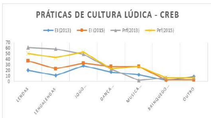
Figura 1 – Práticas de Cultura Lúdica relacionadas com a Cultura Regional e Património – atividades mais mencionadas pelos profissionais

De uma análise ao gráfico atrás apresentado (Figura 1) visualizamos que os professores mencionaram fazer uma maior abordagem às lendas, lengalengas e ao jogo tradicional nas práticas lúdicas emergentes em atividades de sala de aula na escola do 1.º ciclo. Neste mesmo contexto os educadores, para além das lendas e jogo tradicional, também mencionam o recurso frequente à dança e à música na educação pré-escolar. Alguns destes profissionais deixaram o testemunho de que estas práticas estariam a ser implementadas pelo currículo regional (CREB) nas escolas e que estariam a ser uma mais valia para os alunos, embora que apenas com uma frequência periódica, que na sala dos mais novos era semanal, ao invés da sala dos mais velhos, que era mensal. Os discursos recolhidos apontam para a importância destas práticas de permitirem aprofundar a sua cultura, de forma lúdica e complementar a outras fontes de conhecimento. Para vários autores, o seu valor acrescido é motivado da relação e interação criada pela própria atividade prazerosa (Brougère, 2000; Condessa, 2018; Bulhões & Condessa, 2019; Ferreira, 2021).