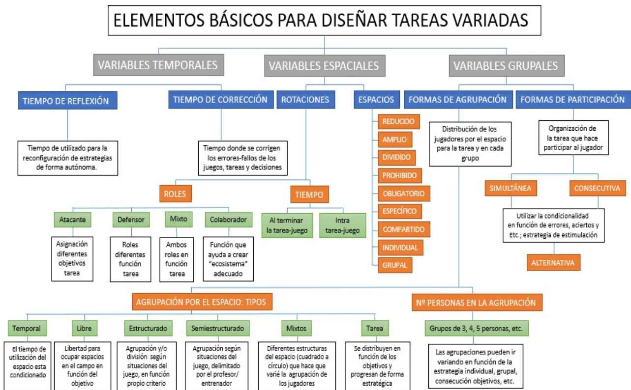
Figura 3. Estructura básica del esquema mental que el entrenador debe manejar para crear tareas/juegos variados.

En la Figura 3, se observa lo que se podría denominar “el esquema mental” que el entrenador debe tener para la creación de una metodología variada de juegos/tareas. Esta propuesta básica muestra una pequeña parte de los recursos que debería de manejar la persona que diseña el entrenamiento con el objetivo de cumplir con el “Más y diferente” (Anderson, 2011).