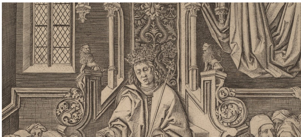
Figura 5. Maestro FVB. Ca. 1480. El juicio de Salomón (detalle). Grabado sobre papel. National Gallery of Art de Washington. Rosenwald Collection (1943.3.197).