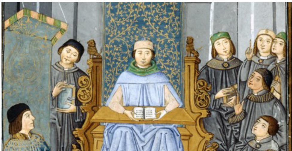
Figura 4. Anónimo. Ca. 1492-1494. Introductiones latinae de Antonio de Nebrija. fol. I v. (detalle).