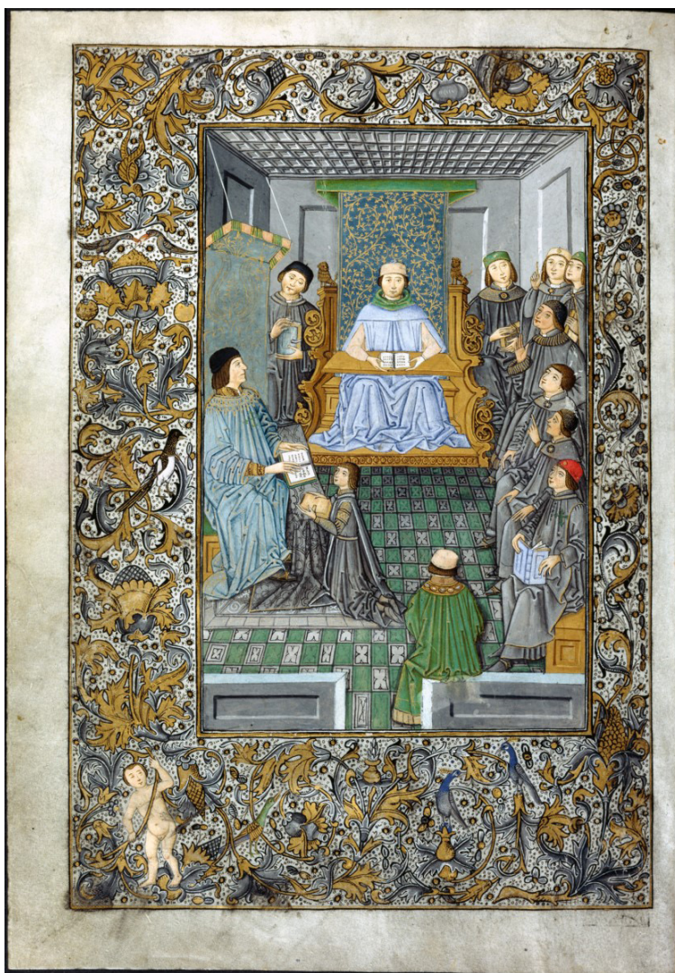
Figura 1. Introducciones latinae de Antonio de Nebrija. Fol. 1v.

La datación del manuscrito ha sido otro de los temas frecuentemente tratados. Los estudios señalan como marco de referencia los años 1487 y 1495, correspondientes al momento en el que Nebrija entra al servicio de don Juan de Zúñiga y a la primera impresión de la recognitio o tercera edición de las Introducciones (Sánchez, 1996, pp. 654-655).